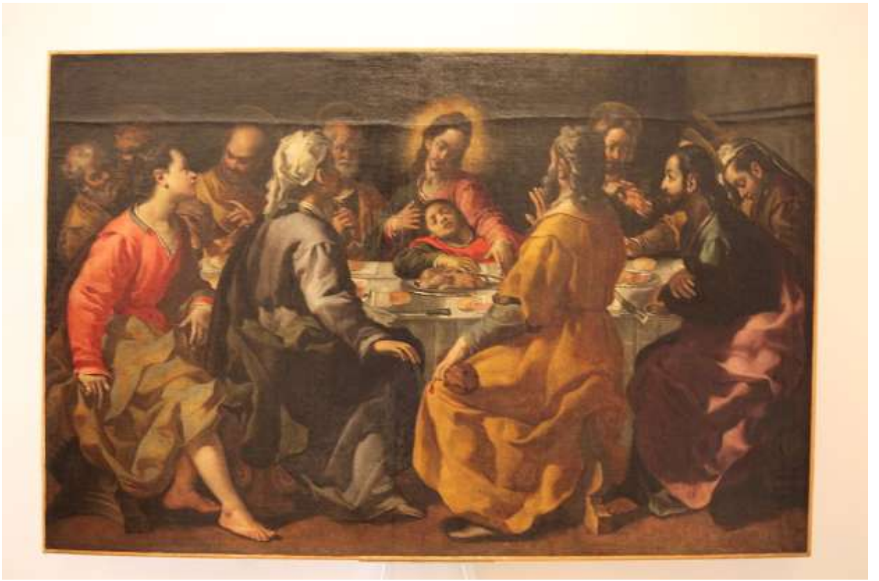
Илл. 234.16. Андреа Босколи. Тайная вечеря.