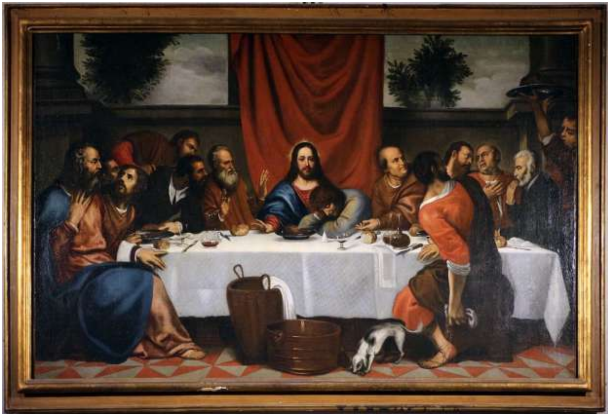
Илл. 234.11. Якопо Пальма Младший. Тайная вечеря.