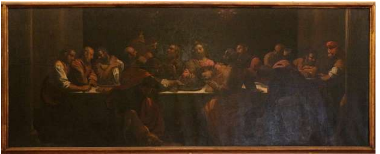
Илл. 234.12. Ипполито Скарселлино. Тайная вечеря.