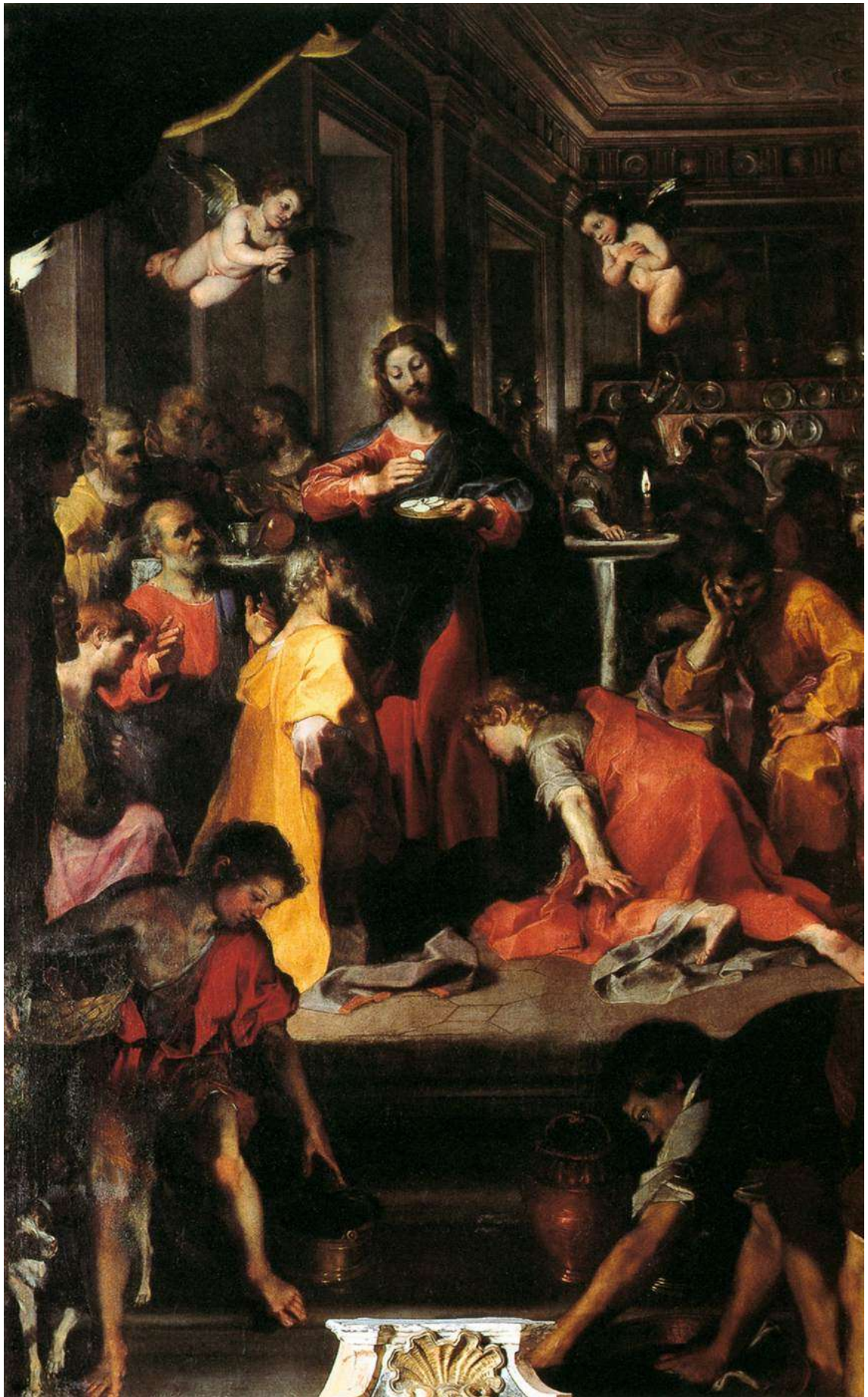
Илл. 234.8. Федерико Бароччи. Установление Евхаристии.