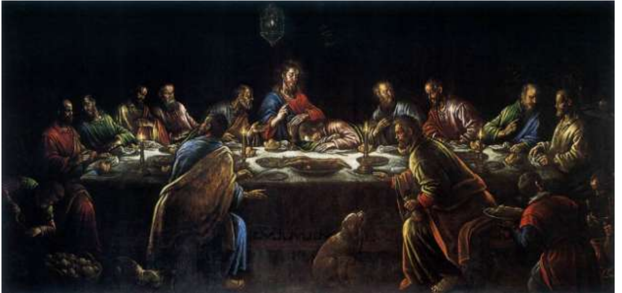
Илл. 234.15. Леандро Бассано. Тайная вечеря.