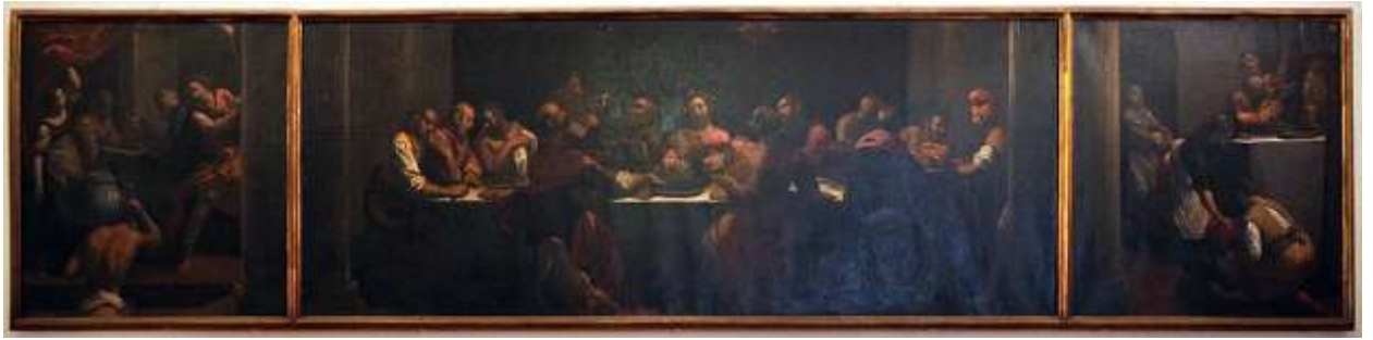
Илл. 234.13. Ипполито Скарселлино. Триптих.