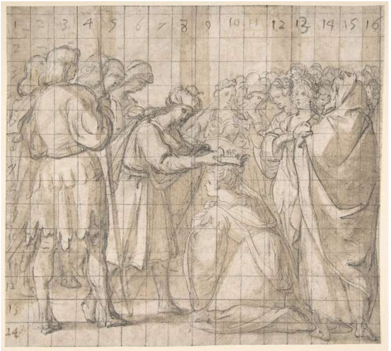
Илл. 234.1. Бартоломео Кардуччи. Коронование Эсфири Агосфером. Рисунок.