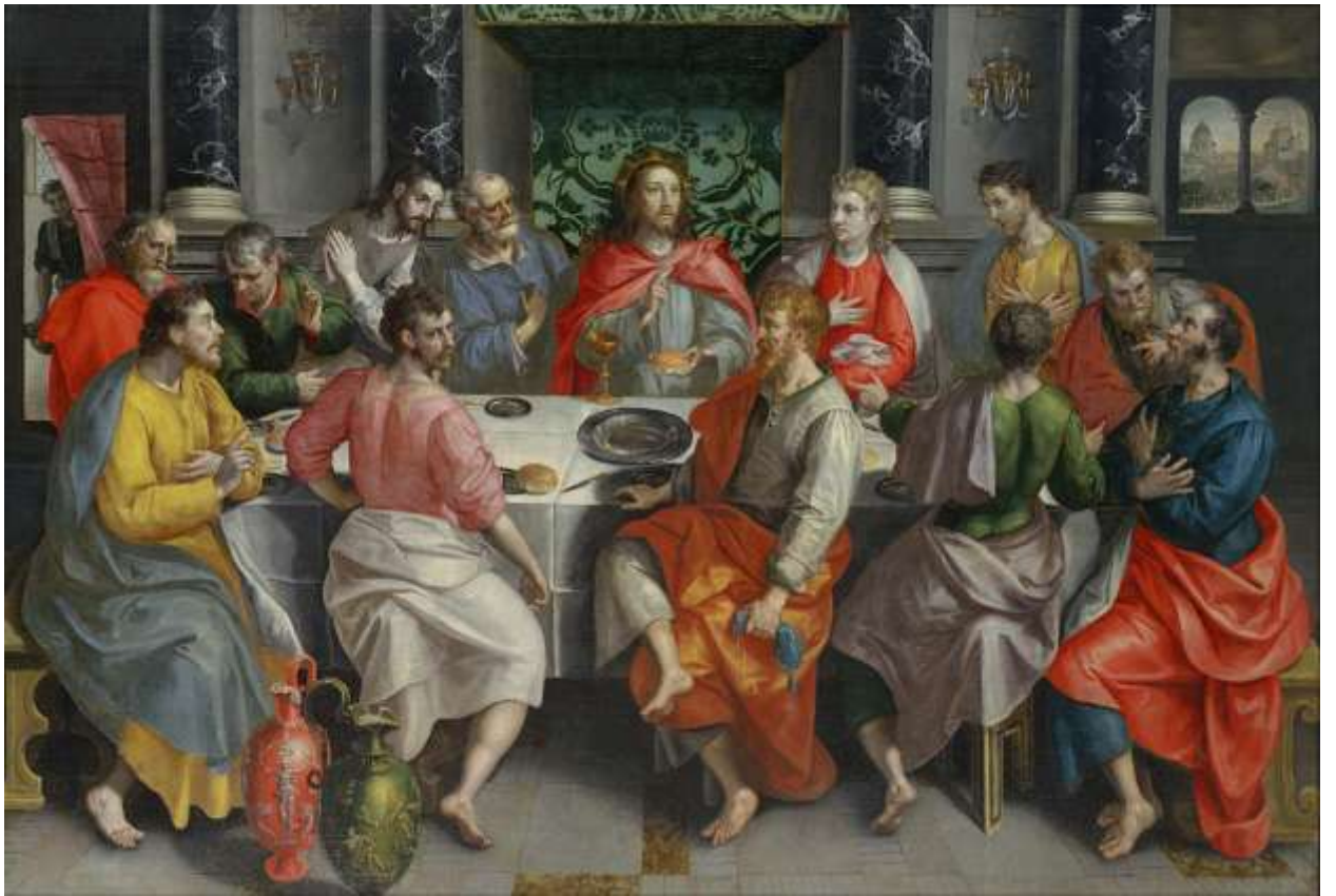
Илл. 234.5. Мартен де Вос Старший. Тайная вечеря.