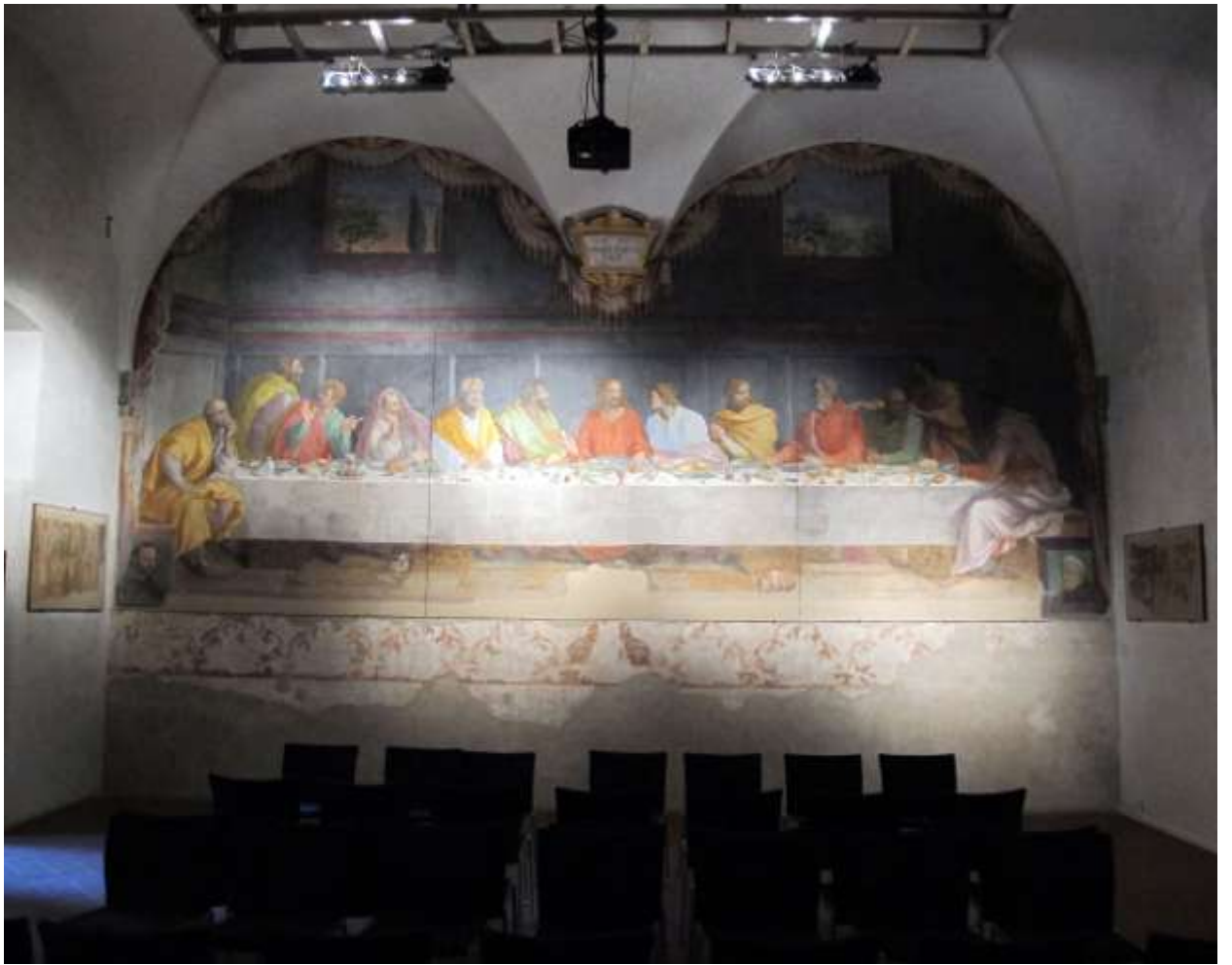
Илл. 234.7. Монастырь Санта-Мария дель Кармине во Флоренции.