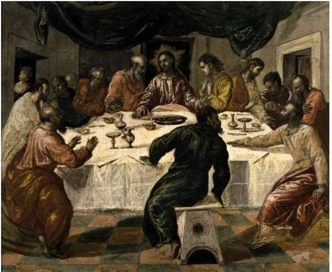
Илл. 234.10. Эль Греко. Тайная вечеря.