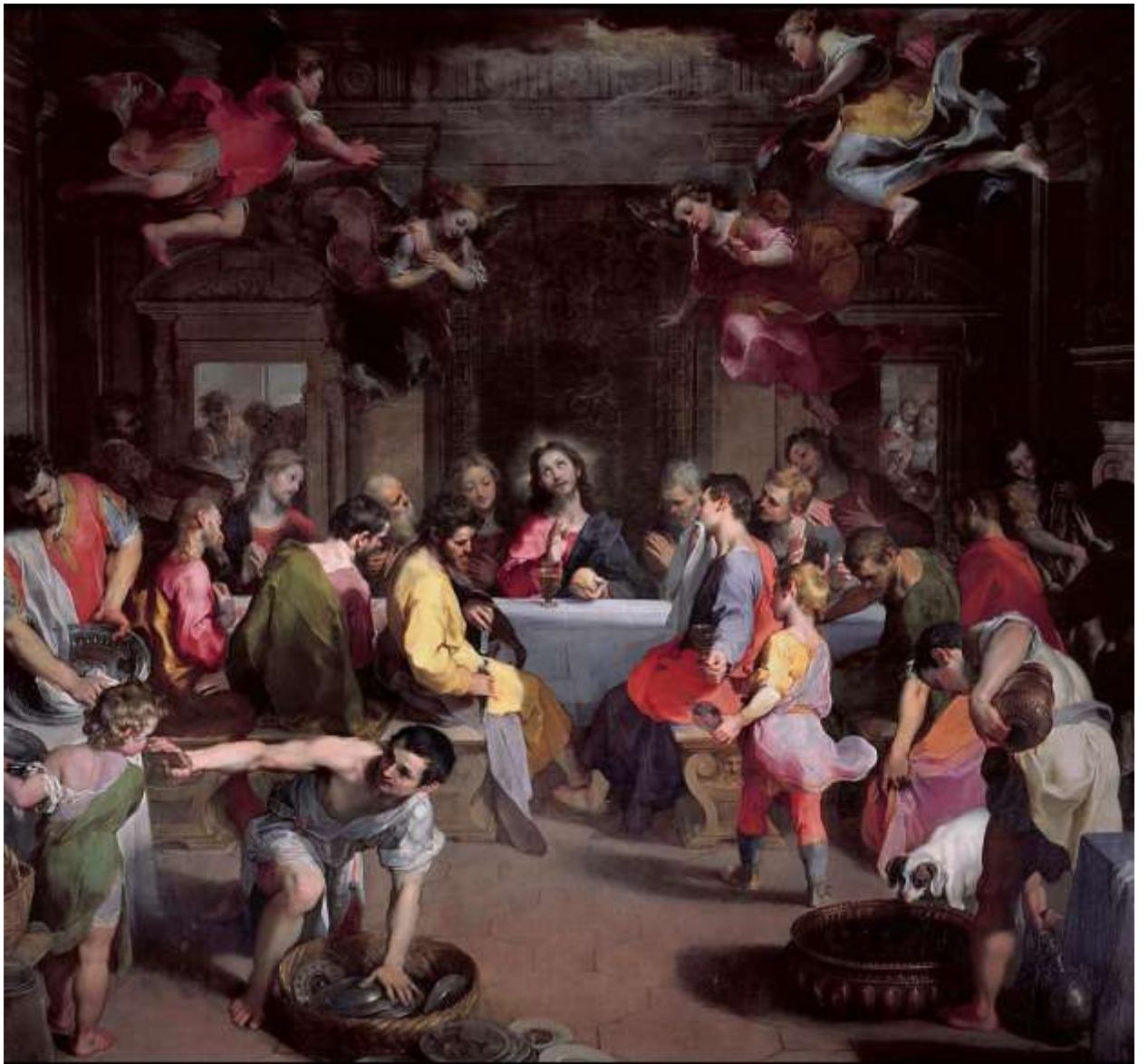
Илл. 234.9. Федерико Бароччи. Тайная вечеря.