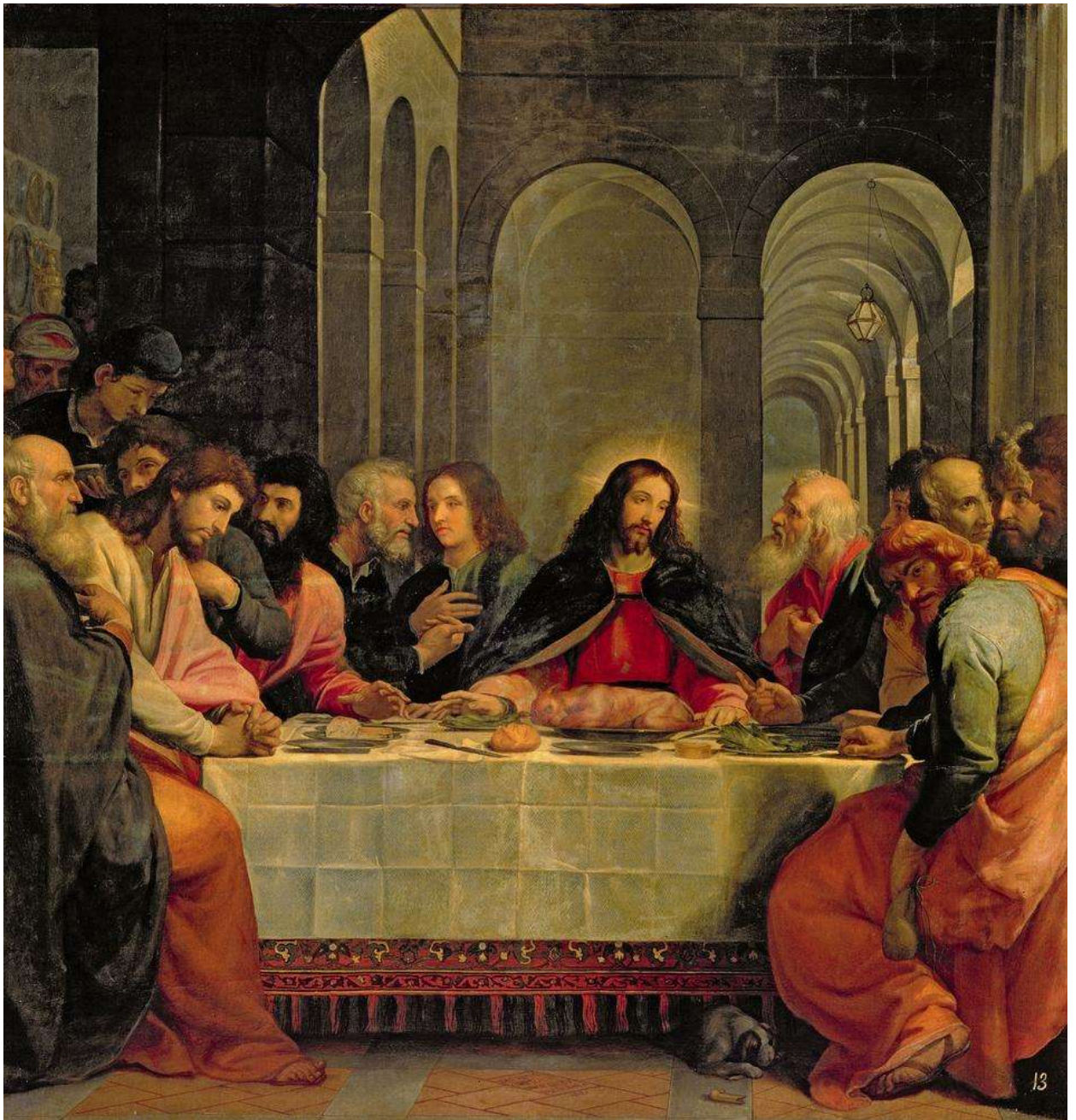
Илл. 234.4. Бартоломео Кардуччи. Тайная вечеря.