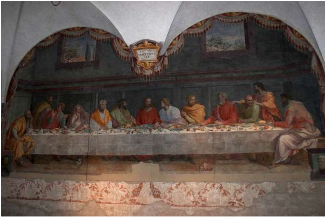
Илл. 234.6. Алессандро Аллори. Тайная вечеря.