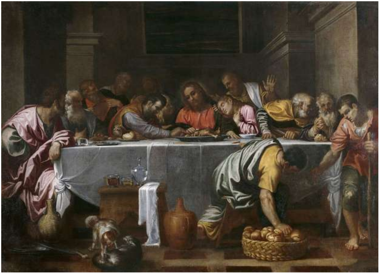
Илл. 234.14. Агостино Карраччи. Тайная вечеря.