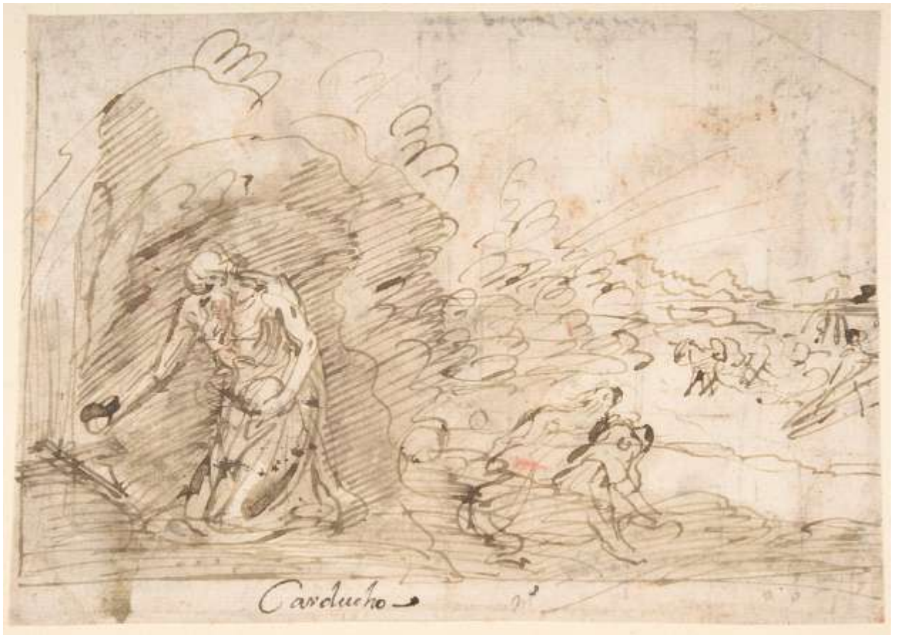
Илл. 234.2. Бартоломео Кардуччи. Покаяние св. Иеронима. Рисунок.