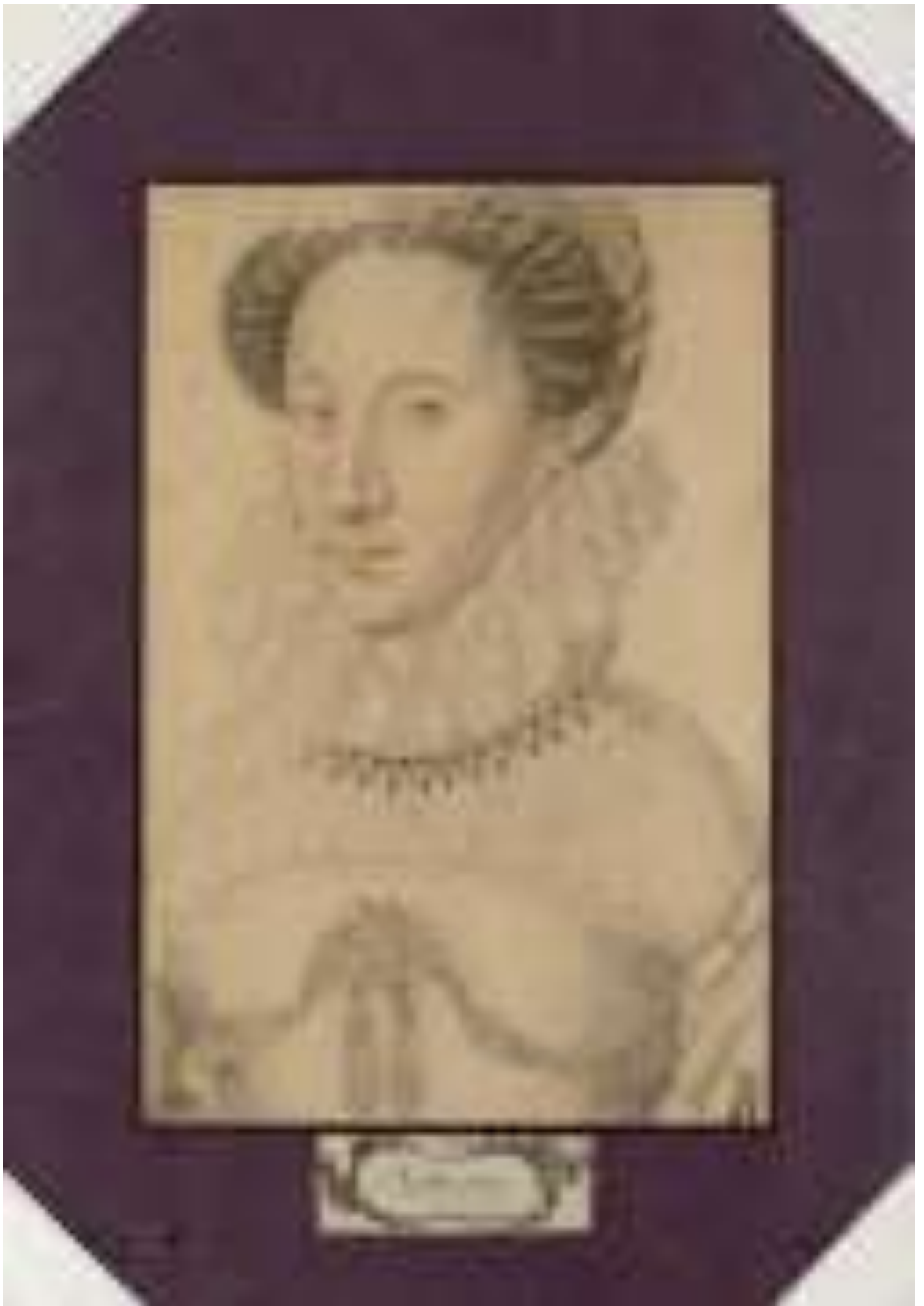
Илл. 218.9. Пьер Дюмустье Старший. Портрет Маргариты Валуа. Рисунок.