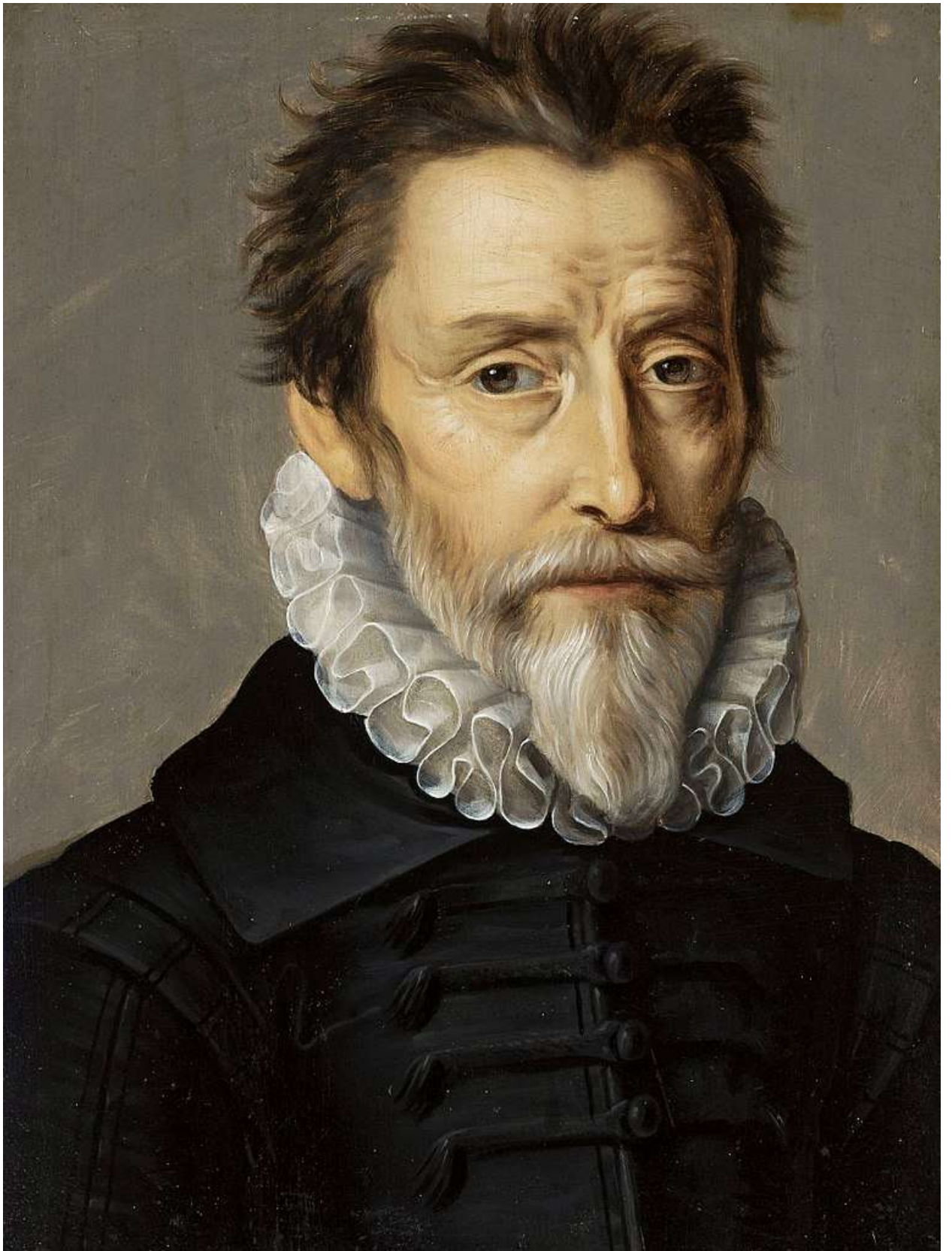
Илл. 218.13. Пьер Дюмустье Старший. Никола де Невиль.