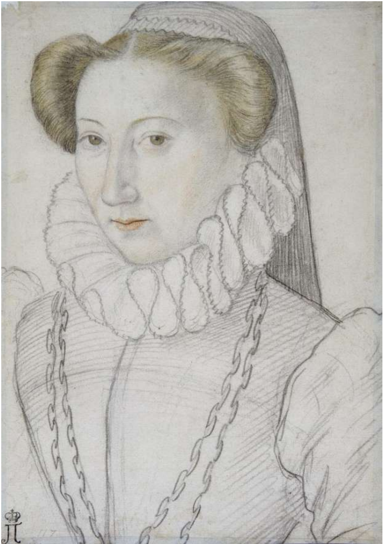
Илл. 218.11. Пьер Дюмустье Старший. Женский портрет. Рисунок.