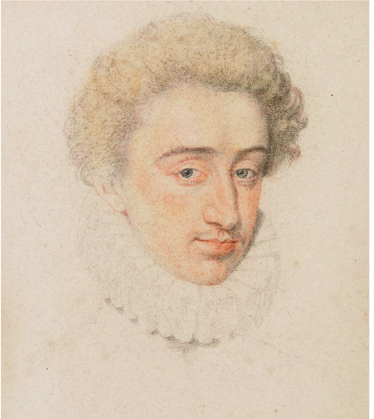
Илл. 218.5. Пьер Дюмустье Старший. Генрих Наваррский. Рисунок.