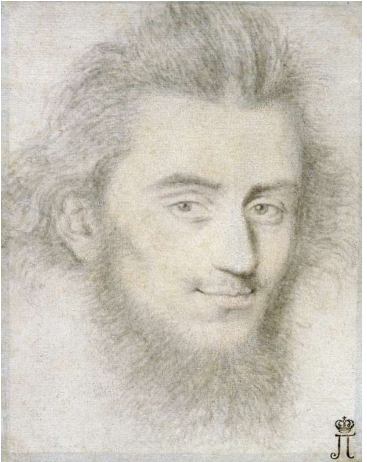
Илл. 218.7. Пьер Дюмустье Старший. Портрет юноши. Рисунок.