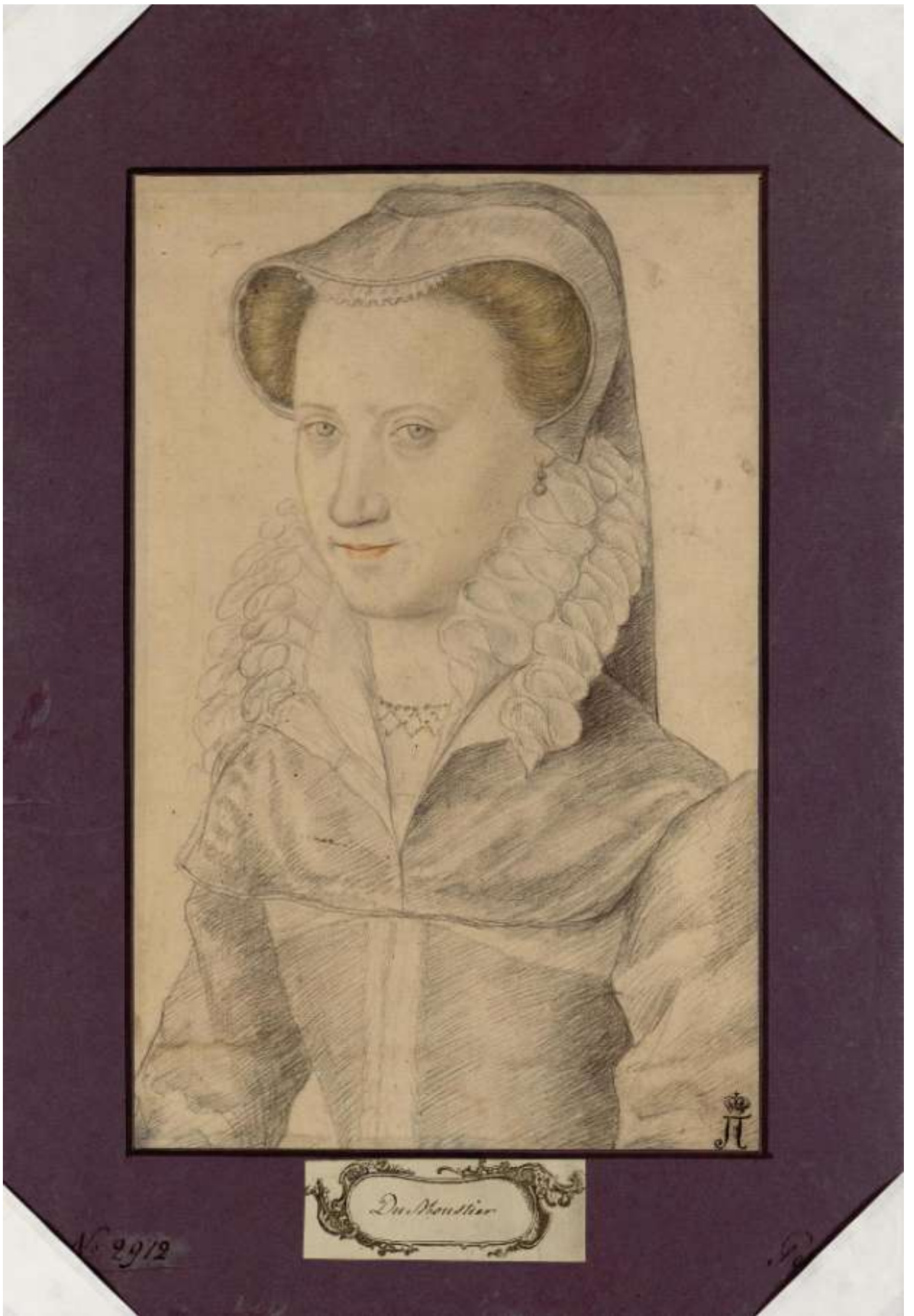
Илл. 218.10. Пьер Дюмустье Старший. Портрет девушки. Рисунок.