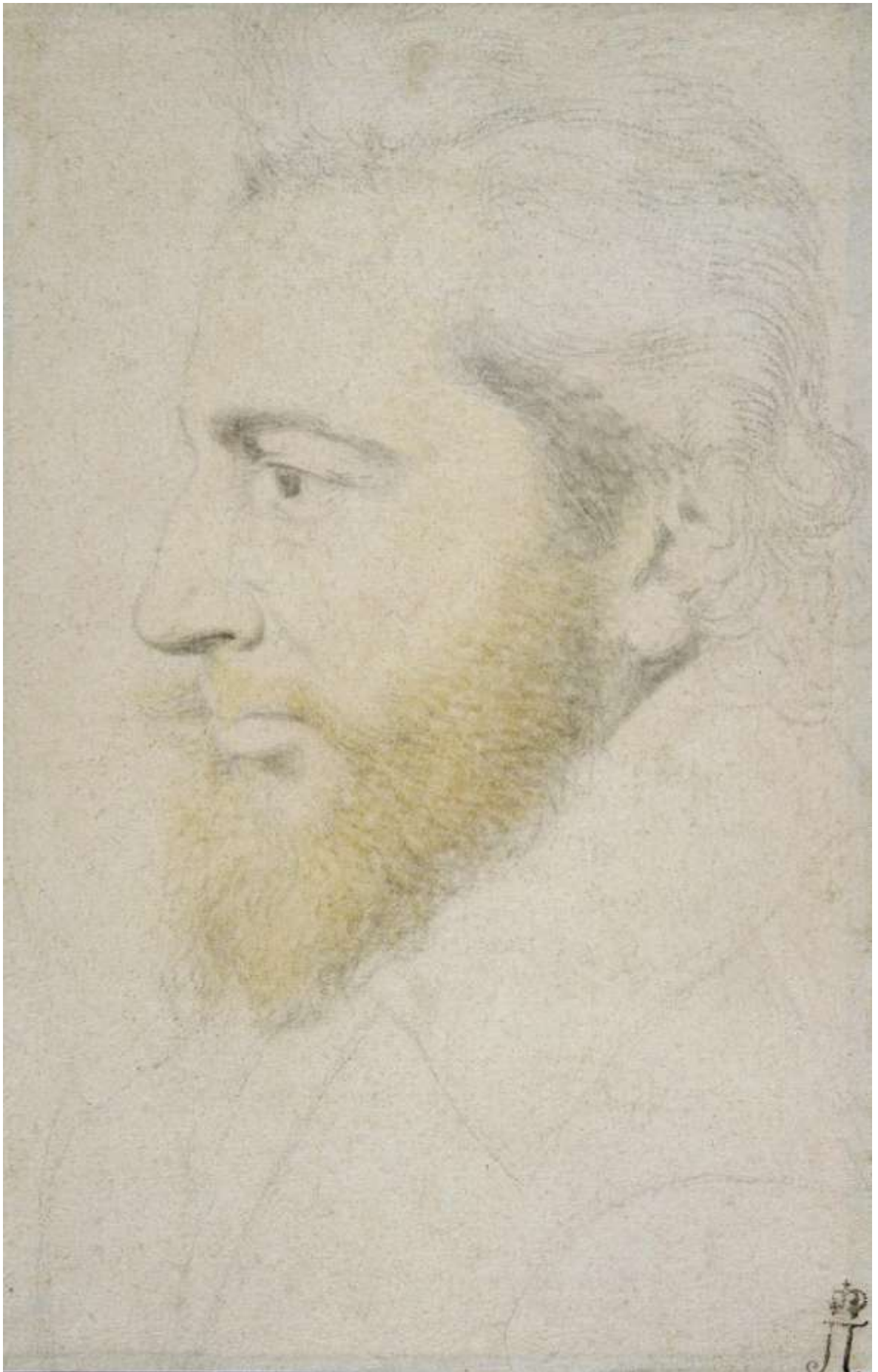
Илл. 218.8. Пьер Дюмустье Старший. Мужской портрет. Рисунок.