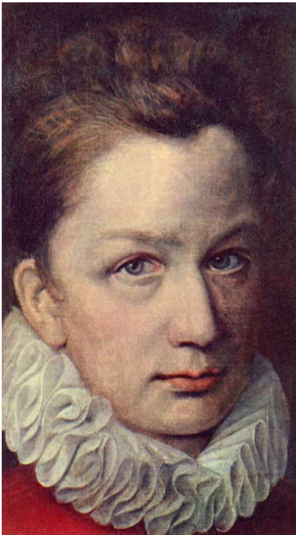
Илл. 218.12. Пьер Дюмустье Старший. Портрет юноши.