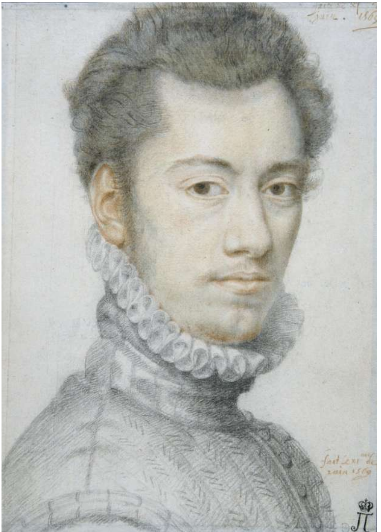
Илл. 218.2. Пьер Дюмустье Старший. Портрет Этьена Дюмустье. Рисунок.