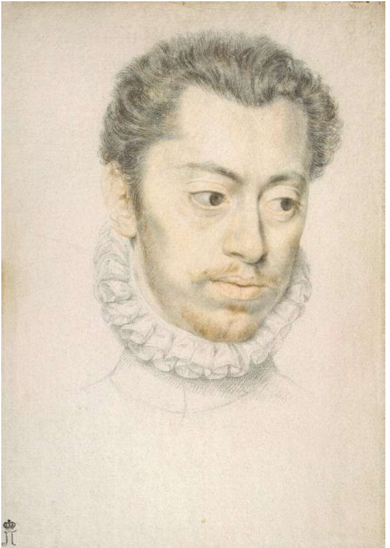
Илл. 218.1. Пьер Дюмустье Старший. Портрет Этьена Дюмустье. Рисунок.