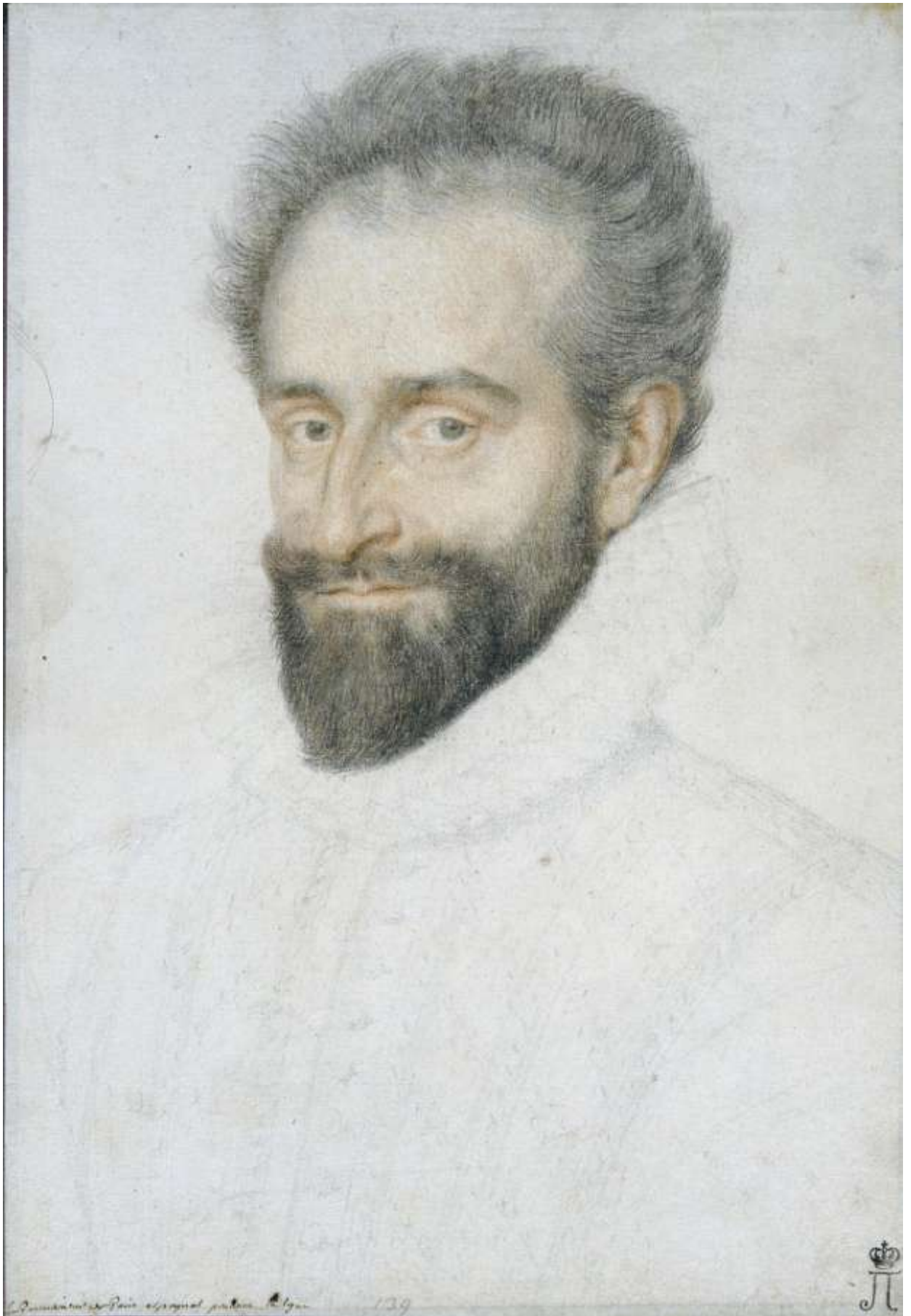
Илл. 218.6. Пьер Дюмустье Старший. Портрет начальника испанского гарнизона в Париже. Рисунок.