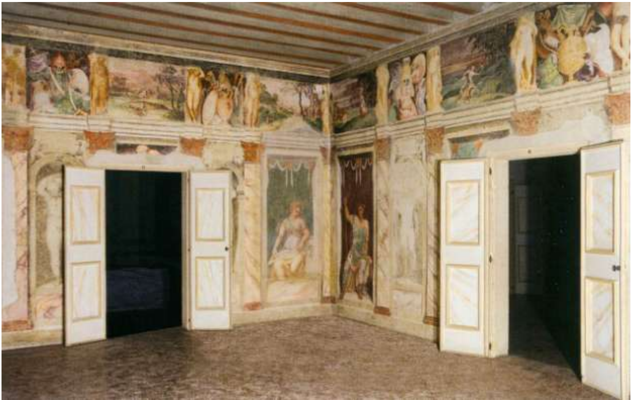
Илл. 195.8. Зал античных фигур на вилле в Лувильяно ди Торрелья близ Падуи.