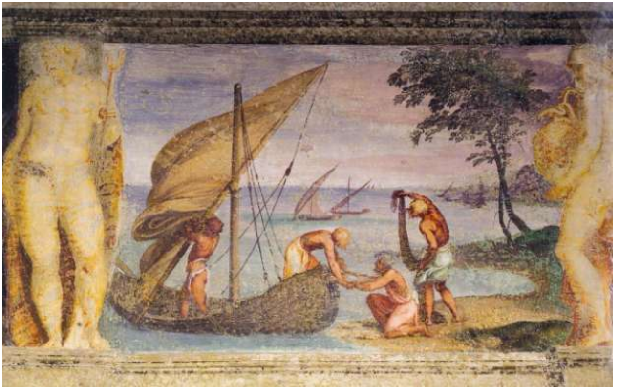
Илл. 195.5. Ламберт Сустрис. Возвращение рыбаков.