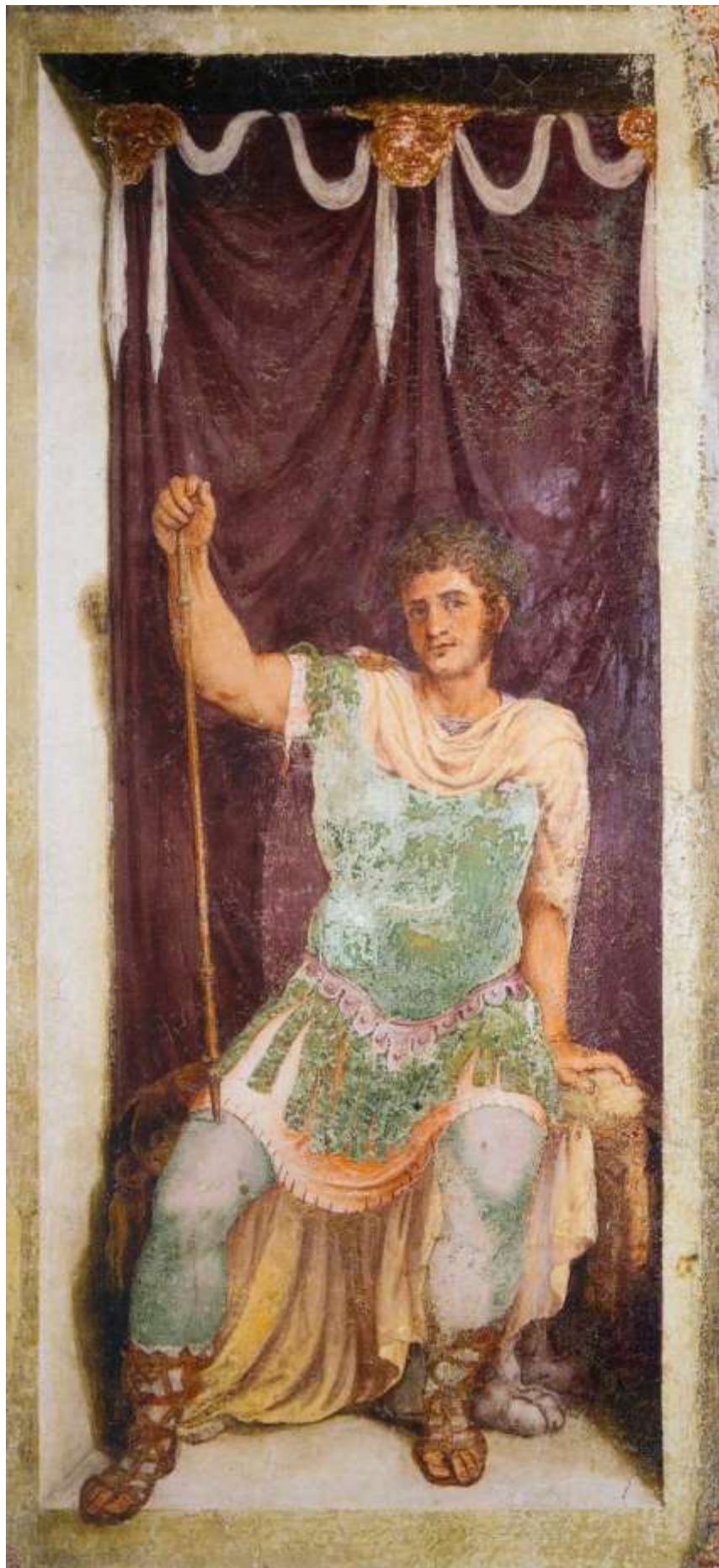
Илл. 195.1. Ламберт Сустрис. Римский император.