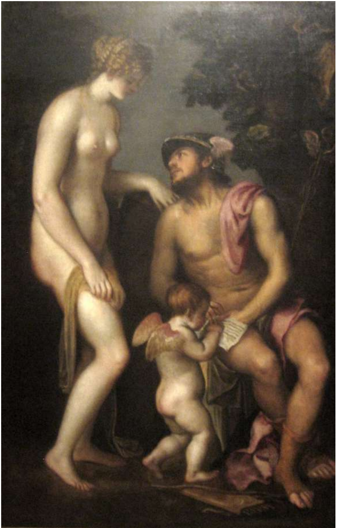
Илл. 195.17. Ламберт Сустрис. Воспитание Купидона.