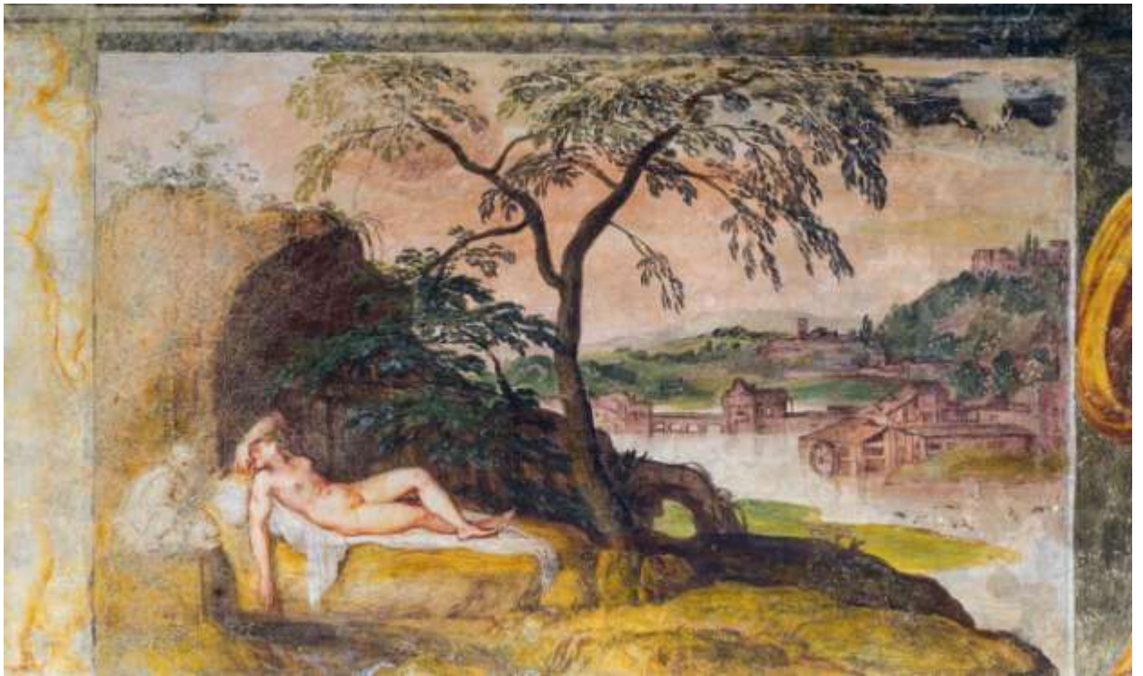
Илл. 195.4. Ламберт Сустрис. Обнаженные, спящие в пейзаже.