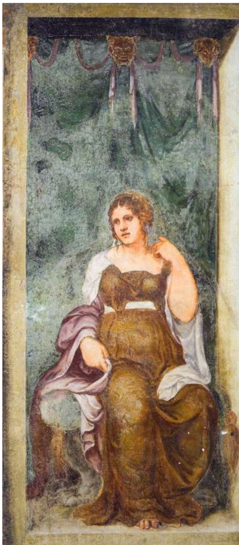
Илл. 195.2. Ламберт Сустрис. Римская патрицианка.