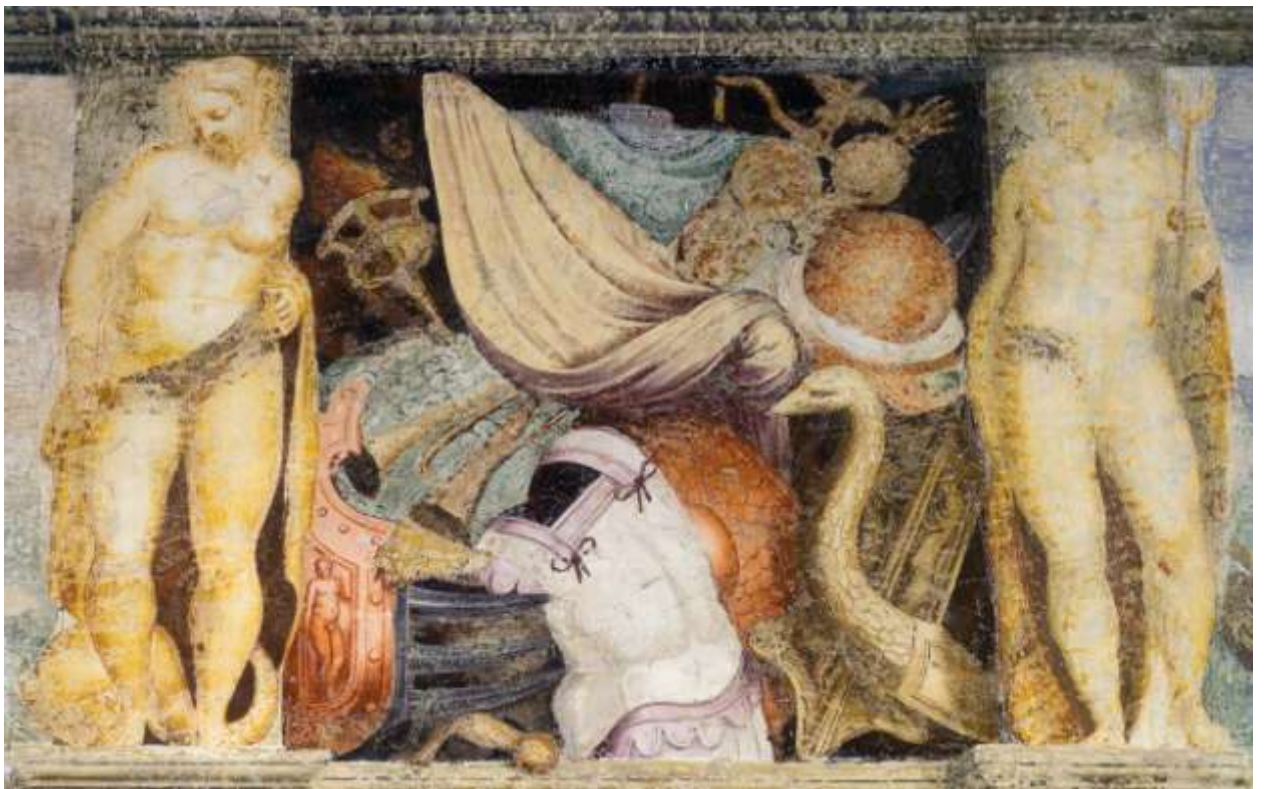
Илл. 195.7. Ламберт Сустрис. Трофеи войны: оружие.