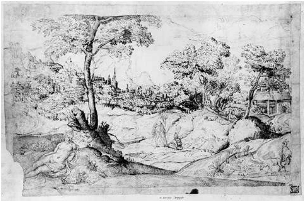
Илл. 195.9. Ламберт Сустрис. Пейзаж с городом и фигурами. Рисунок.