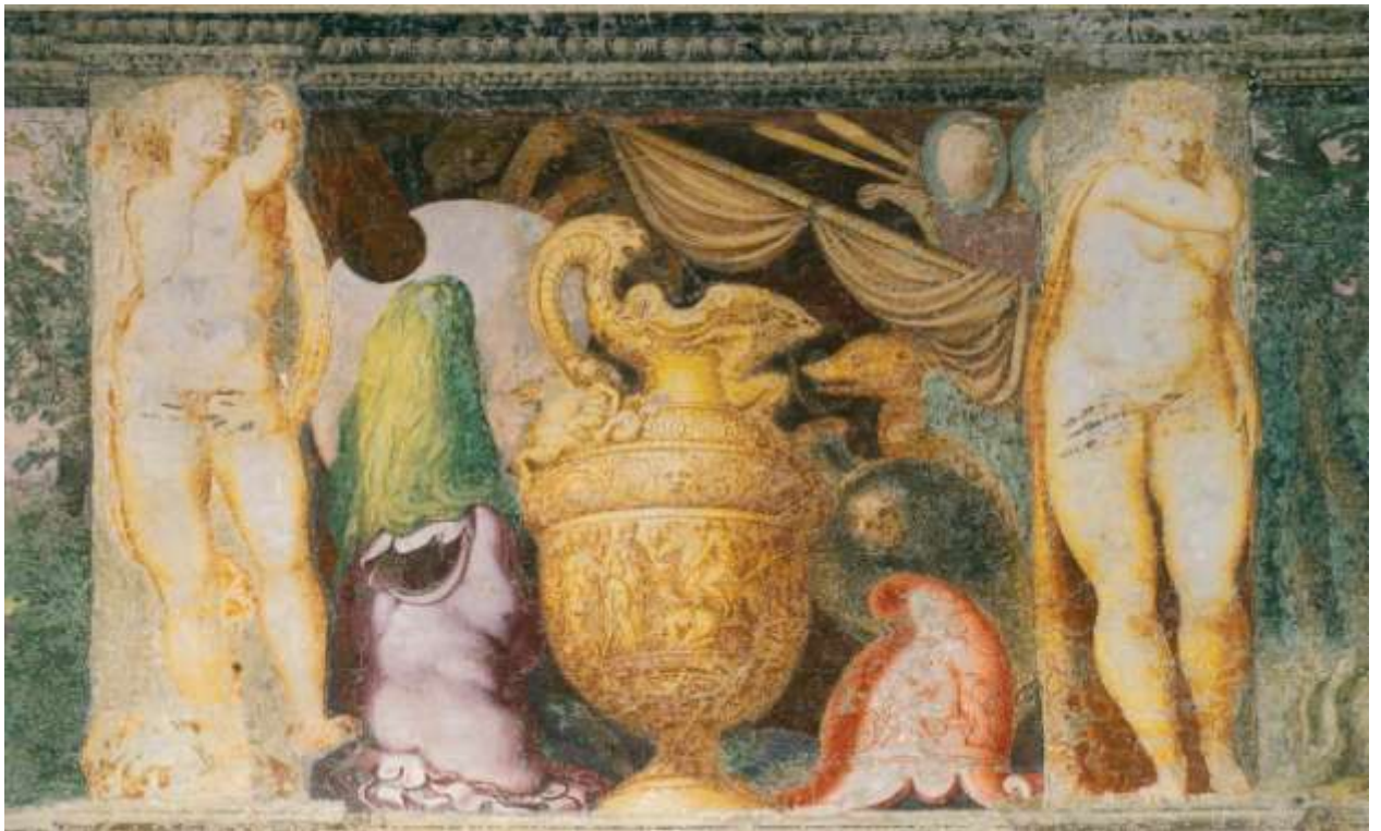
Илл. 195.6. Ламберт Сустрис. Трофеи войны: вазы.