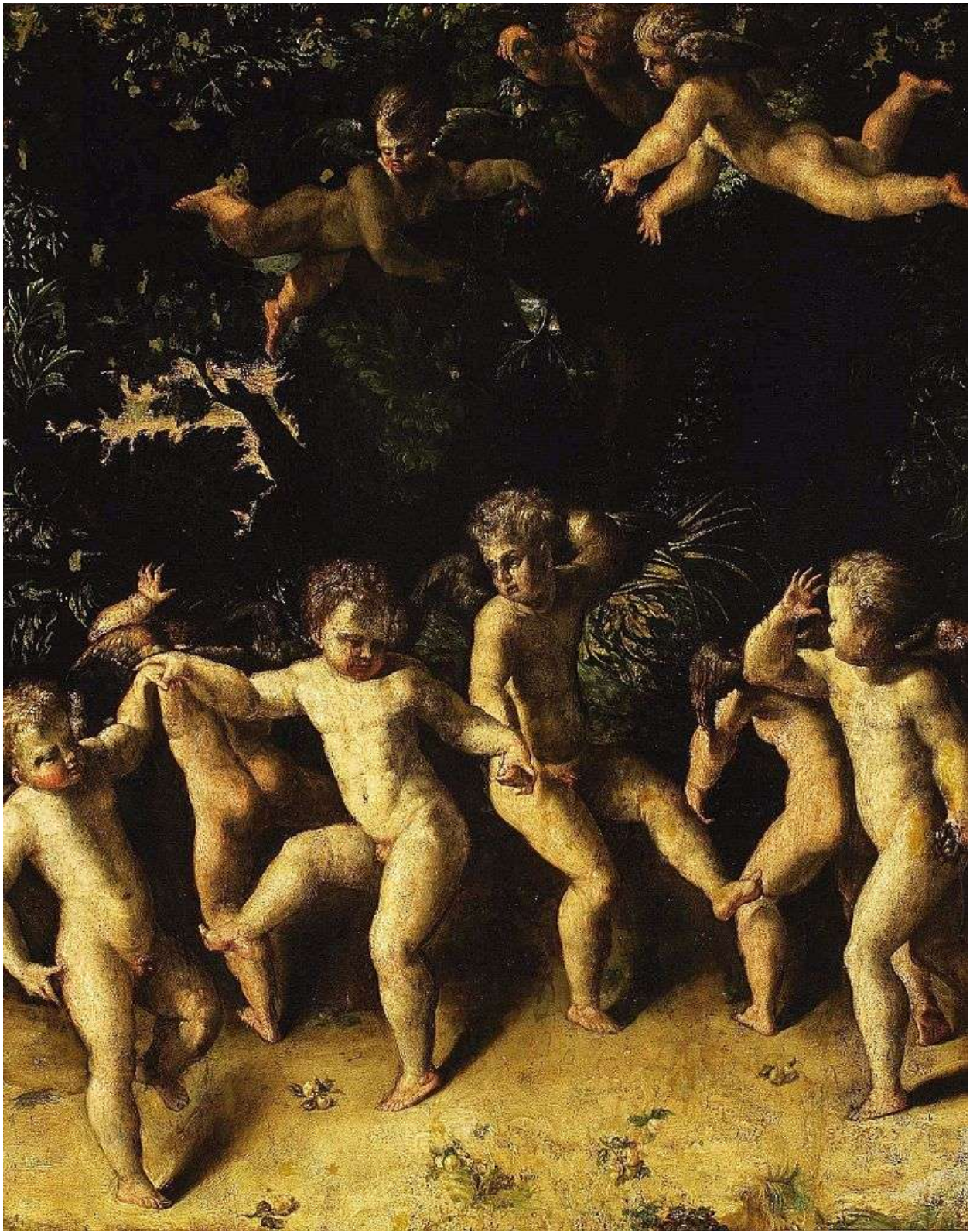
Илл. 195.11. Никколо дель Аббате. Танец Купидонов.