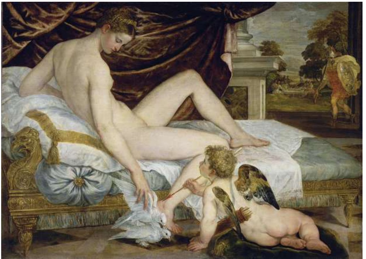
Илл. 195.10. Ламберт Сустрис. Венера и Купидон.