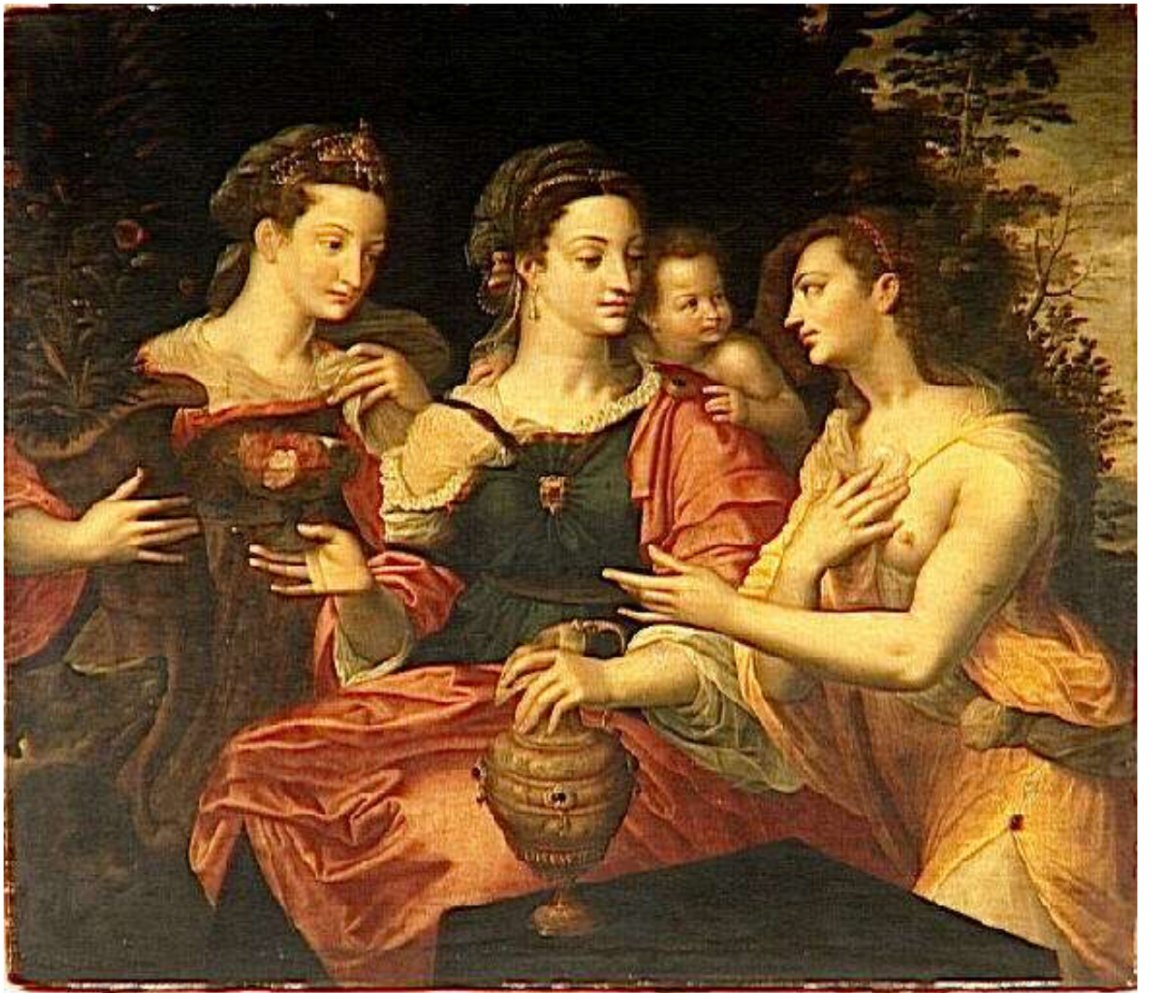
Илл. 195.13. Ян Массейс. Венера и Психея.