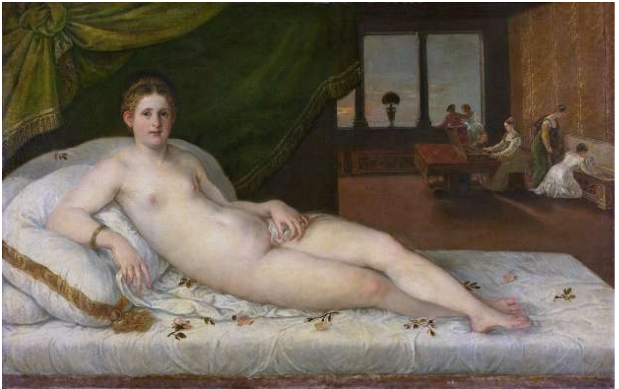
Илл. 195.15. Ламберт Сустрис. Лежащая Венера.