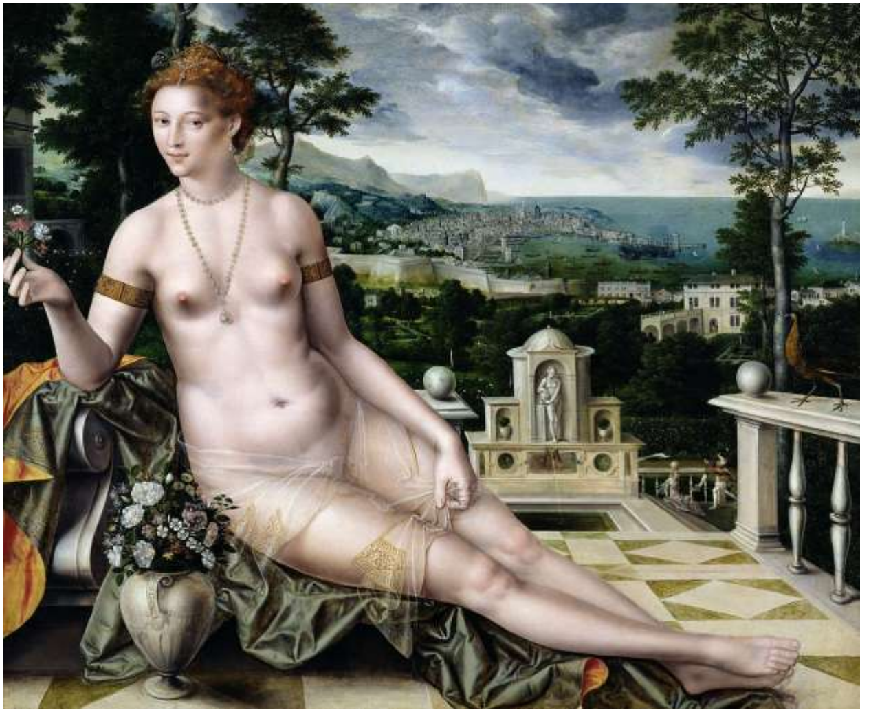
Илл. 195.12. Ян Массейс. Венера.