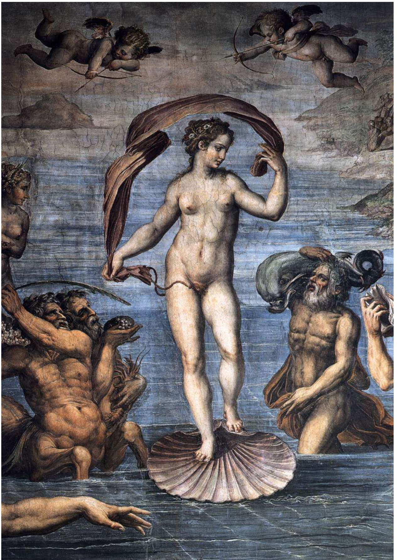
Илл. 195.14. Джорджо Вазари. Рождение Венеры.