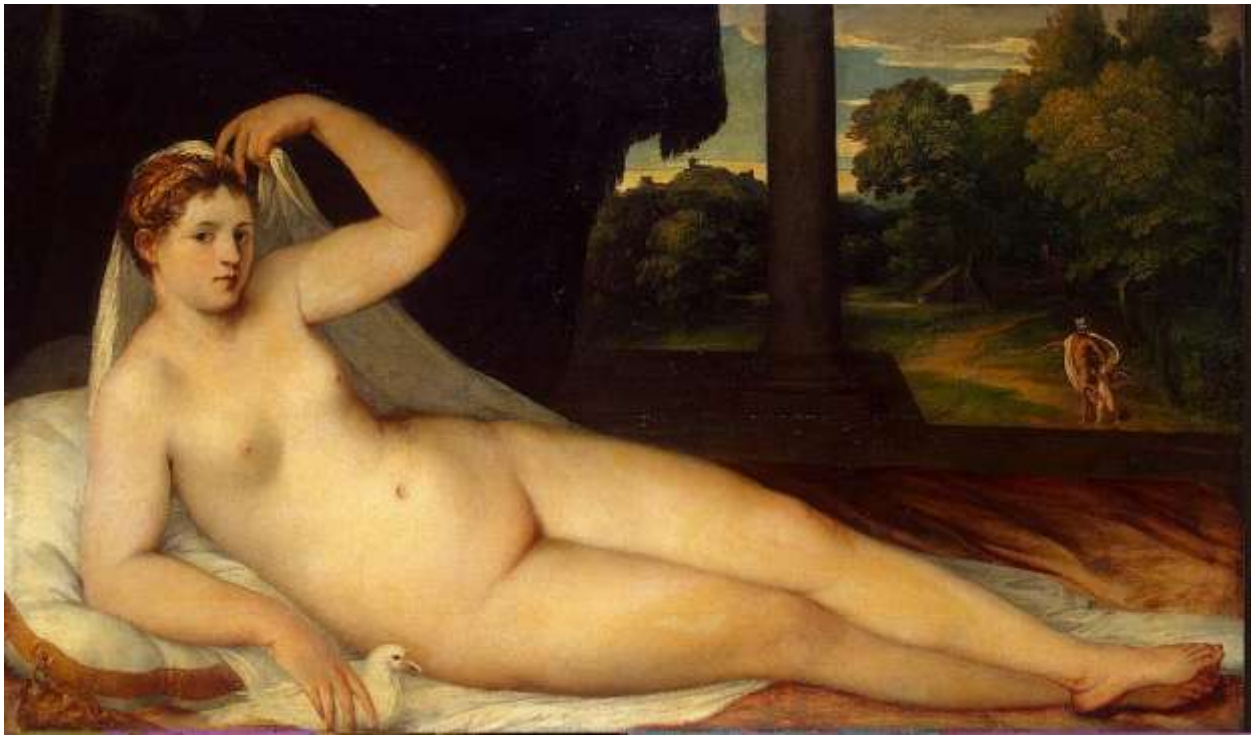
Илл. 195.16. Ламберт Сустрис. Венера.