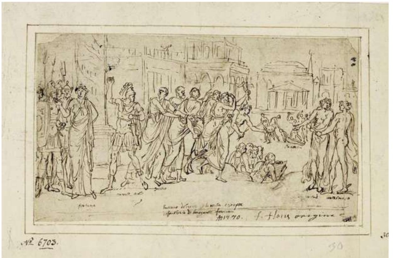
Илл. 187.6. Ламберт Ломбард. Сцена из римской истории. Рисунок.