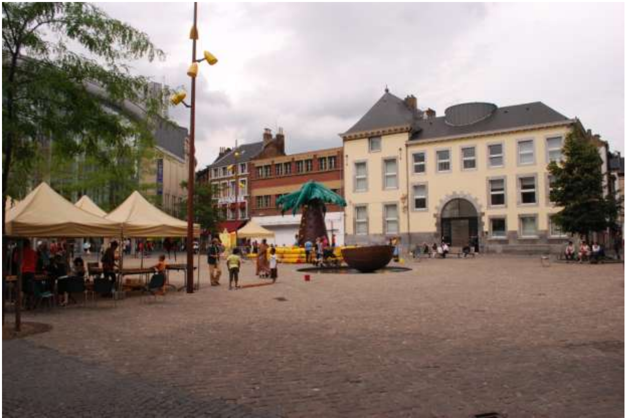
Илл. 187.3. Площадь Сент-Этьенн в Льеже.