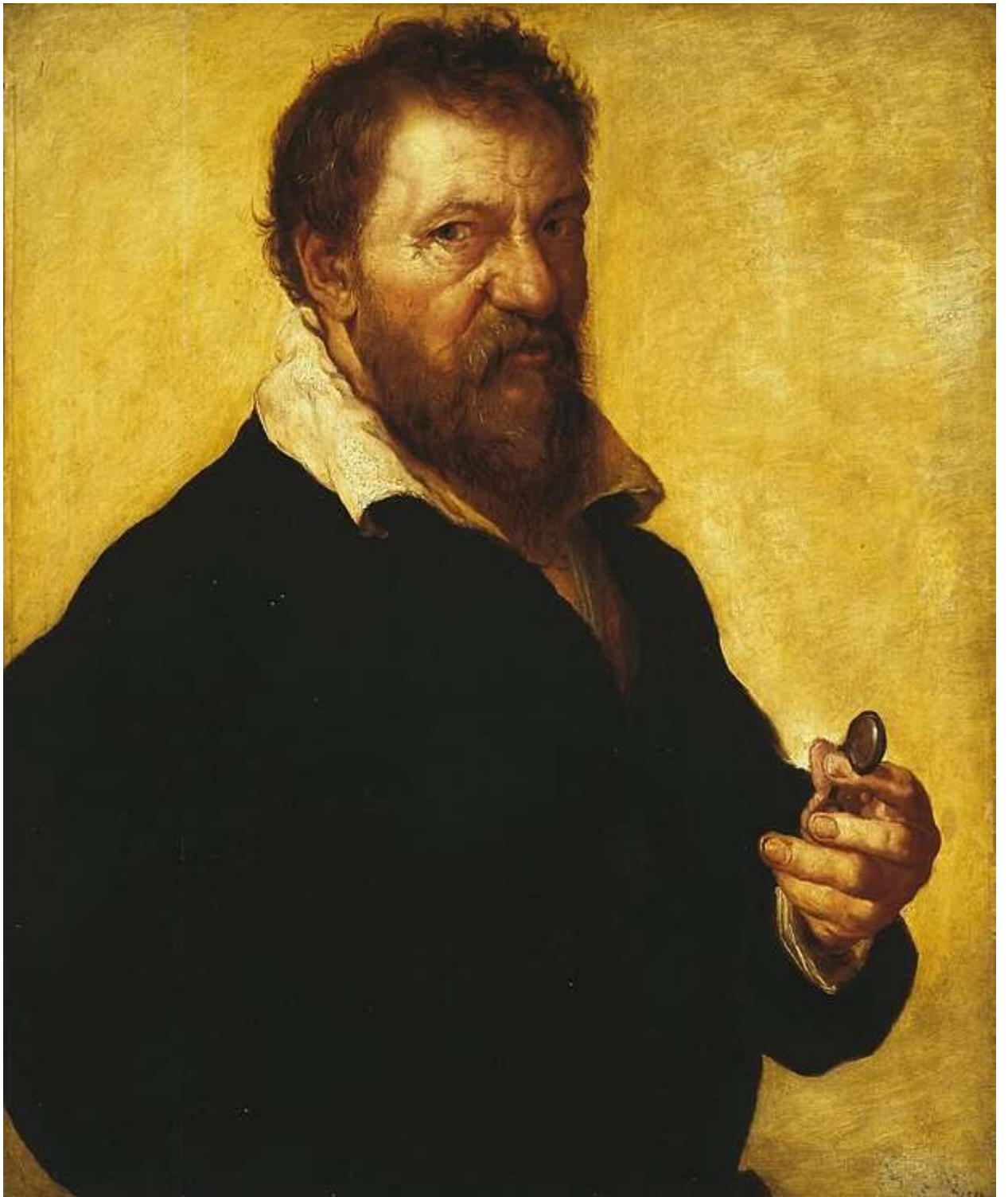
Илл. 187.10. Ламберт Ломбард. Автопортрет.