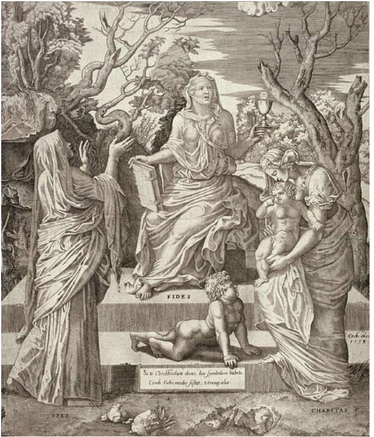
Илл. 187.9. Ламберт Ломбард. Вера, Надежда и Любовь. Гравюра.