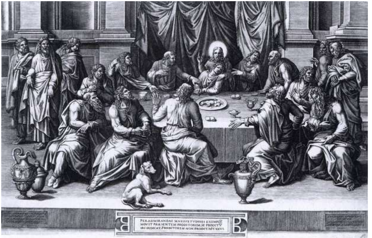
Илл. 187.7. Ламберт Ломбард. Тайная вечеря. Гравюра.