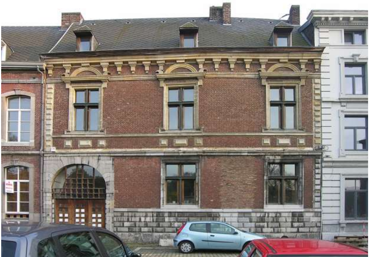
Илл. 187.2. Ламберт Ломбард. Отель Торрентиус в Льеже.