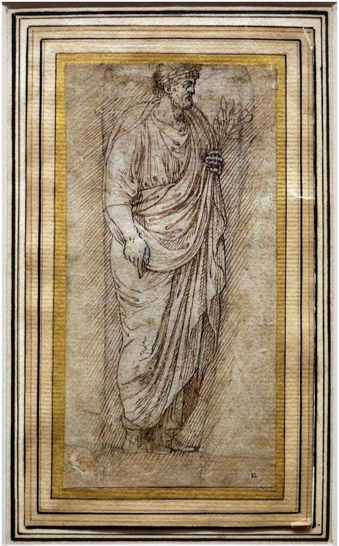
Илл. 187.4. Ламберт Ломбард. Штудия фигуры. Рисунок.