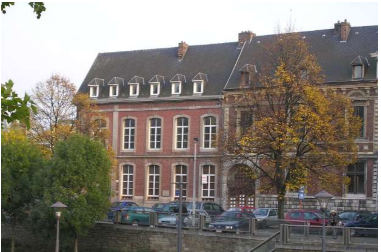
Илл. 187.1. Ламберт Ломбард. Дом в Льеже, где родился композитор Цезарь Франк.