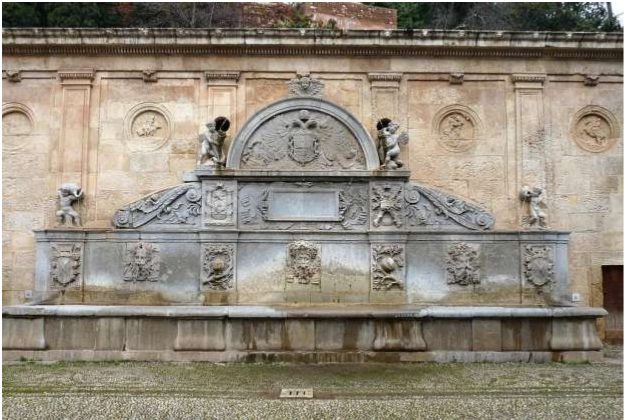
Илл. 179.2. Педро Мачука. Фонтан Карла V в Альгамбре.