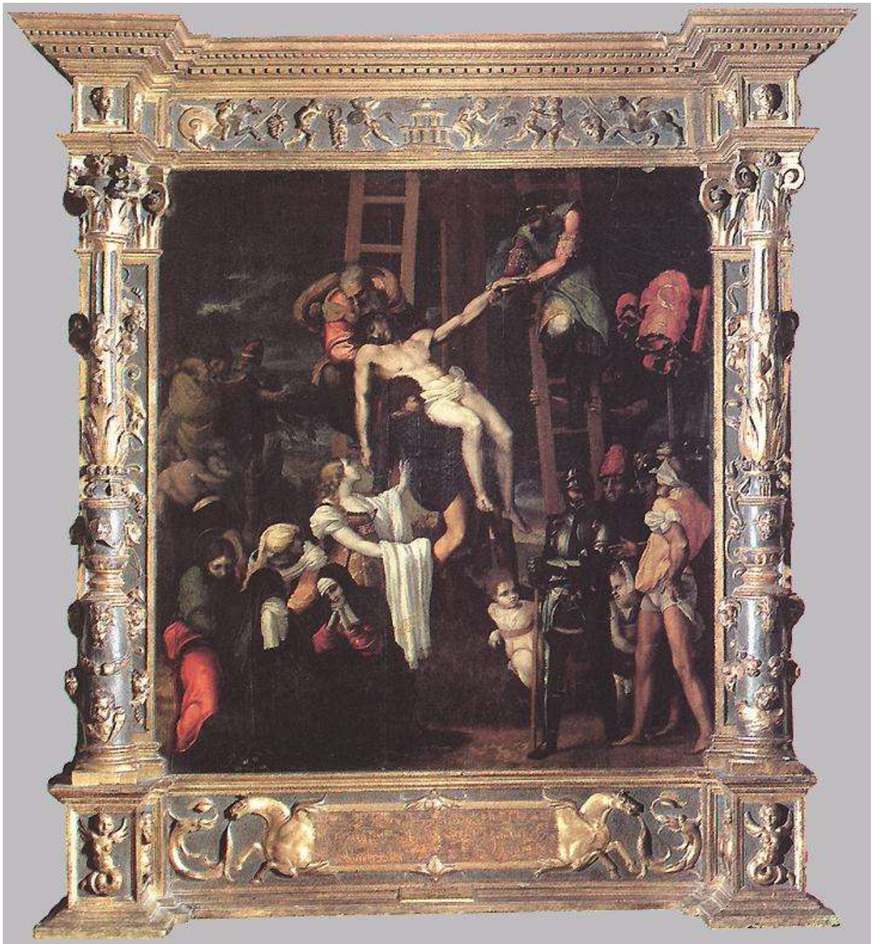
Илл. 179.6. Педро Мачука. Снятие с креста в оригинальной раме.