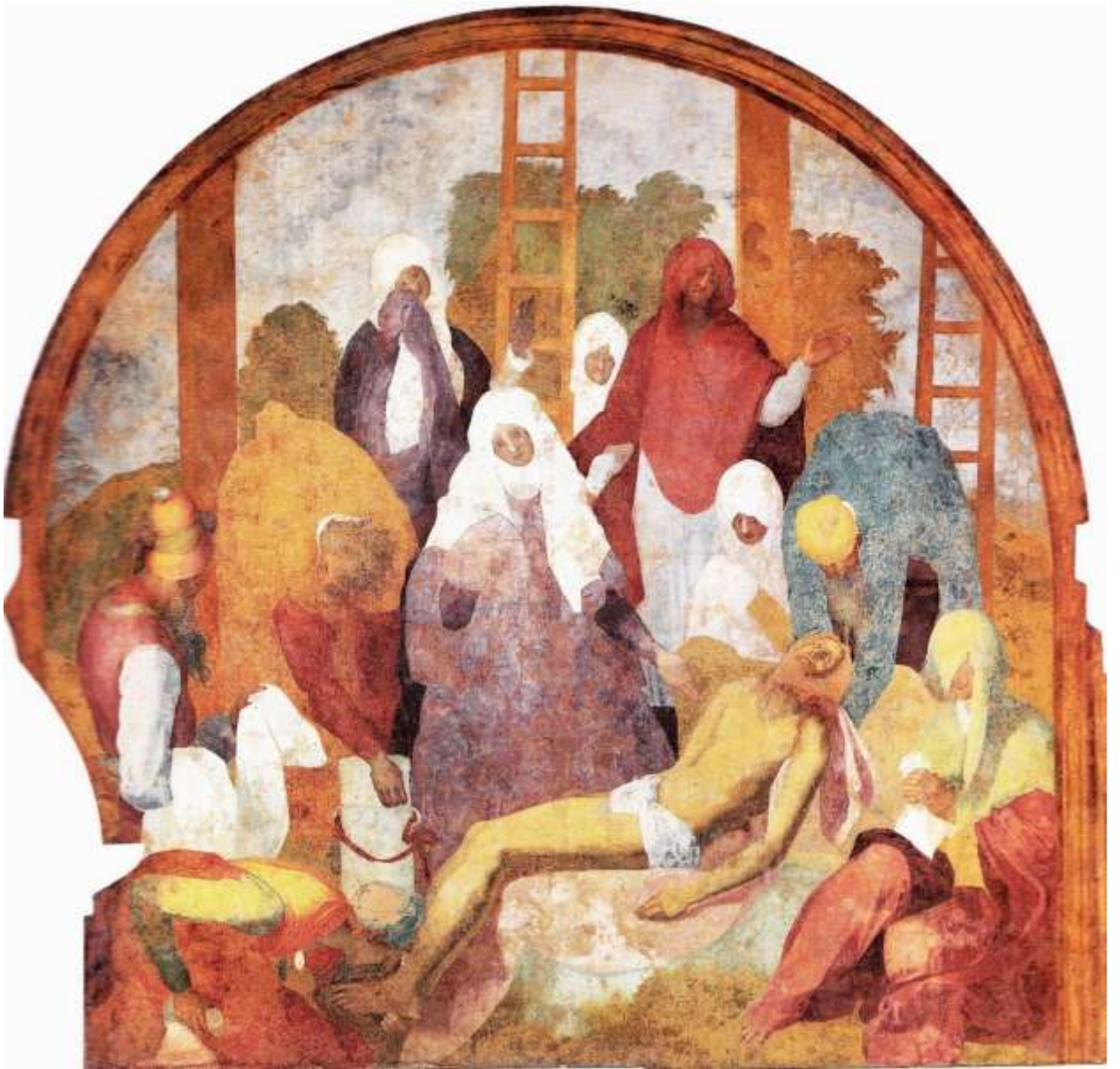
Илл. 179.7. Понтормо. Снятие с креста.