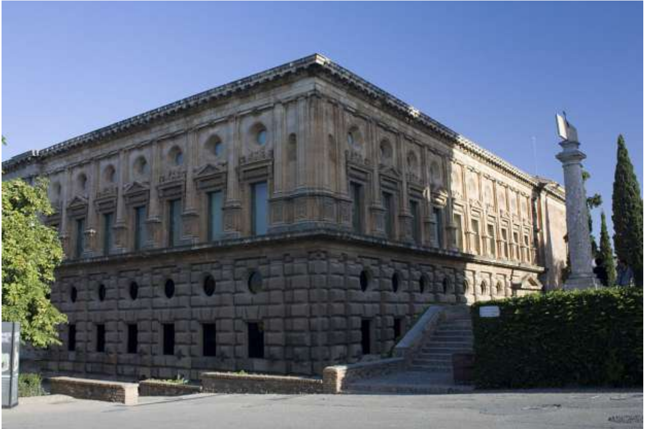
Илл. 179.1. Педро Мачука. Дворец Карла V в Альгамбре.