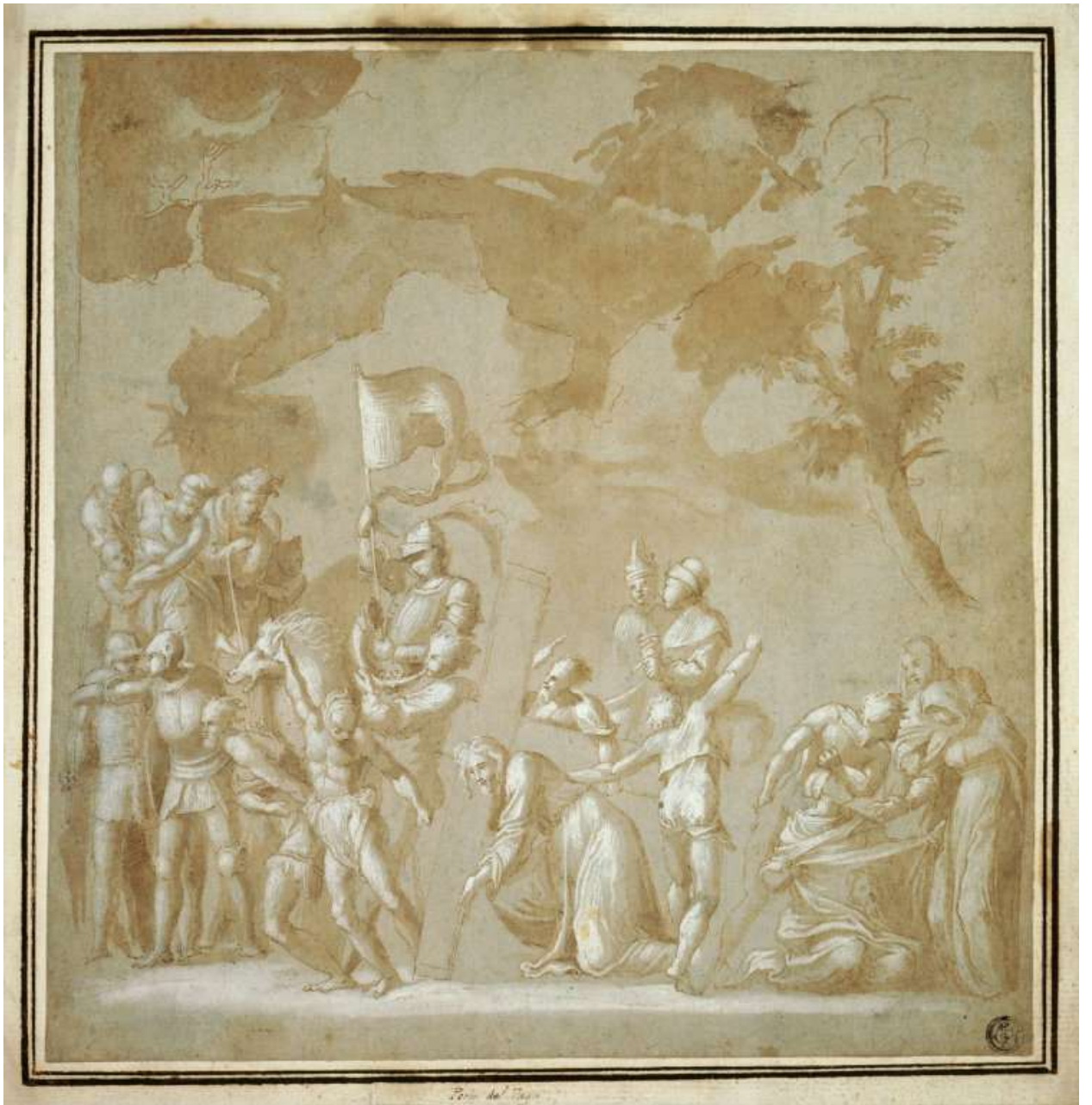
Илл. 179.4. Педро Мачука. Голгофа. Рисунок.