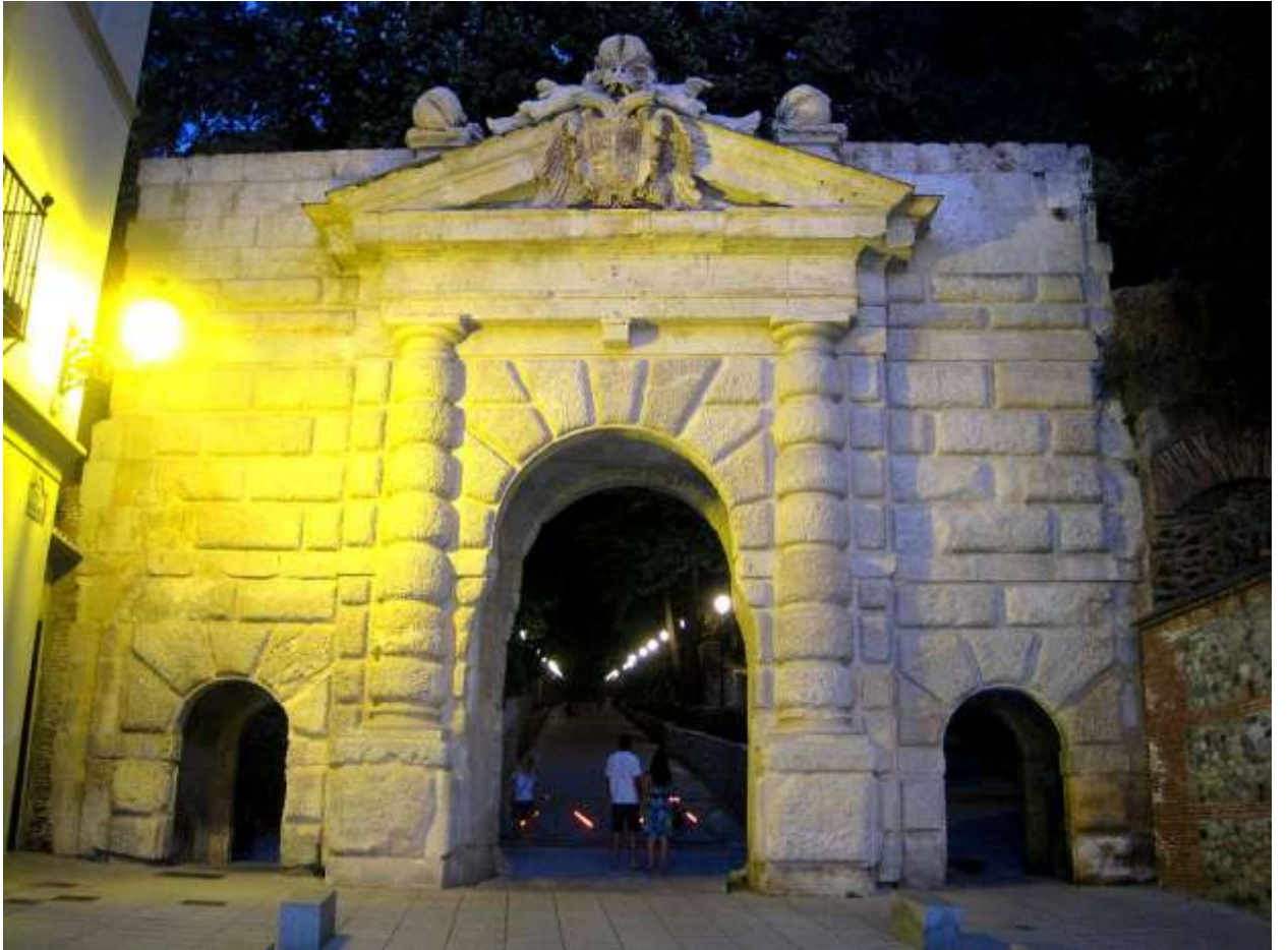
Илл. 179.3. Педро Мачука. Ворота Гранады в Альгамбре.