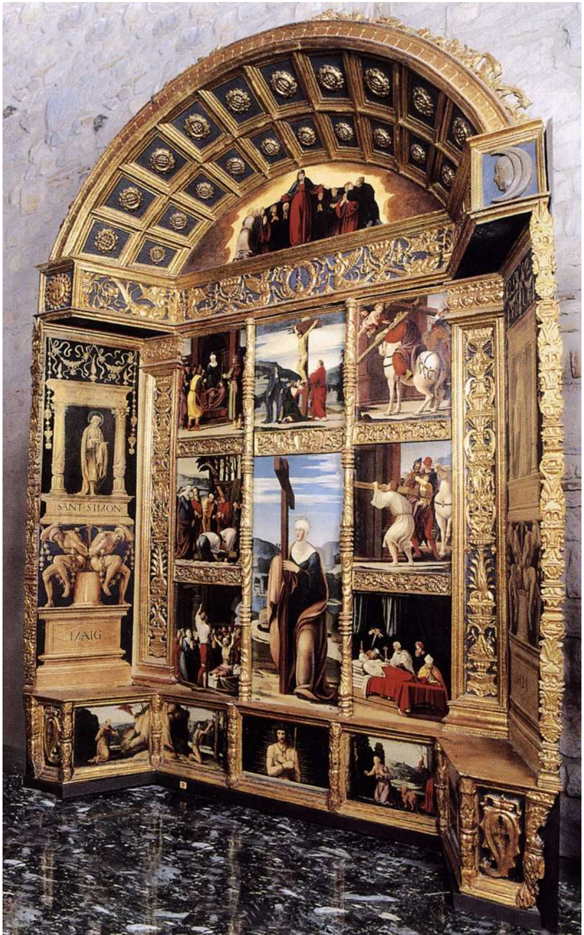
Илл. 177.1. Педро Фернандес. Ретабло св. Елены.