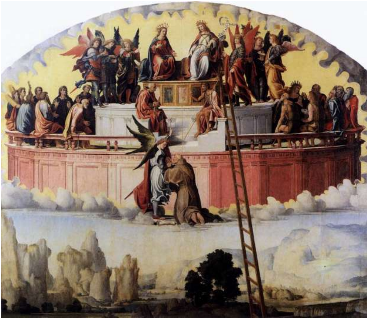
Илл. 177.3. Педро Фернандес. Видение блаженного Амедео Менеса де Сильвы.