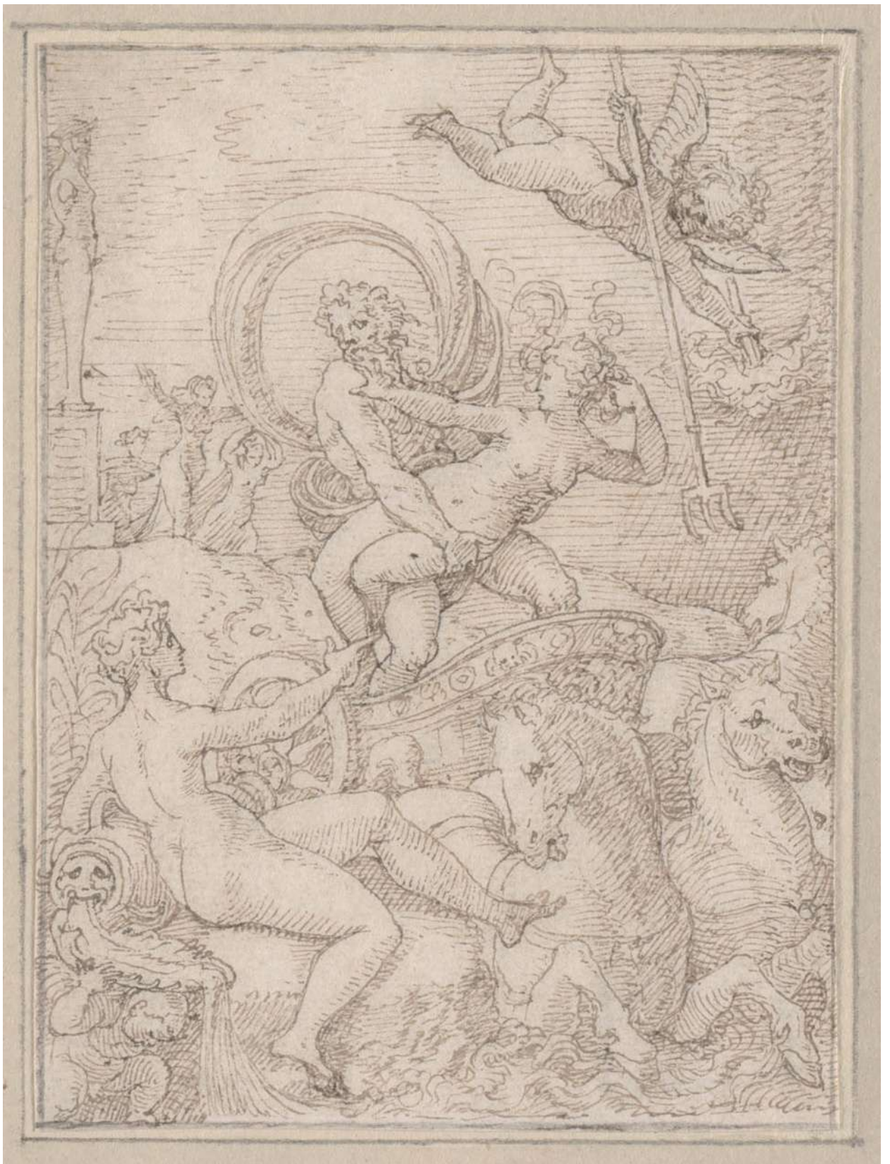
Илл. 165.5. Жан Кузен Старший. Нептун похищает нимфу. Рисунок.