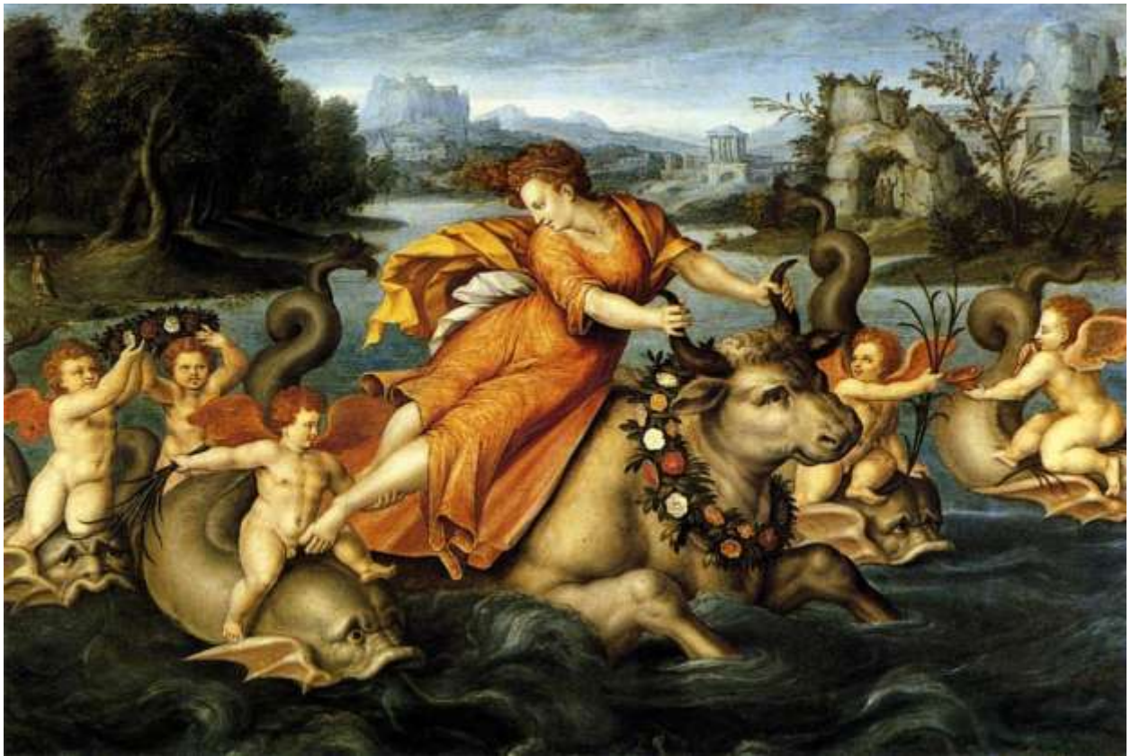
Илл. 165.8. Жан Кузен Старший. Похищение Европы.