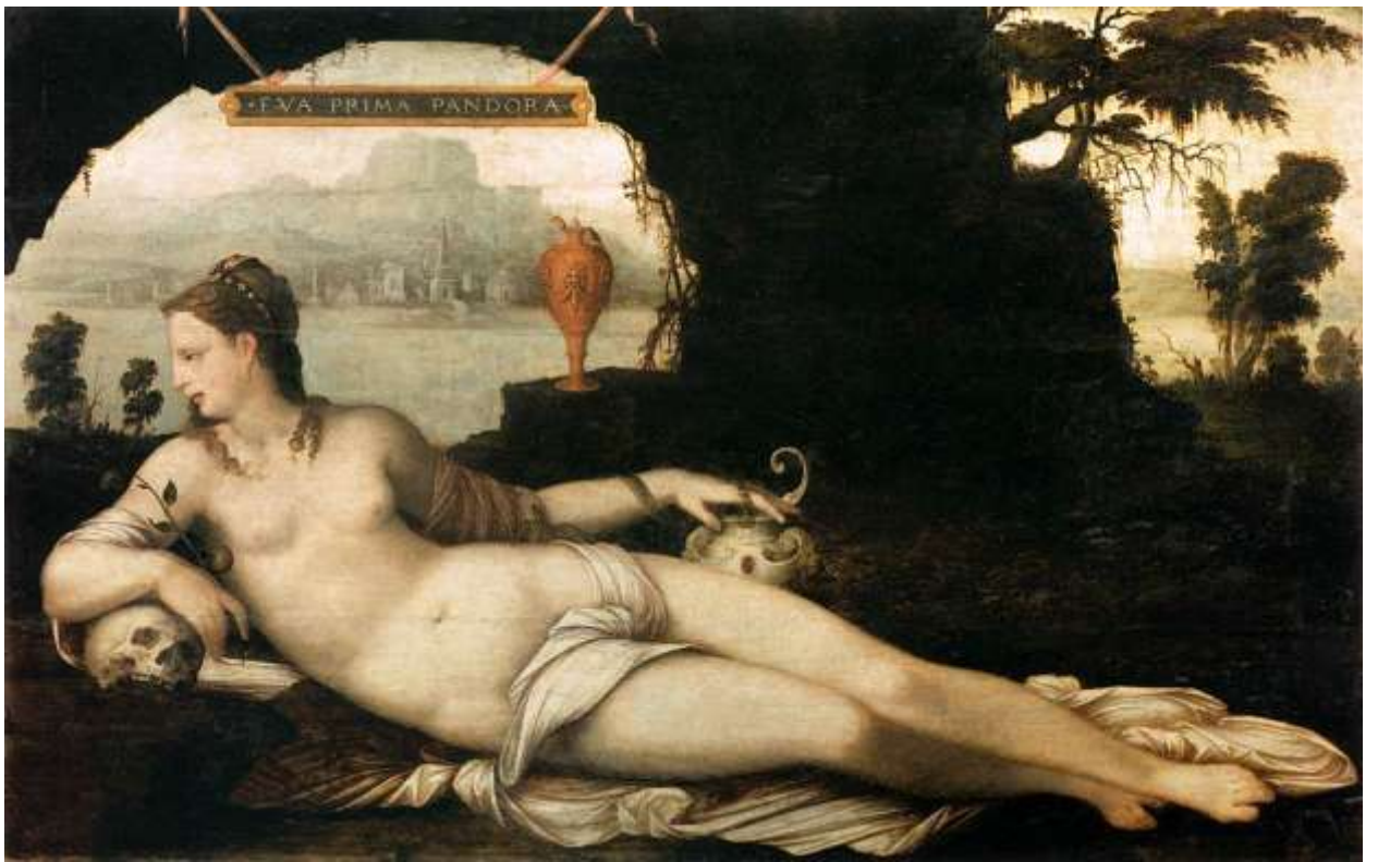
Илл. 165.7. Жан Кузен Старший. Ева, первая Пандора.