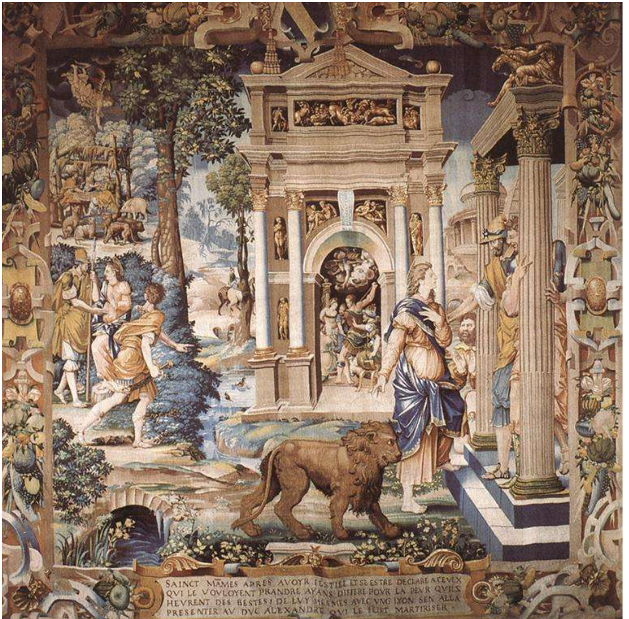
Илл. 165.2. Жан Кузен Старший. Св. Маммий и герцог Александр. Шпалера.