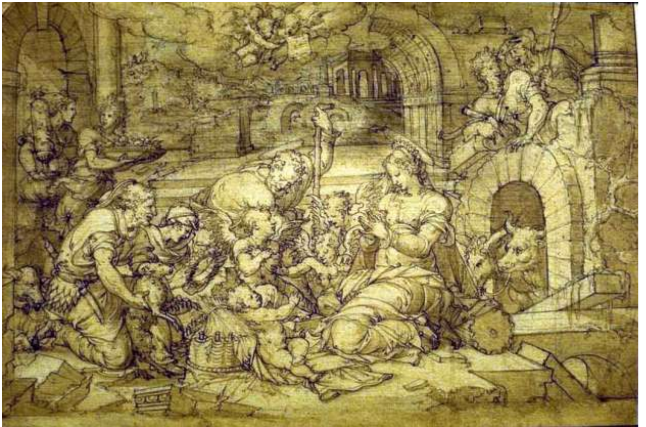
Илл. 165.4. Жан Кузен Старший. Поклонение пастухов. Рисунок.