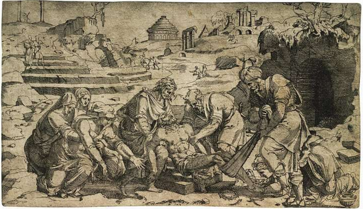
Илл. 165.3. Жан Кузен Старший. Положение во гроб. Гравюра.