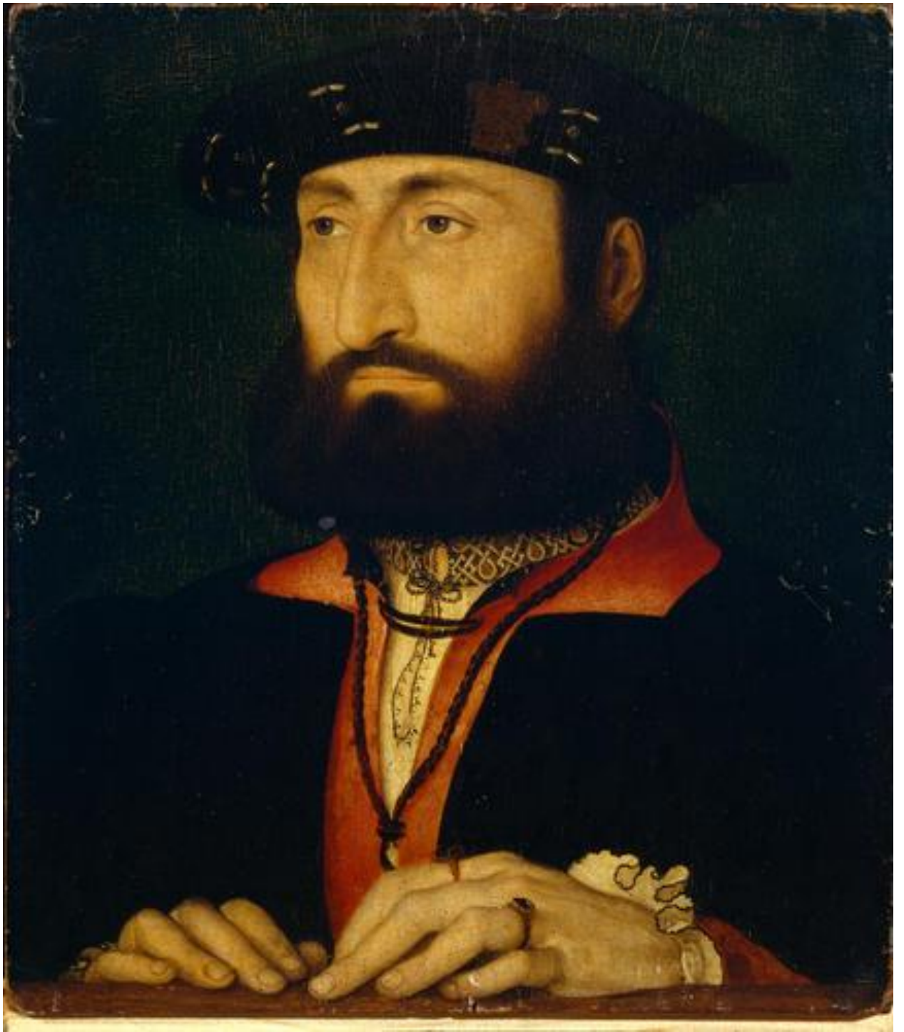
Илл. 164.23. Жан Клуэ. Портрет Людовика Клевского, графа Неверского.