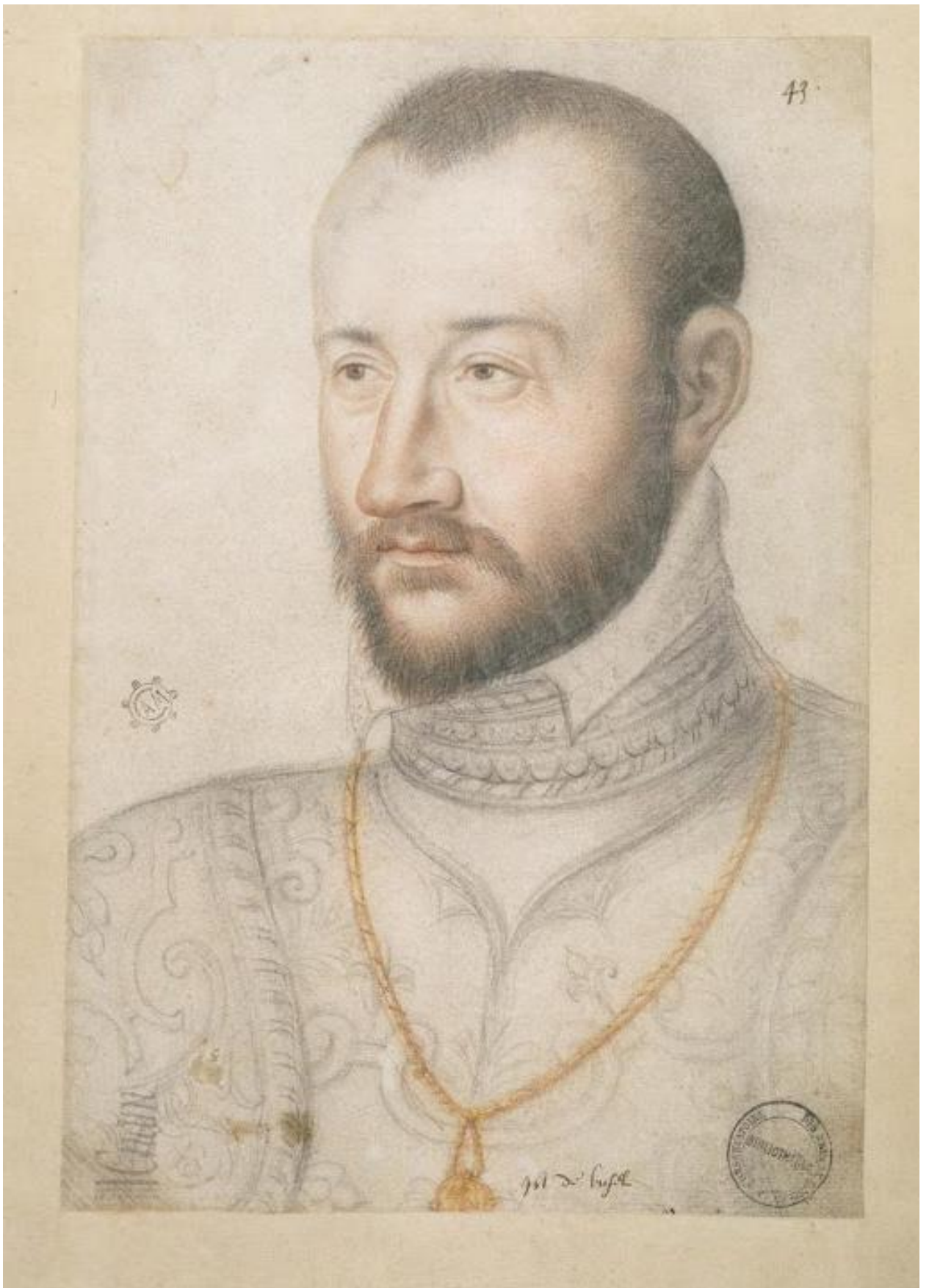
Илл. 164.7. Жан Клуэ. Клод де Бурбон-Бюссе. Рисунок.