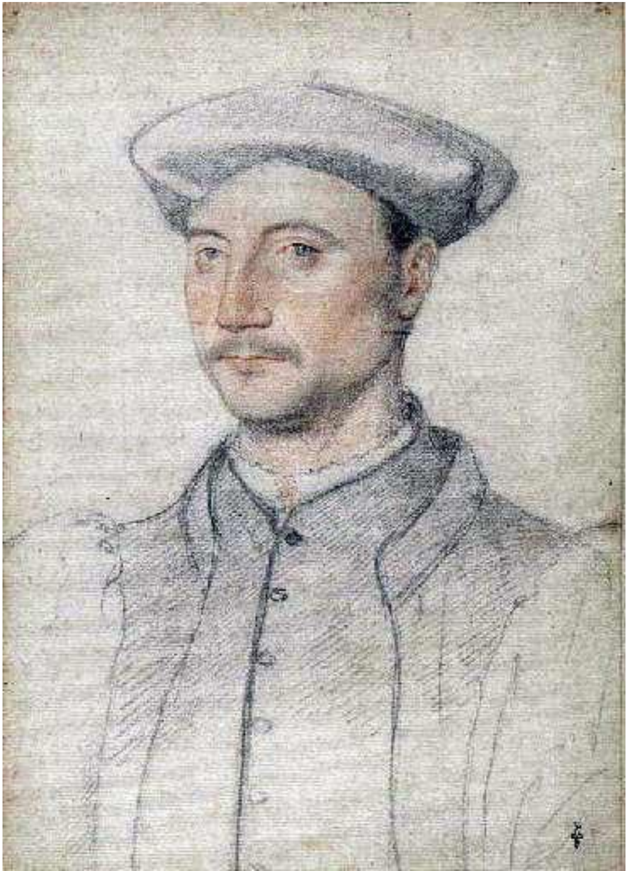
Илл. 164.3. Жан Клуэ. Филипп де Монморанси. Рисунок.