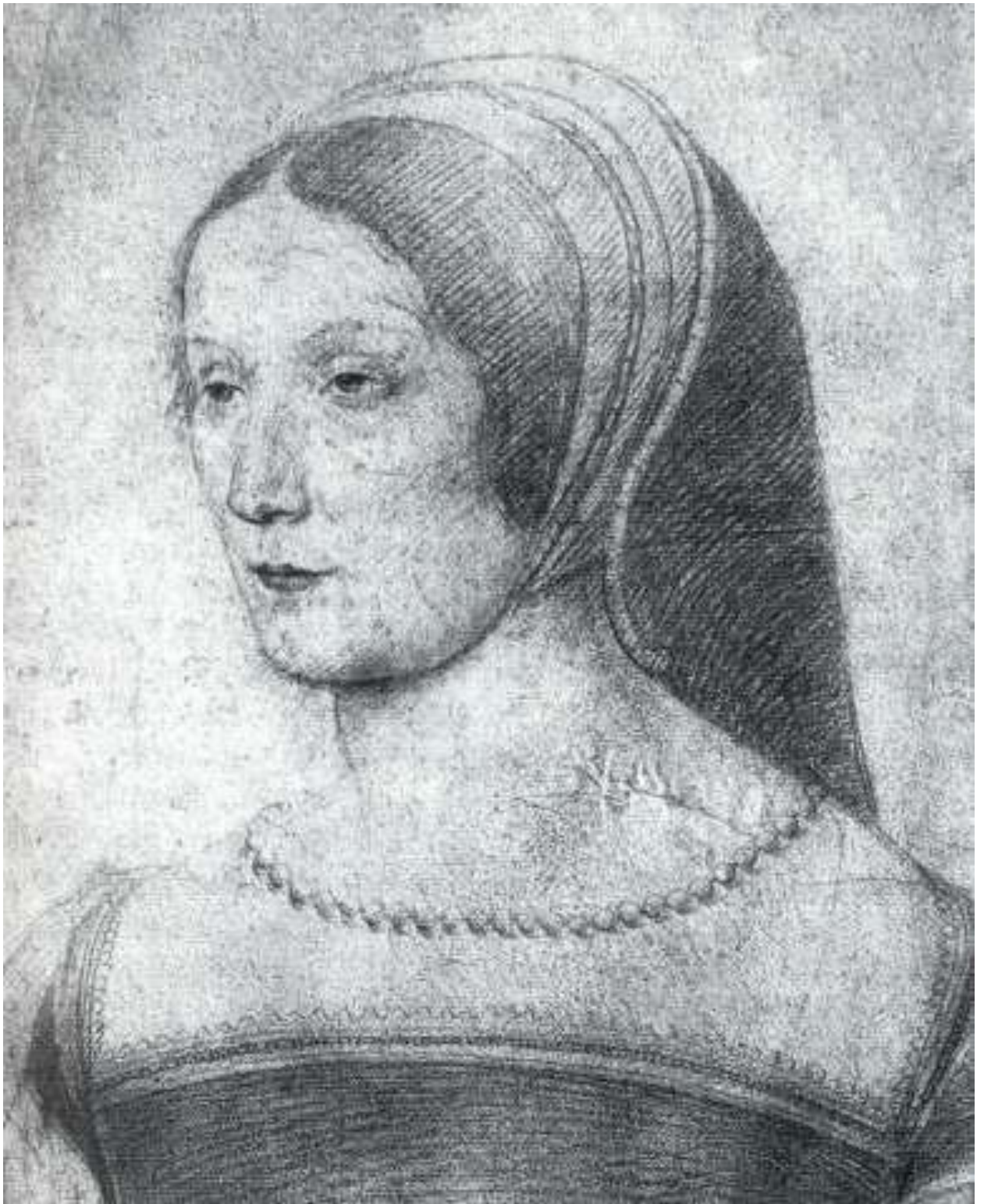
Илл. 164.12. Жан Клуэ. Франсуаза де Фуа. Рисунок.