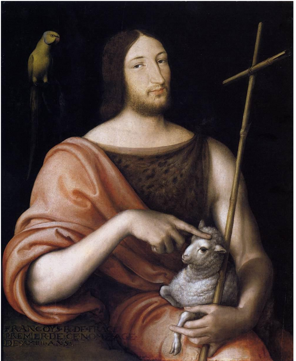
Илл. 164.17. Жан Клуэ. Портрет Франциска I в образе Иоанна Крестителя.