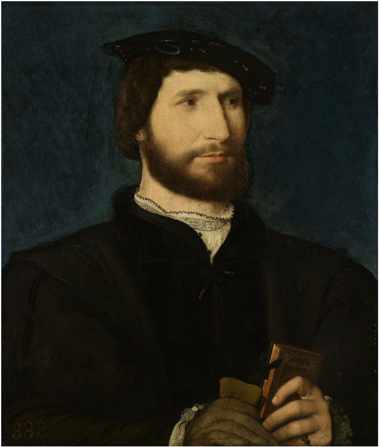
Илл. 164.27. Жан Клуэ. Мужской портрет с томиком Петрарки.