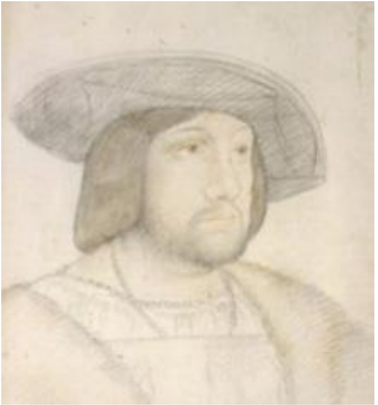
Илл. 164.6. Жан Клуэ. Тома де Фуа-Лескун. Рисунок.