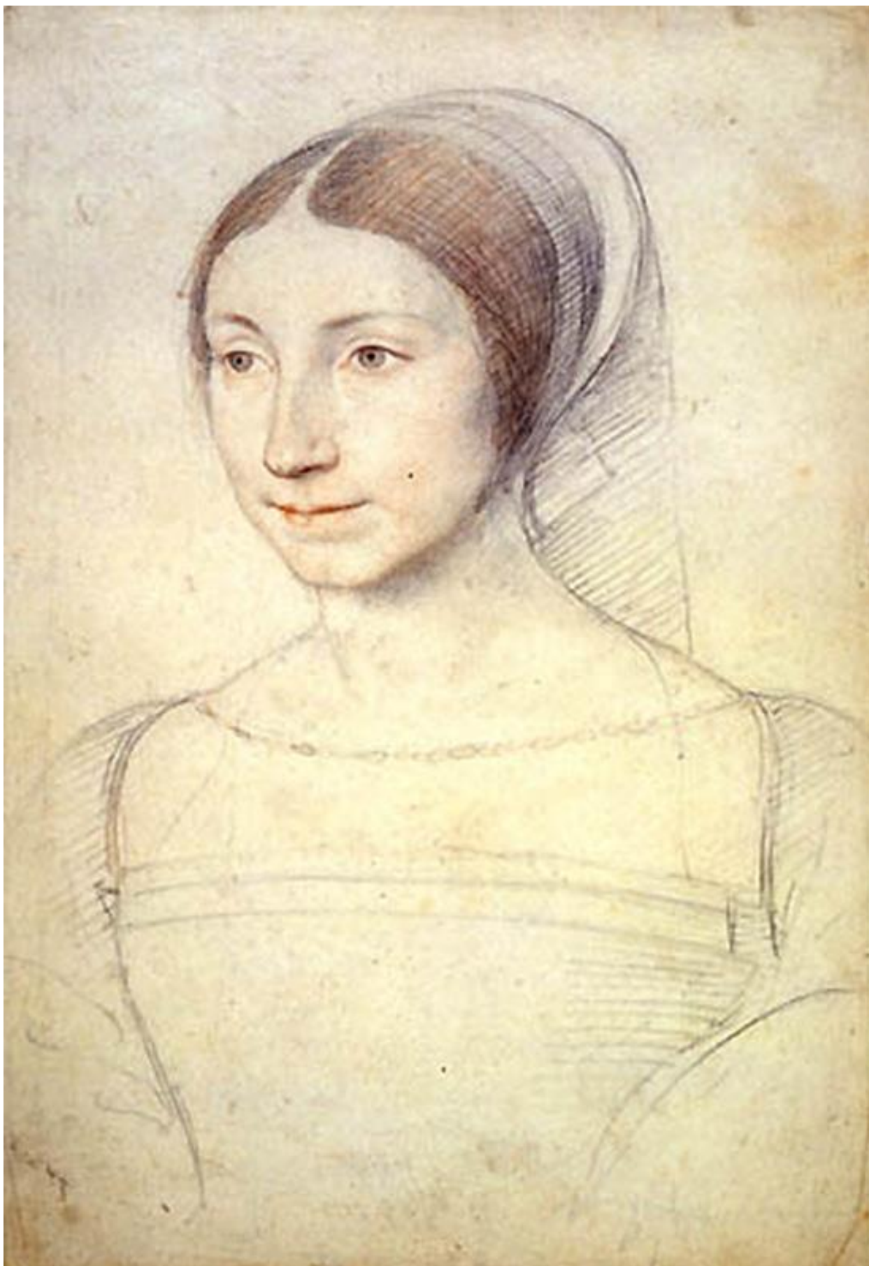
Илл. 164.15. Жан Клуэ. Портрет девушки. Рисунок.