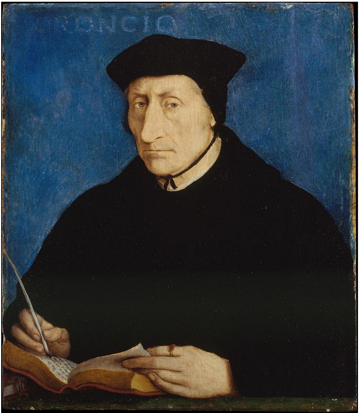
Илл. 164.25. Жан Клуэ. Портрет Гийома Бюде.