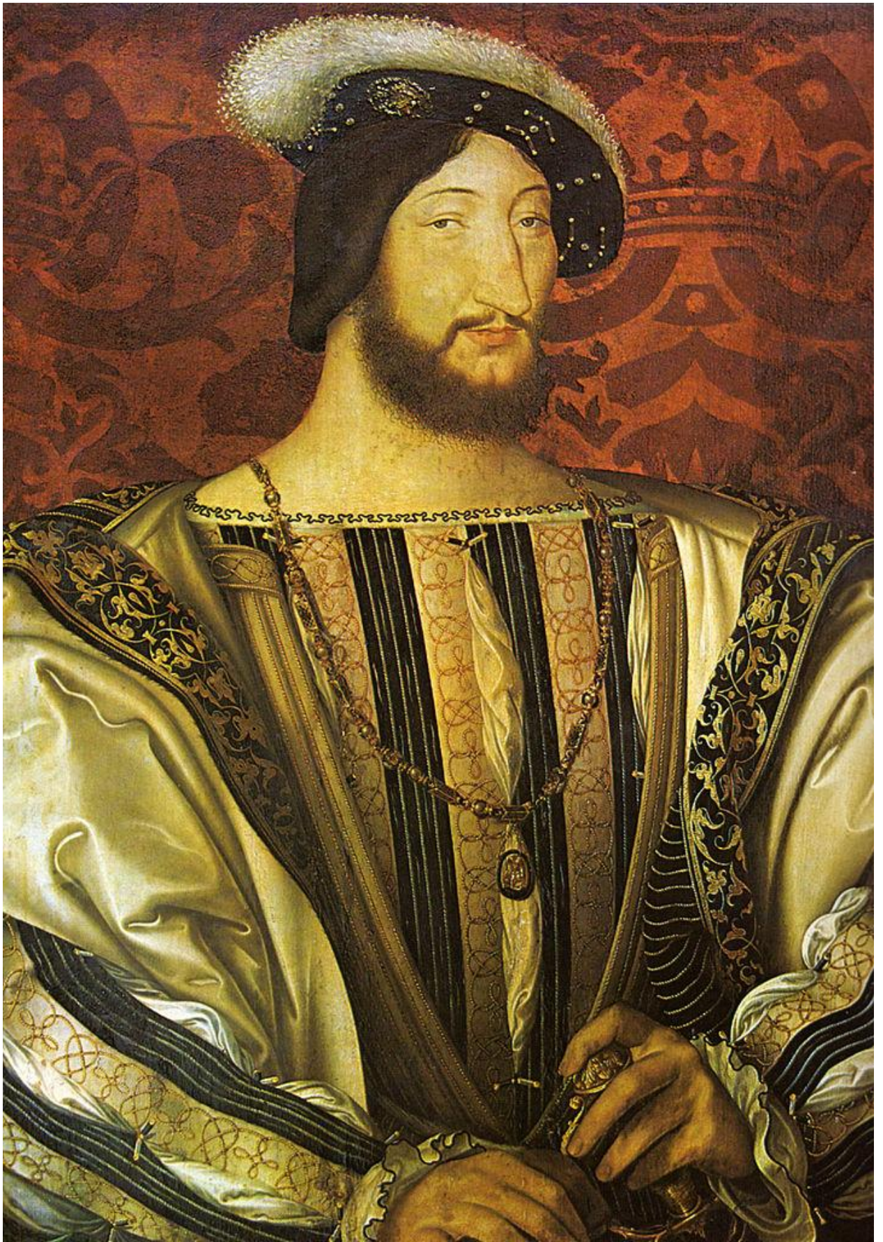
Илл. 164.18. Жан Клуэ. Портрет Франциска I.