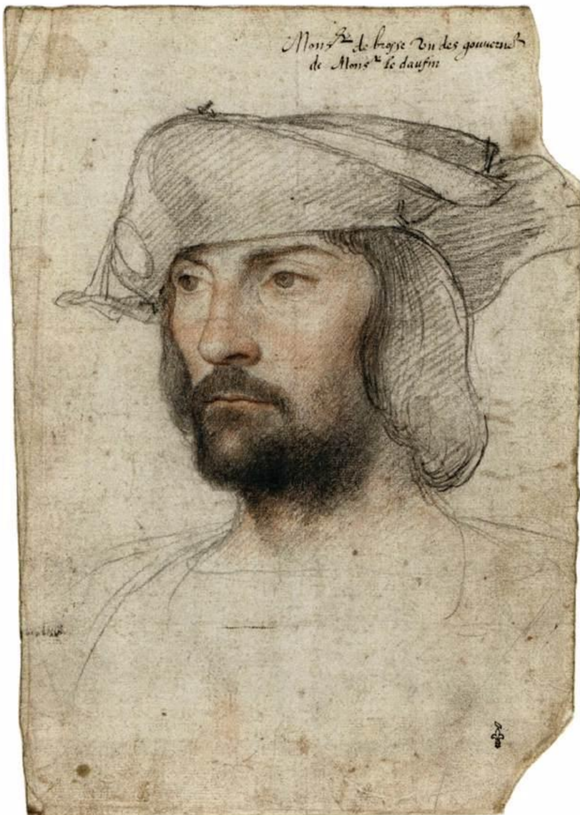
Илл. 164.4. Жан Клуэ. Жан де ла Барр. Рисунок.