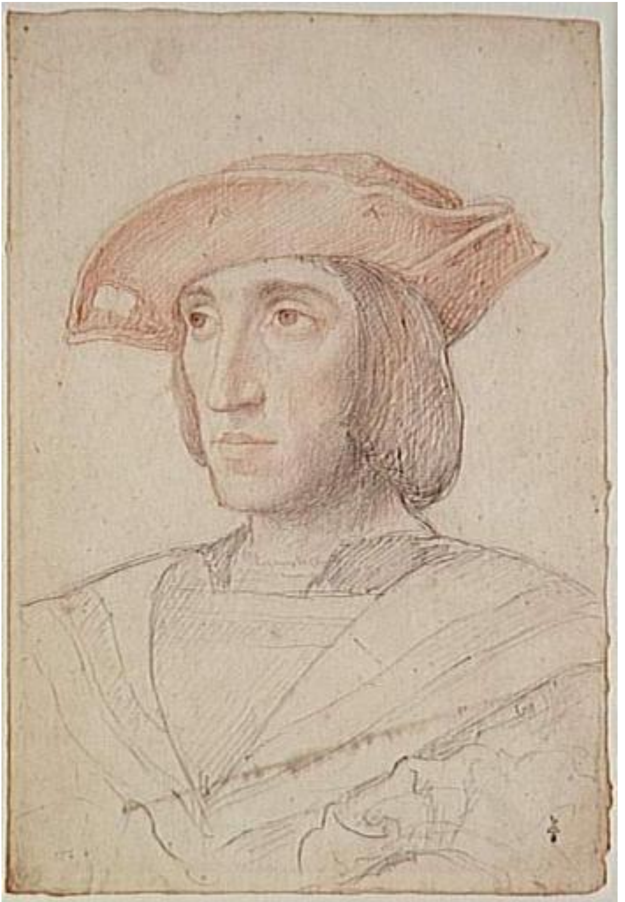
Илл. 164.8. Жан Клуэ. Коннетабль Бурбон. Рисунок.