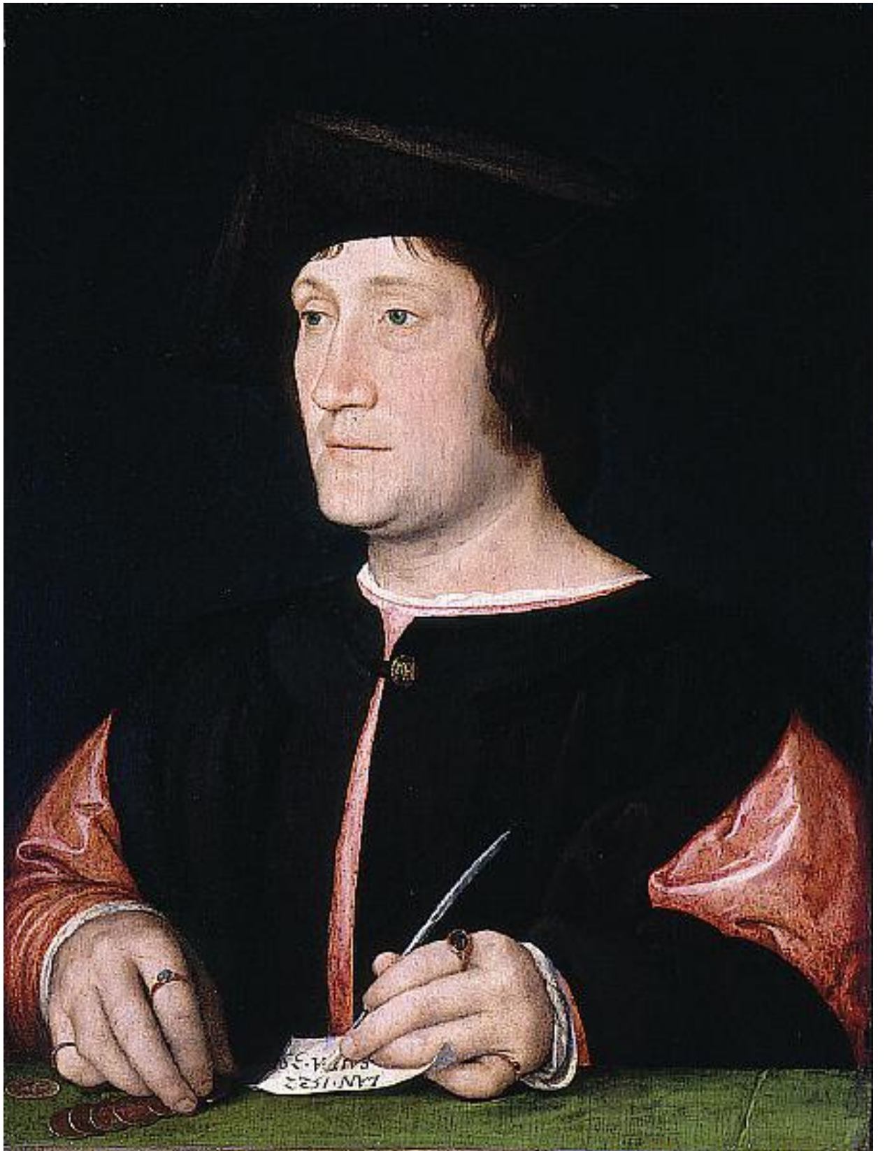
Илл. 164.26. Жан Клуэ. Портрет банкира.