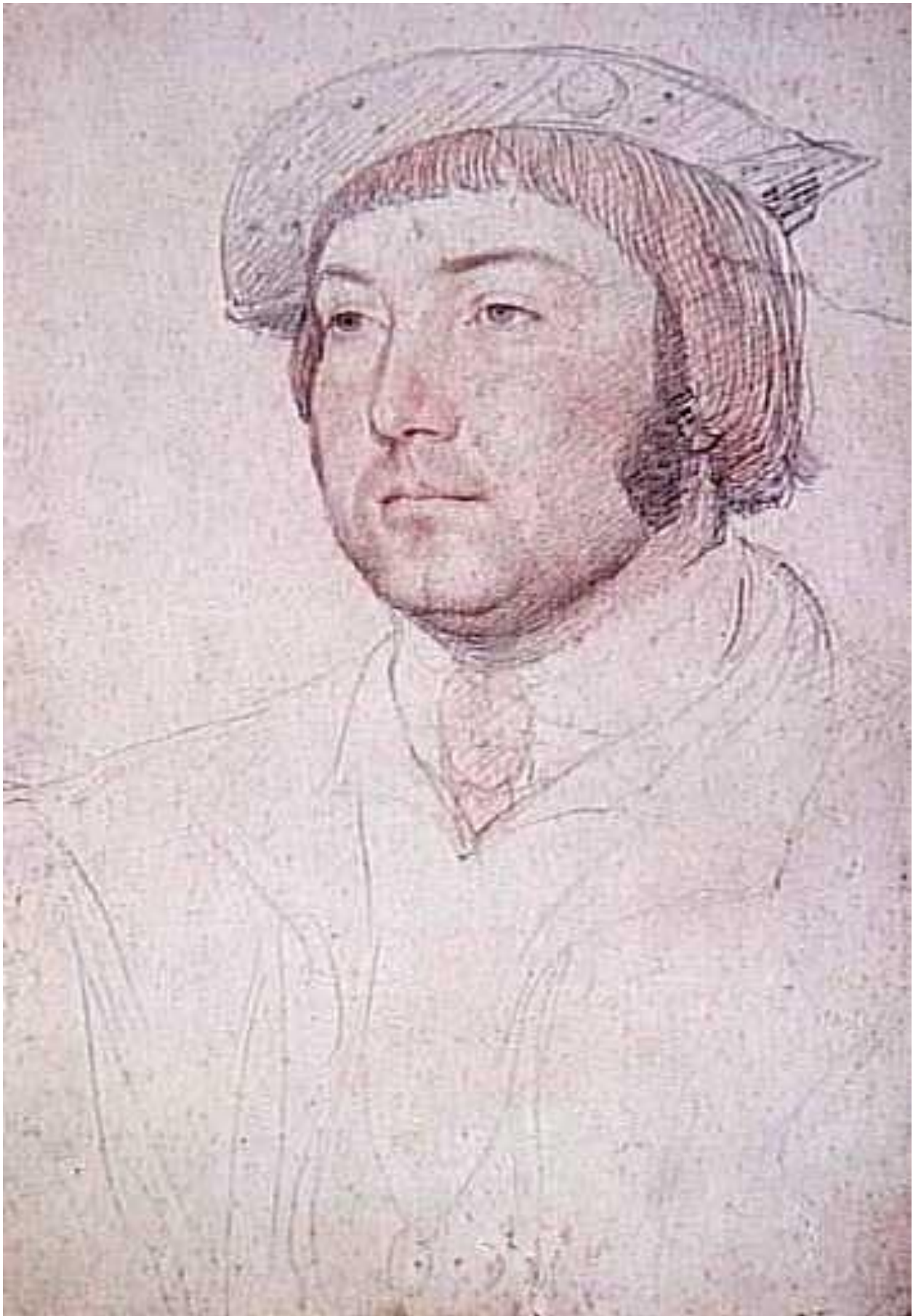
Илл. 164.1. Жан Клуэ. Жан VIII де Креки. Рисунок.