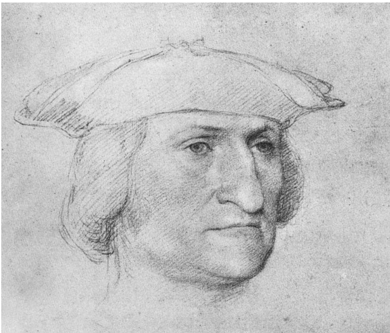
Илл. 164.9. Жан Клуэ. Портрет неизвестного мужчины. Рисунок.