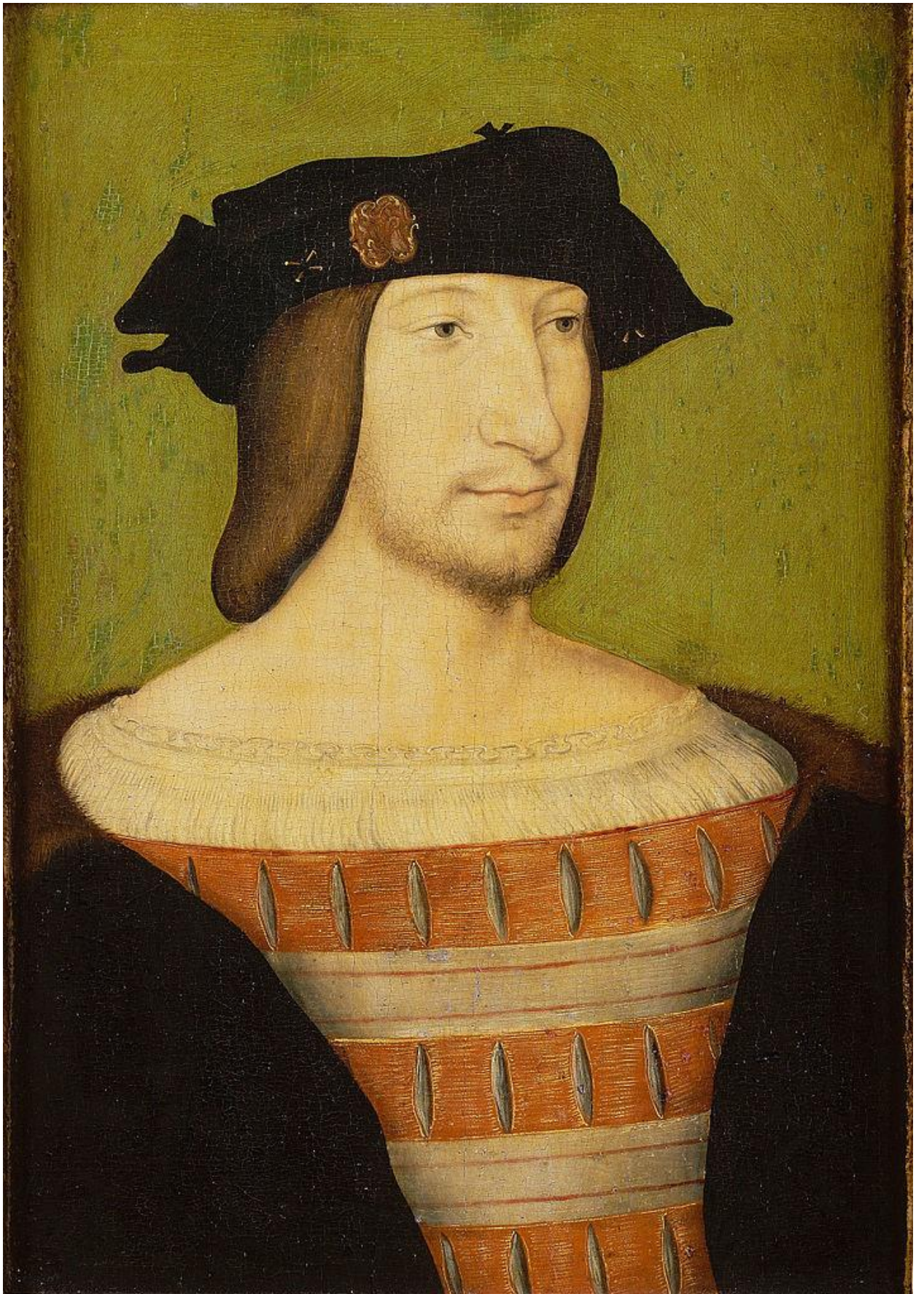
Илл. 164.19. Жан Клуэ. Портрет Франциска I, короля Франции.