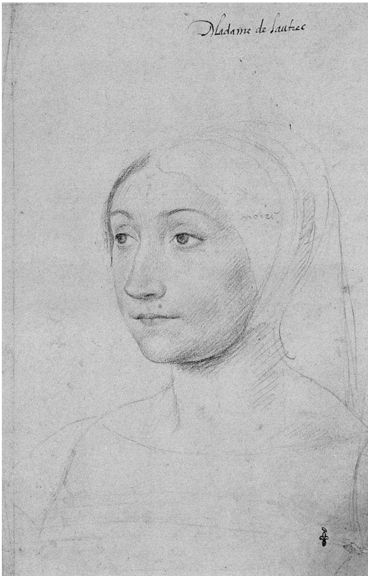
Илл. 164.14. Жан Клуэ. Мадам де Лотрек. Рисунок.