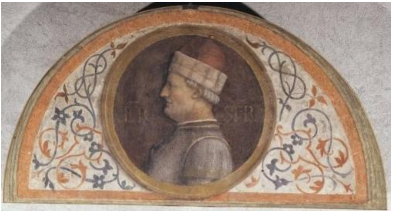
Илл. 164.21. Бернардино Луини. Франческо Сфорца.