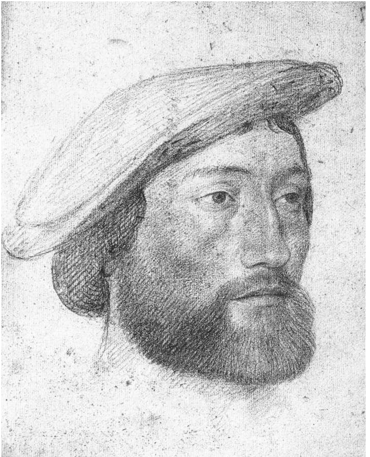
Илл. 164.2. Жан Клуэ. Портрет Жана де Динтевиля, сеньора де Полиси. Рисунок.