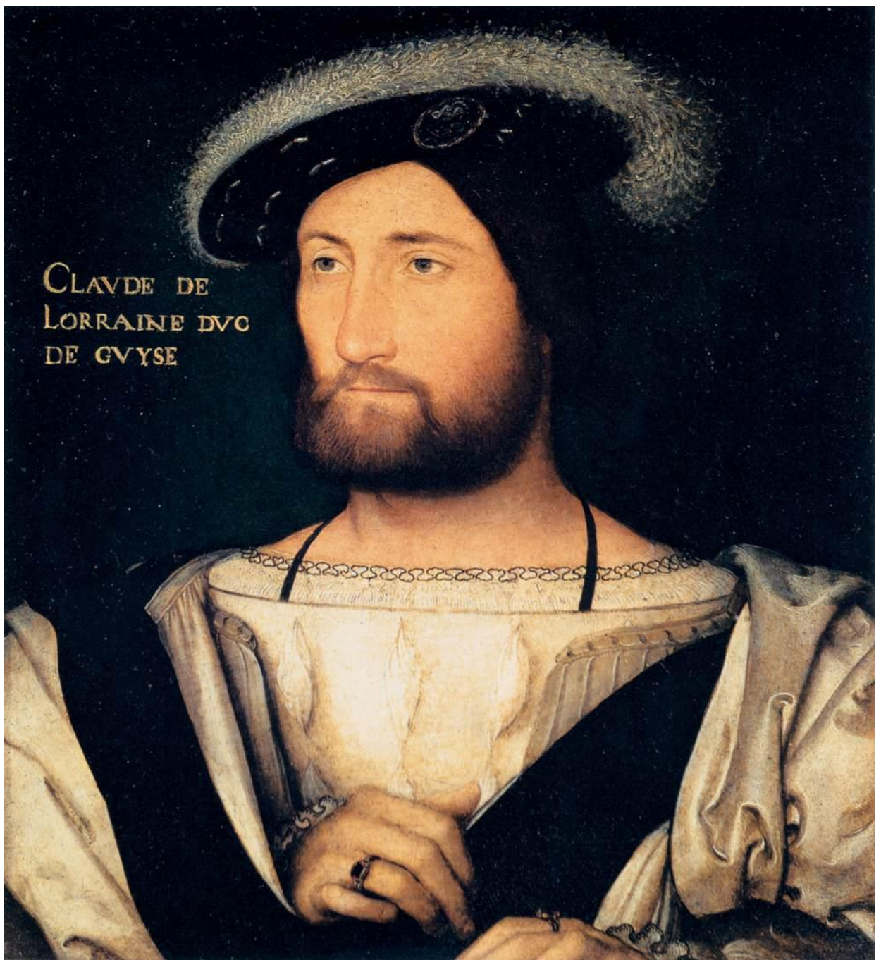
Илл. 164.20. Жан Клуэ. Портрет Клода Лотарингского, герцога де Гиза.