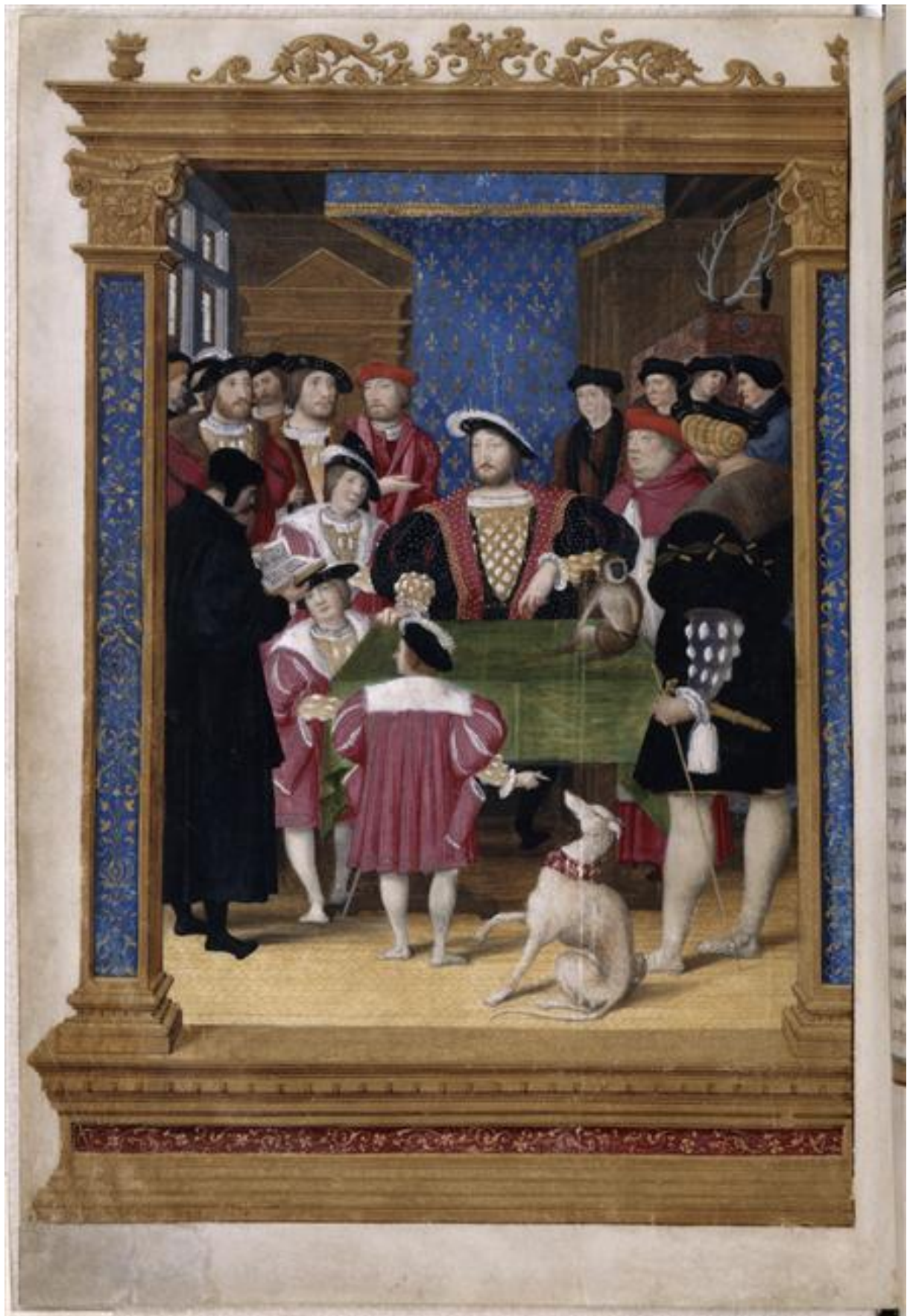
Илл. 164.16. Жан Клуэ. Лекция Антуана Мако Франциску I и его придворным. Фронтиспис Всеобщей истории Диодора Сицилийского. Миниатюра.