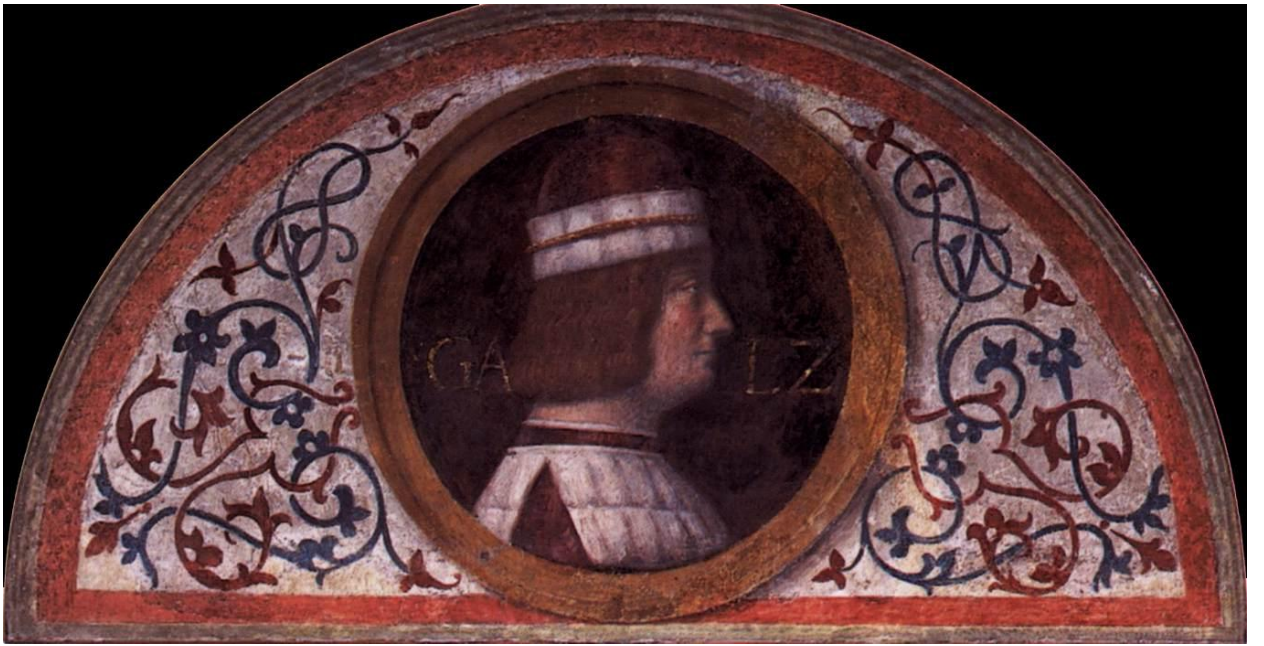
Илл. 164.22. Бернардино Луини. Галеаццо Сфорца.