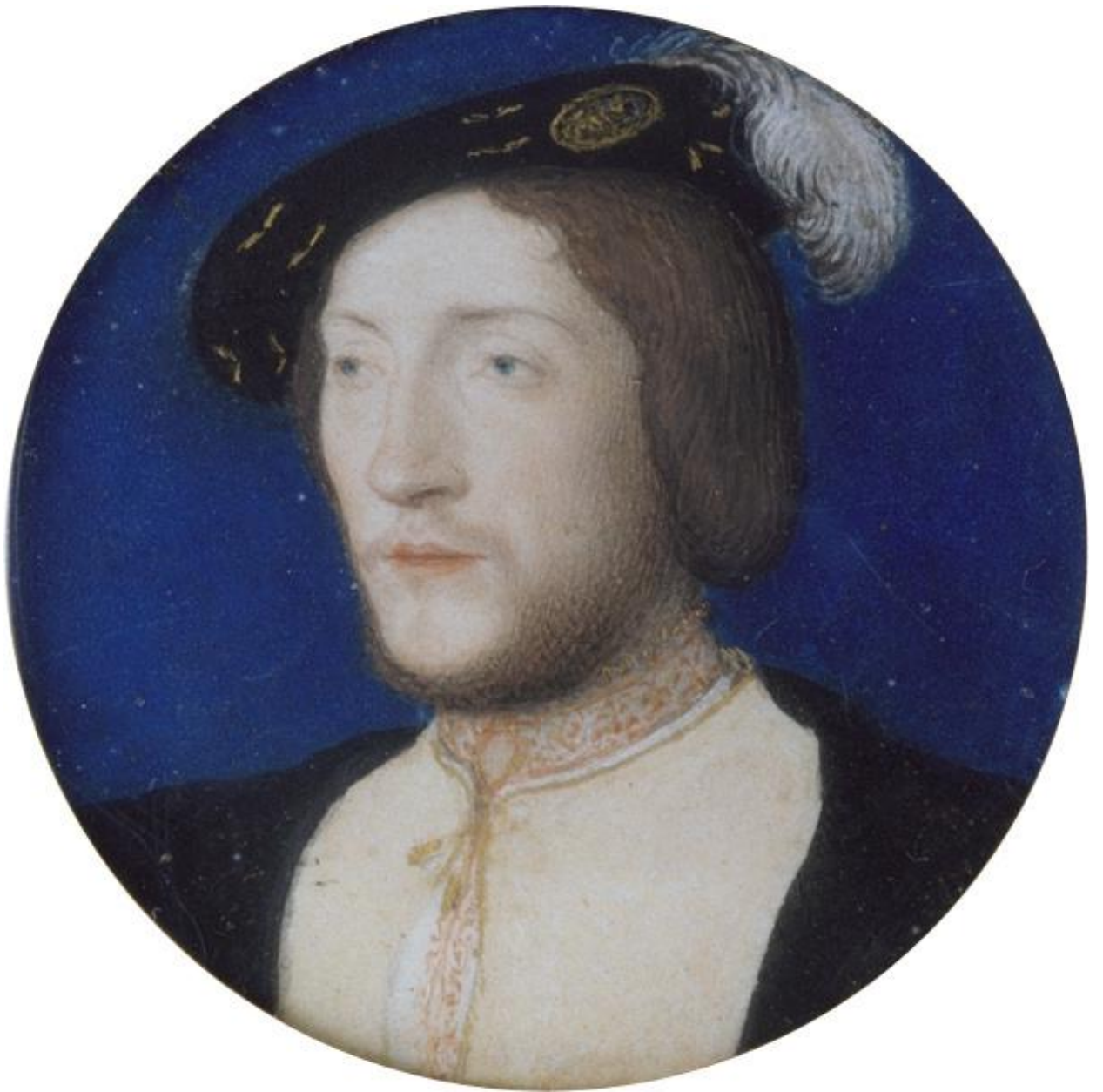
Илл. 164.24. Жан Клуэ. Шарль I де Коссе, граф де Бриссак.