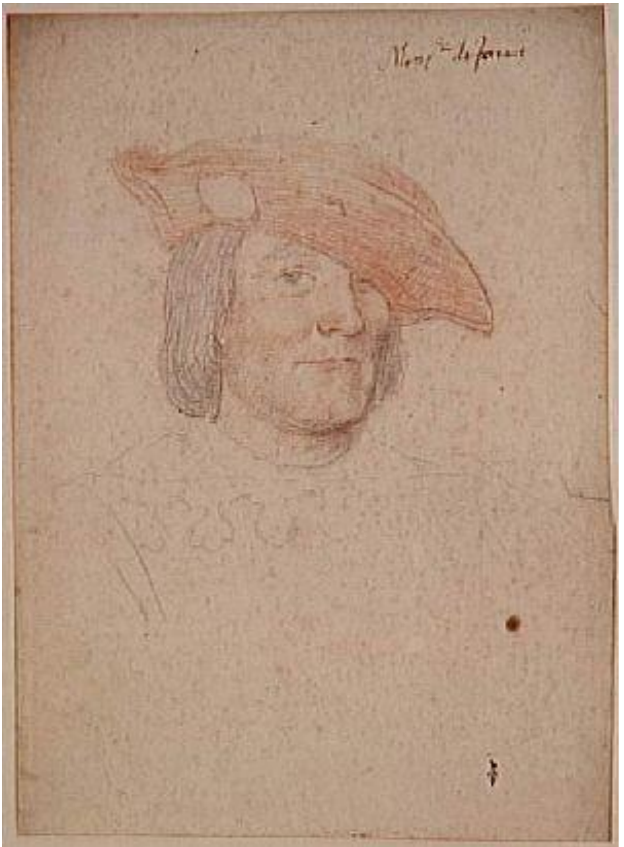
Илл. 164.5. Жан Клуэ. Андре де Фуа. Рисунок.