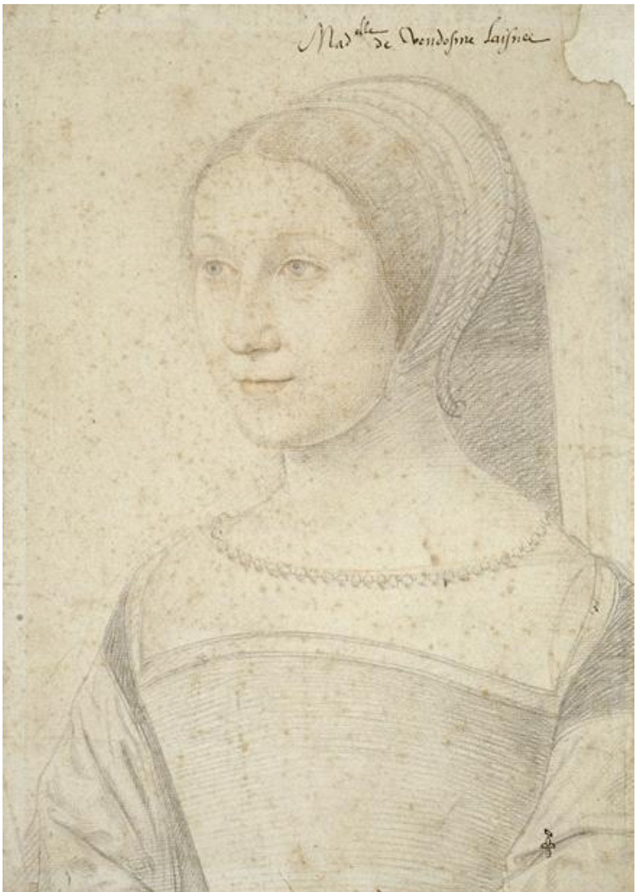
Илл. 164.11. Жан Клуэ. Мари де Бурбон. Рисунок.