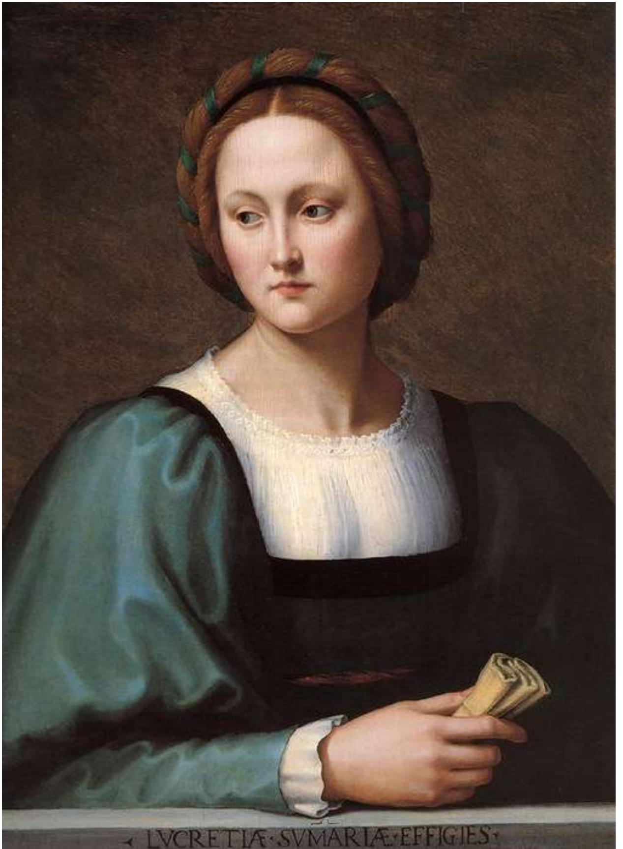
Илл. 144.3. Ридольфо Гирландайо. Лукреция Соммария.