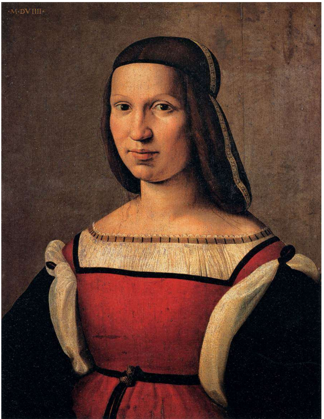
Илл. 144.2. Ридольфо Гирландайо. Портрет дамы.