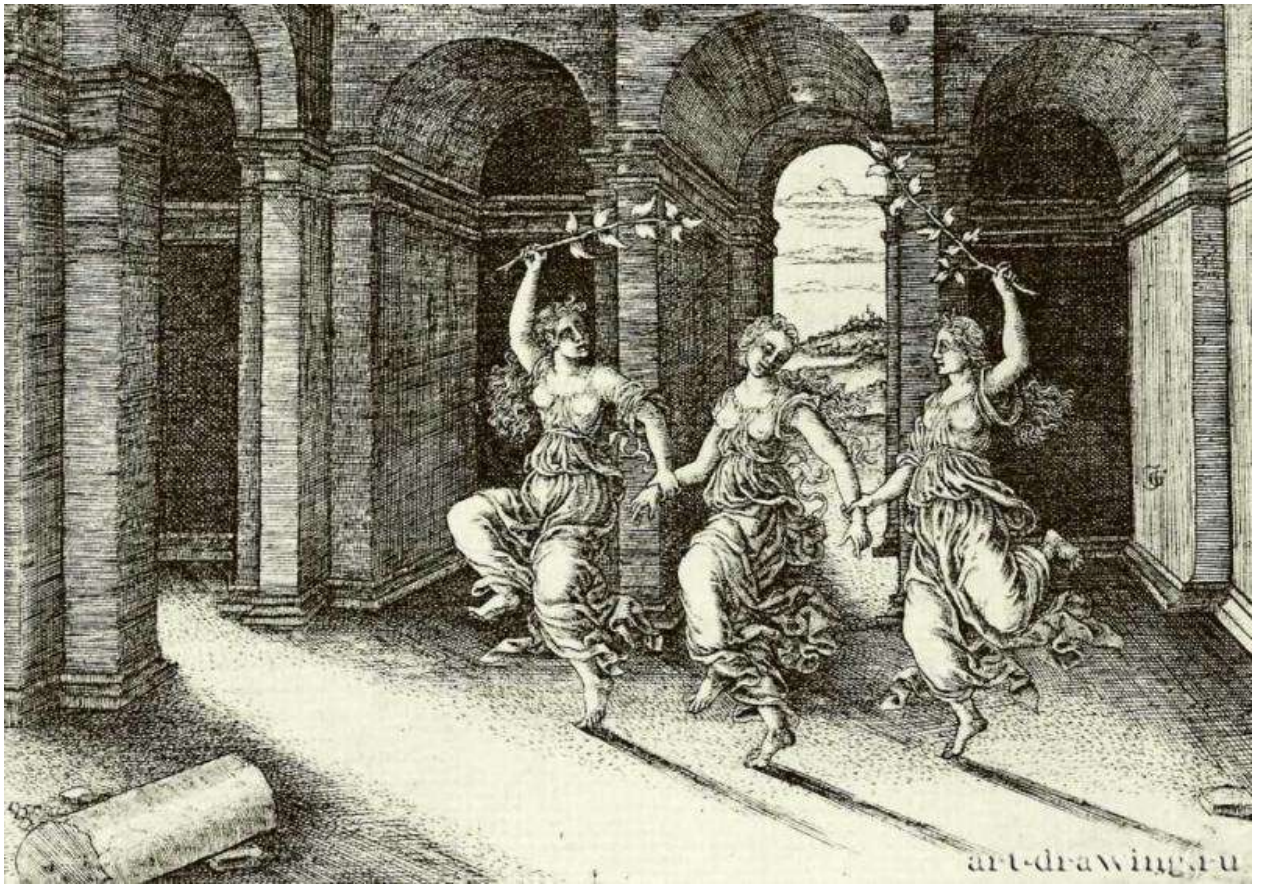
Илл. 143.5. Жан де Гурмон. Три юные танцовщицы. Гравюра на меди.