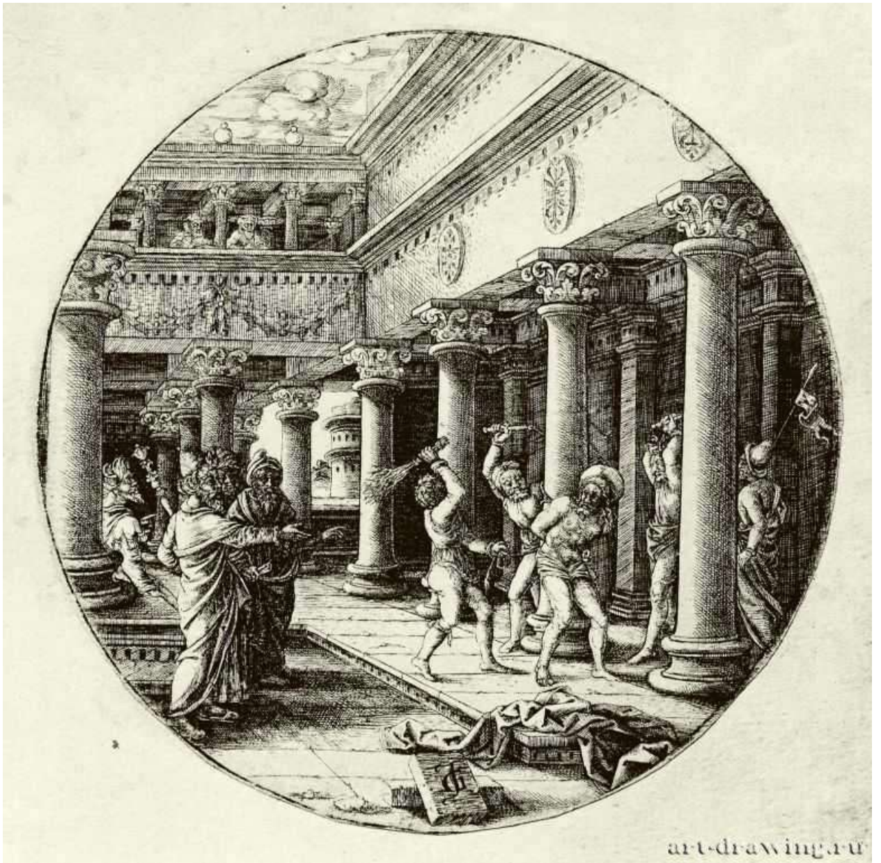
Илл. 143.3. Жан де Гурмон. Бичевание Христа. Гравюра на меди.