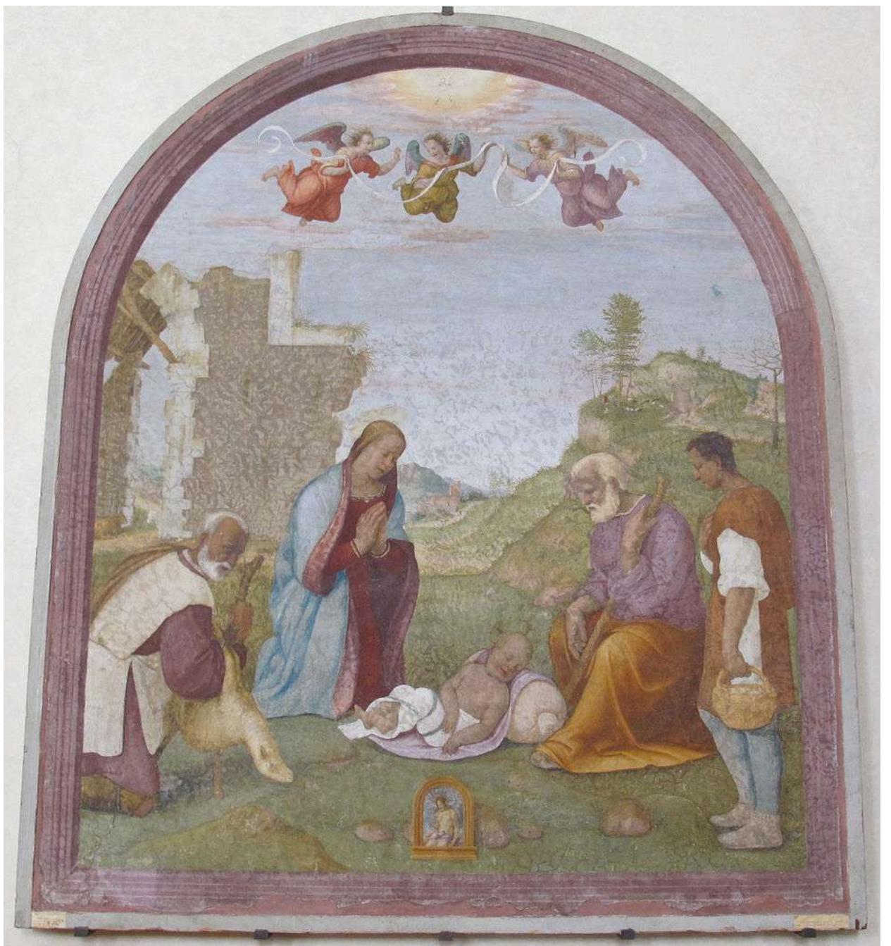
Илл. 143.12. Франчабиджо. Поклонение пастухов.