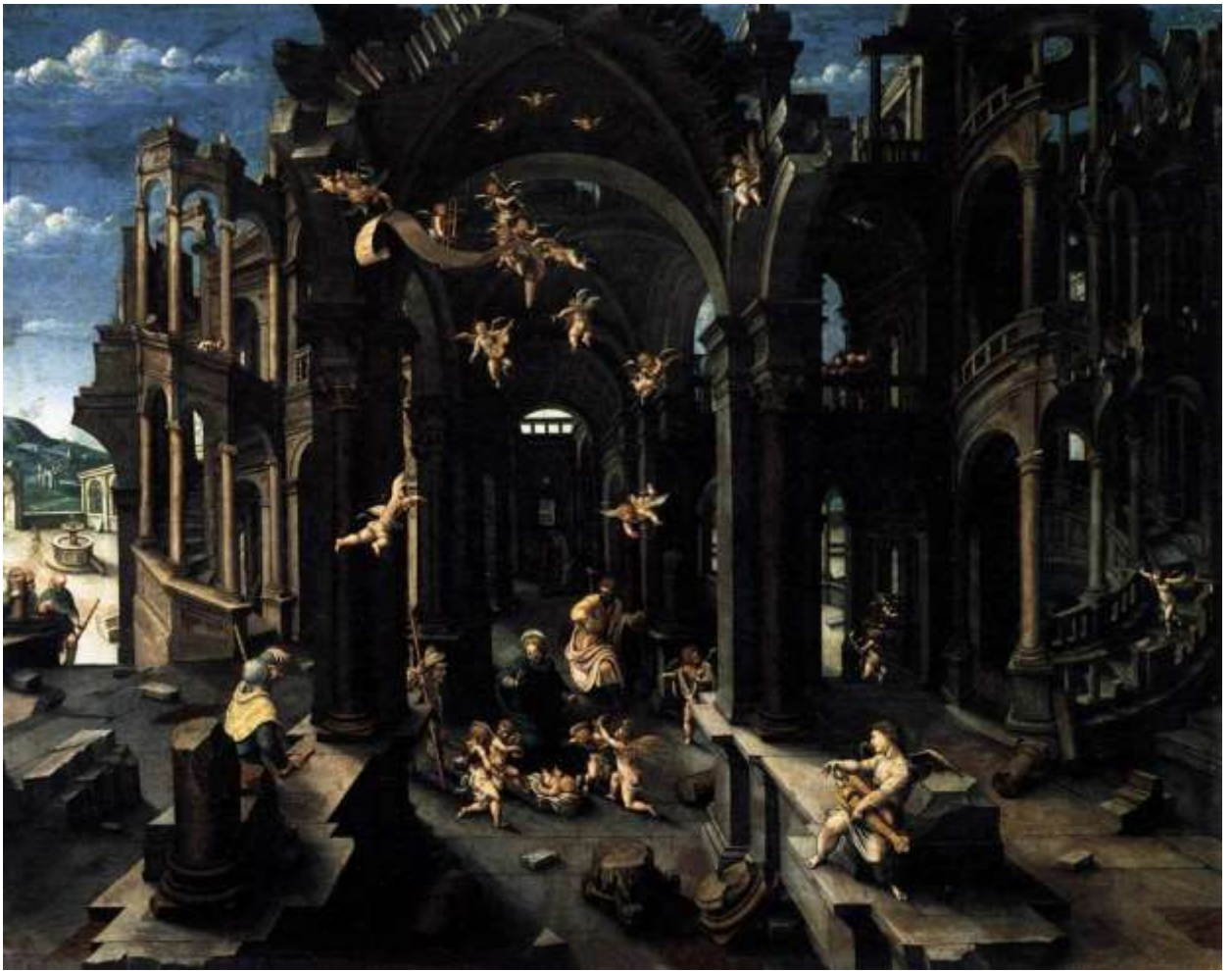
Илл. 143.7. Жан де Гурмон. Поклонение пастухов.