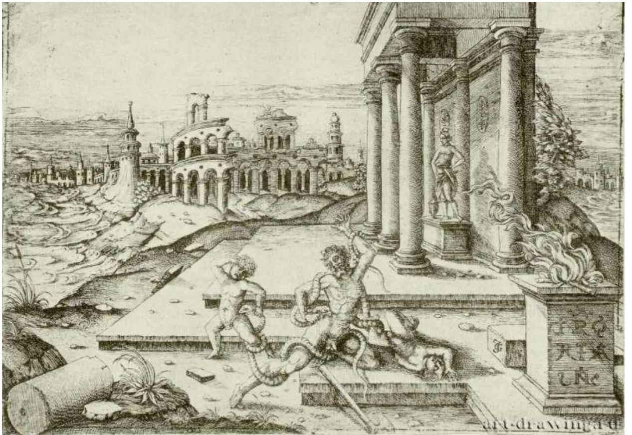
Илл. 143.4. Жан де Гурмон. Лаокоон. Гравюра на меди.