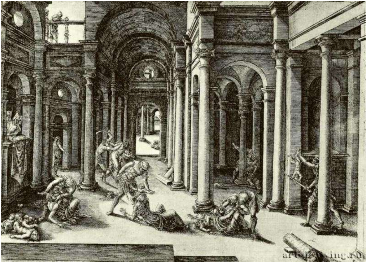
Илл. 143.2. Жан де Гурмон. Избиение младенцев в Вифлееме. Гравюра на меди.