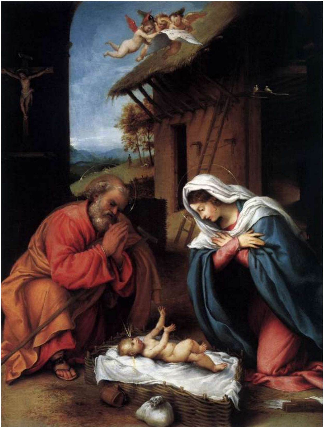
Илл. 143.8. Лоренцо Лотто. Рождество.