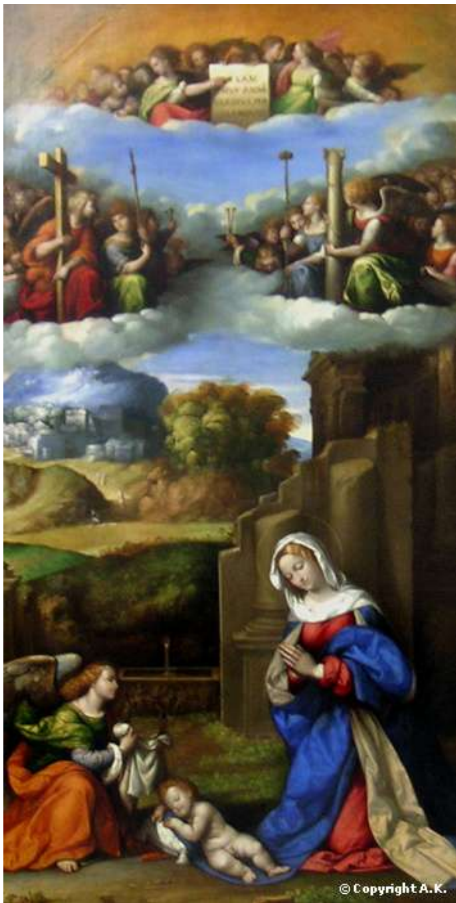
Илл. 143.10. Гарофало. Поклонение Младенцу.