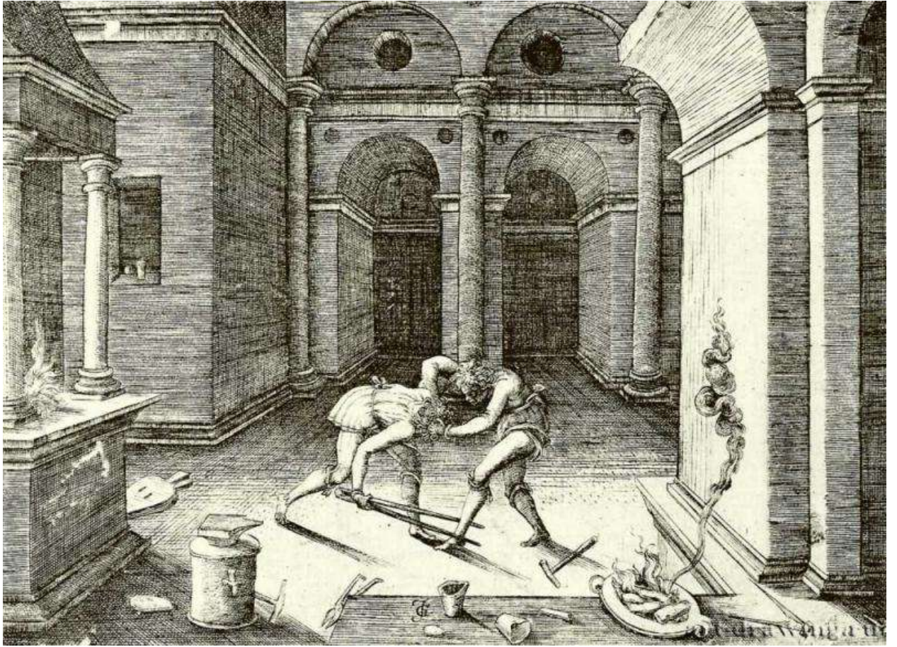
Илл. 143.6. Жан де Гурмон. Драка подмастерьев златокузнеца. Гравюра на меди.