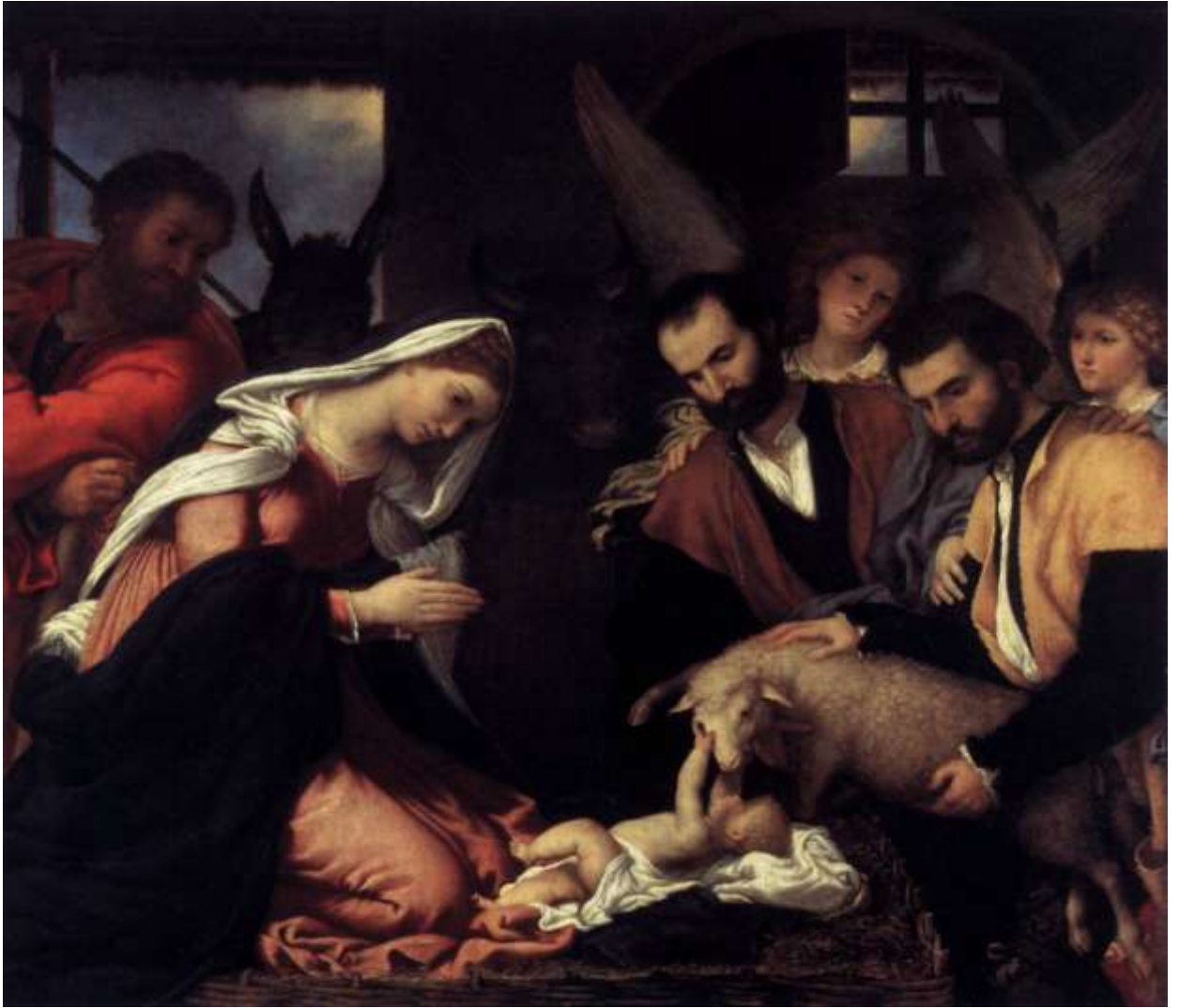
Илл. 143.9. Лоренцо Лотто. Поклонение пастухов.