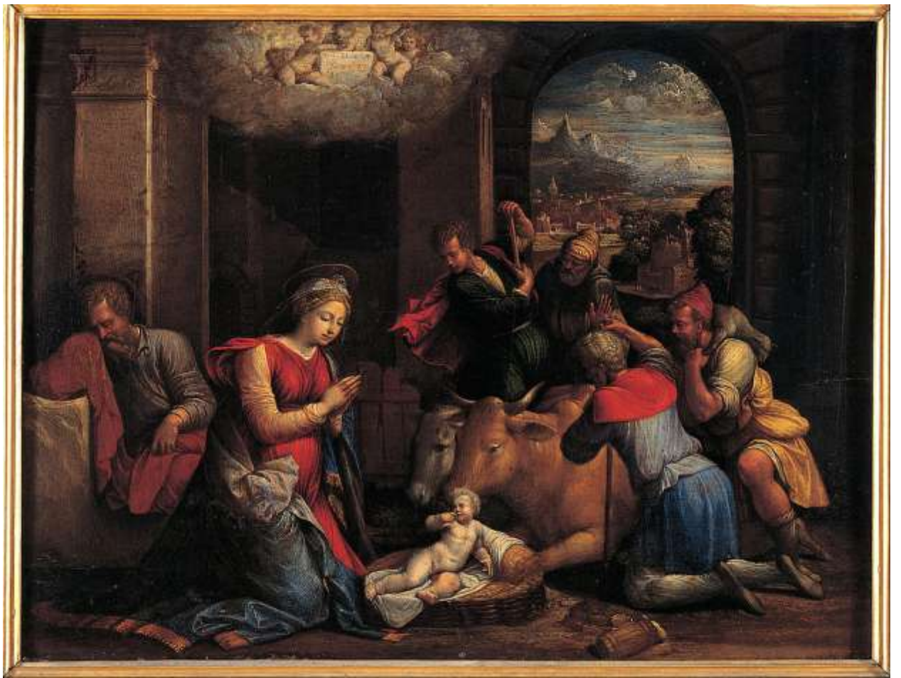
Илл. 143.11. Гарофало. Поклонение пастухов.