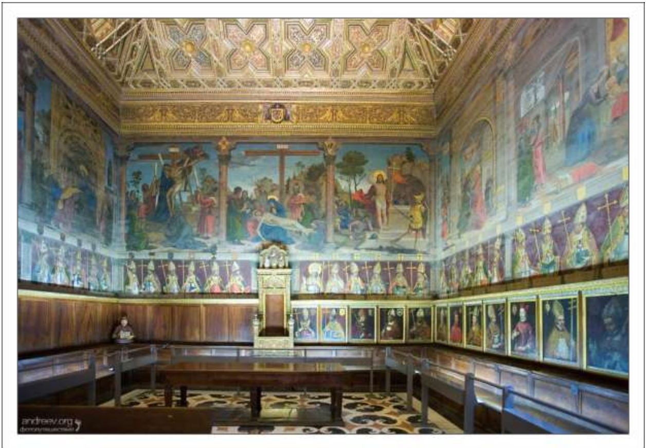
Илл. 126.2. Зал капитула собора в Толедо.