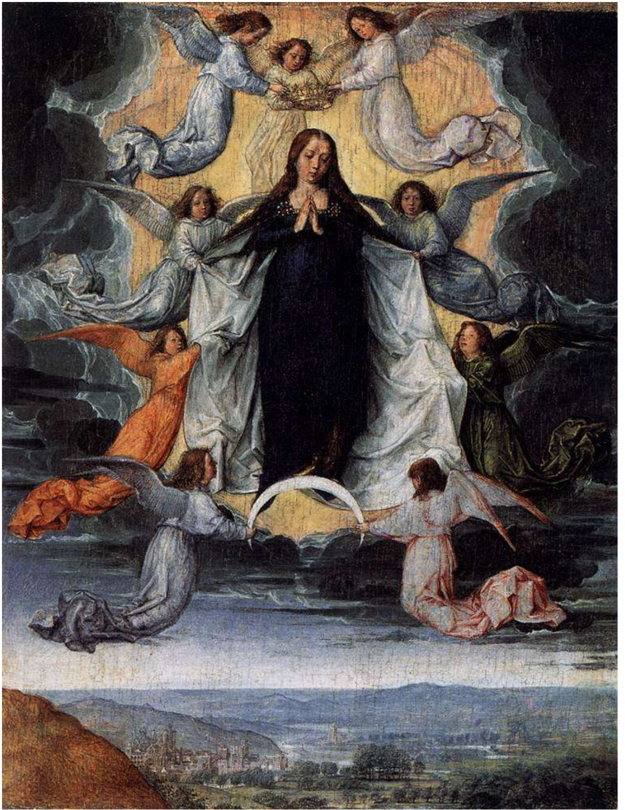
Илл. 115.1. Михель Зиттов. Успение Марии.