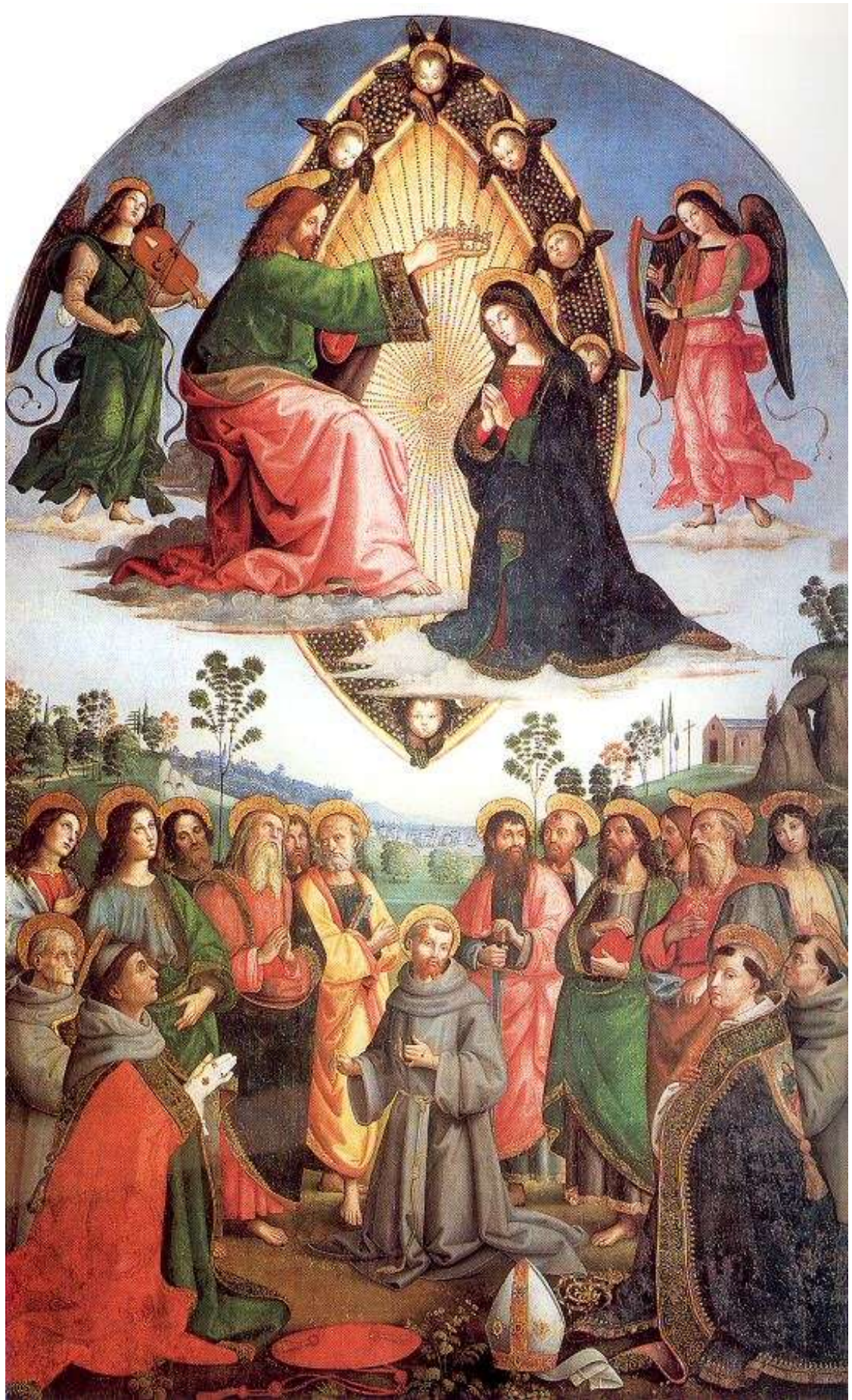
Илл. 115.11. Пинтуриккио. Коронование Марии.