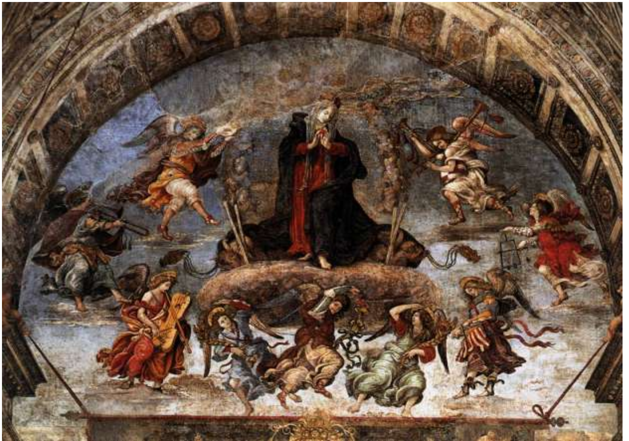
Илл. 115.4. Филиппино Липпи. Успение Девы Марии.