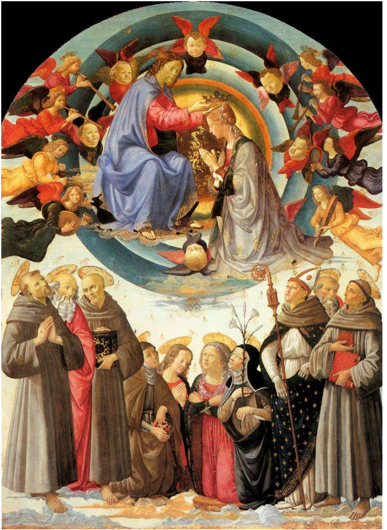
Илл. 115.8. Доменико Гирландайо. Коронование Марии.