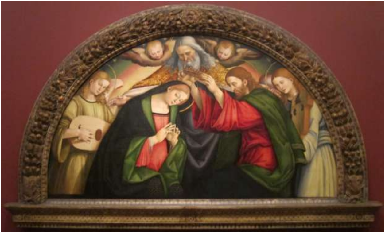
Илл. 115.7. Лука Синьорелли. Коронование Марии.