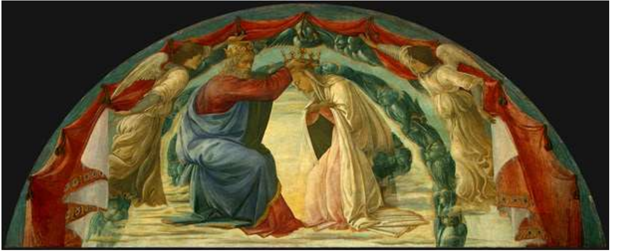
Илл. 115.12. Филиппино Липпи. Коронование Марии.