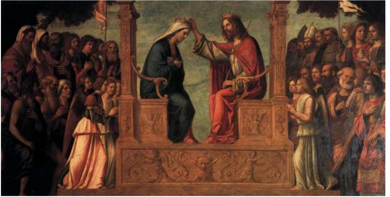
Илл. 115.13. Чима да Конельяно. Коронование Марии.