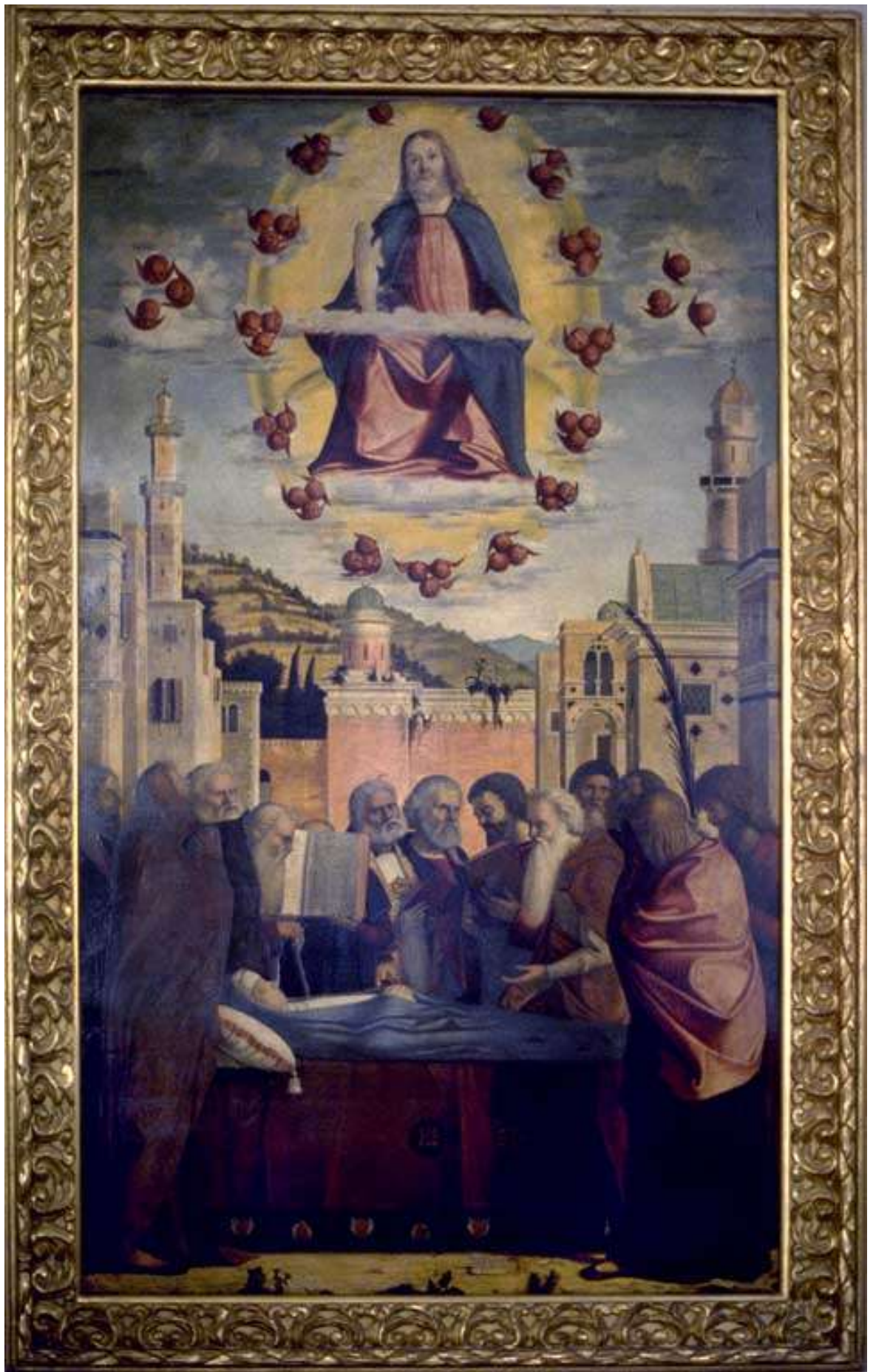
Илл. 115.5. Витторе Карпаччо. Смерть Девы Марии.