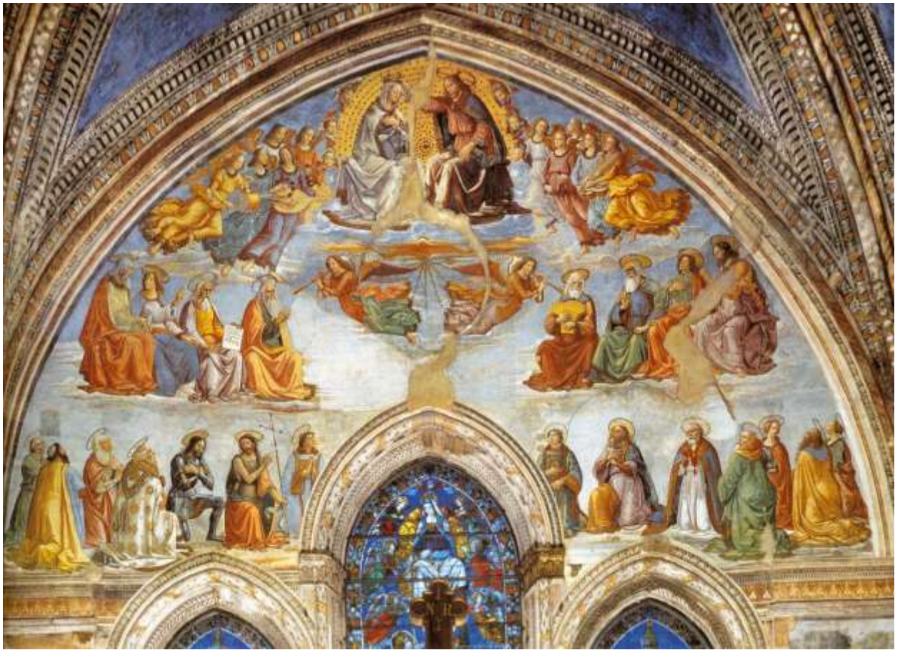
Илл. 115.10. Доменико Гирландайо. Коронование Марии.