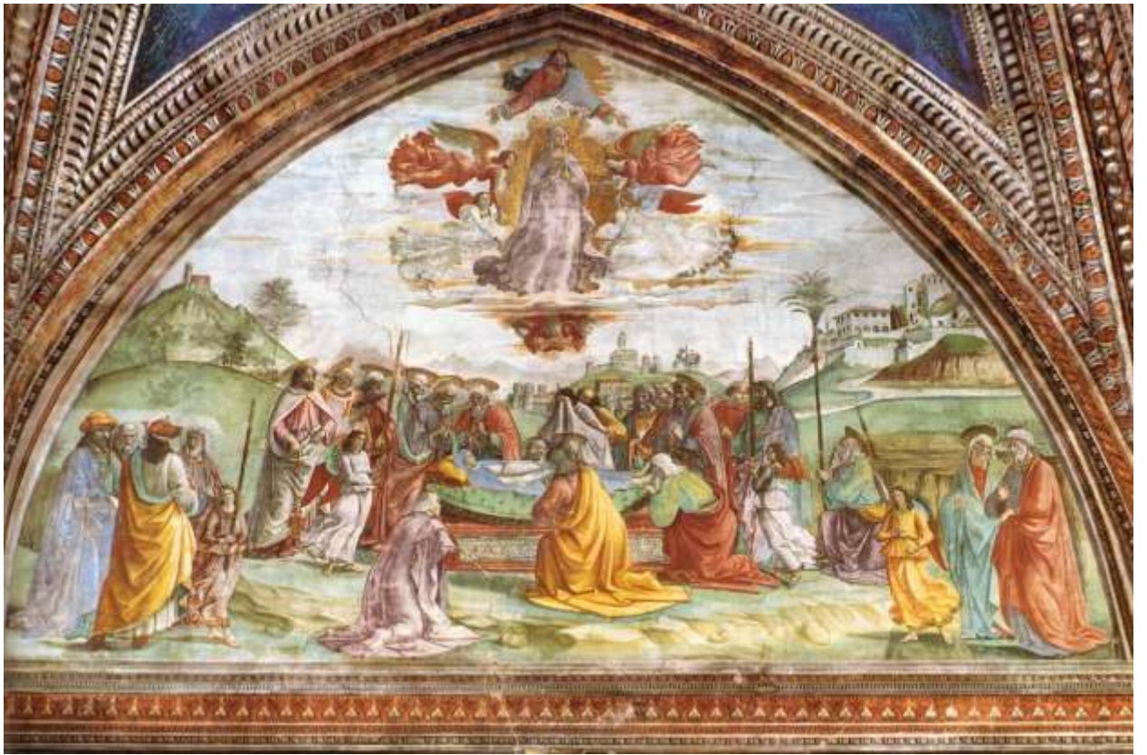
Илл. 115.2. Доменико Гирландайо. Смерть и Вознесение Девы Марии.