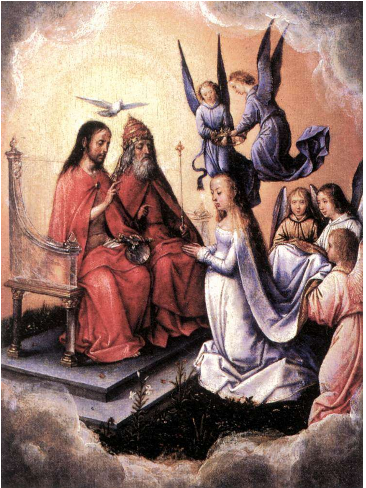
Илл. 115.6. Михель Зиттов. Коронование Девы Марии.