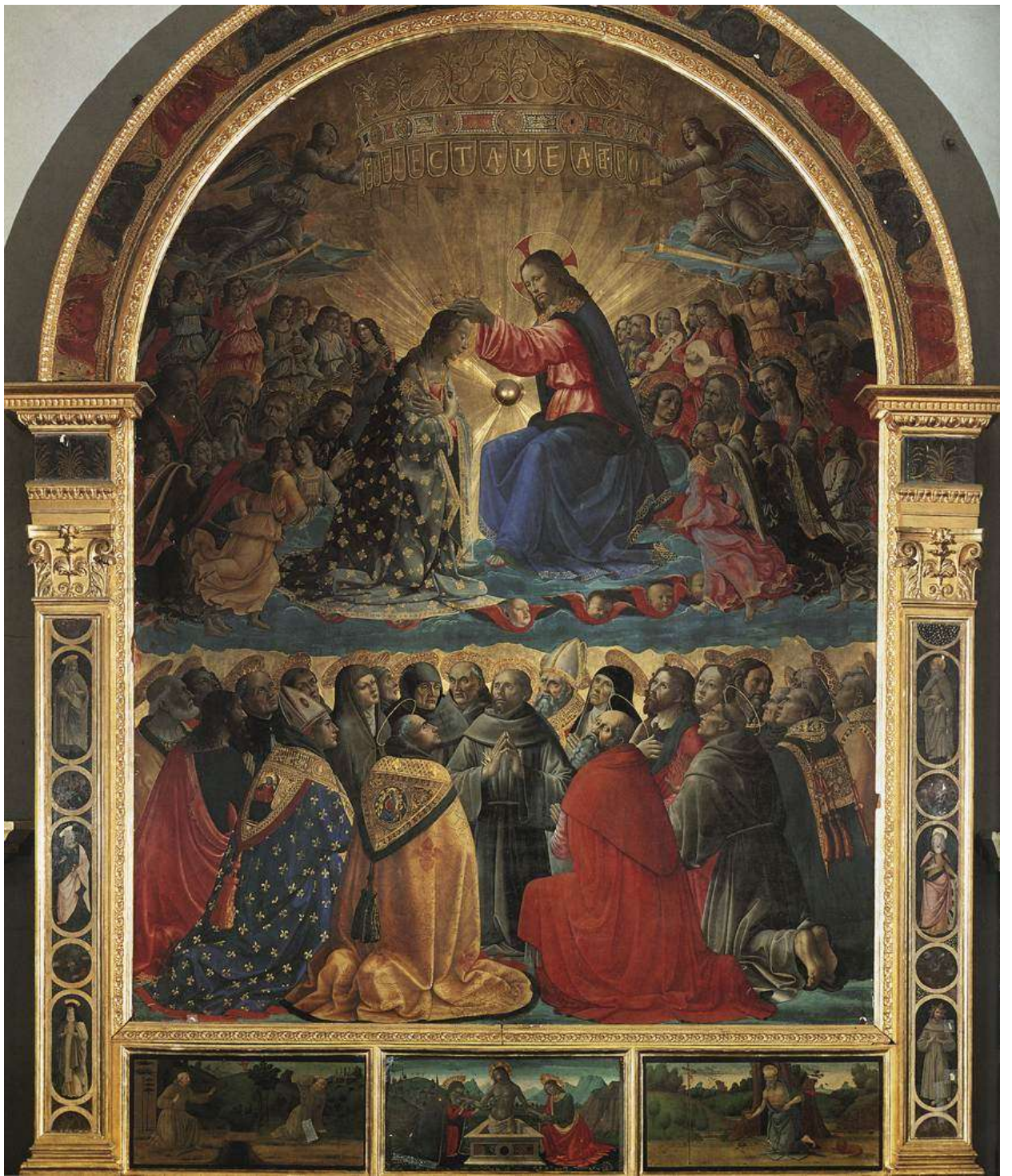
Илл. 115.9. Доменико Гирландайо. Коронование Марии.