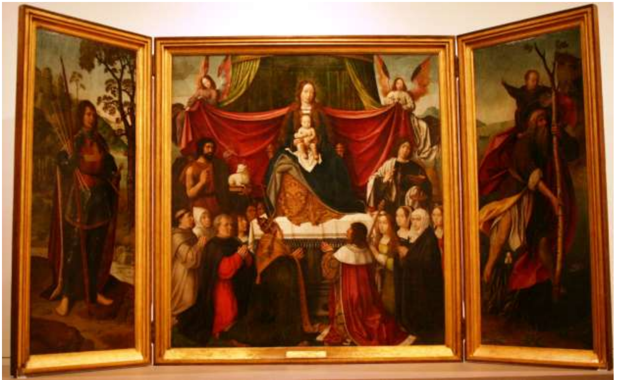
Илл. 112.13. Ян Провост. Триптих Мизерикордии.