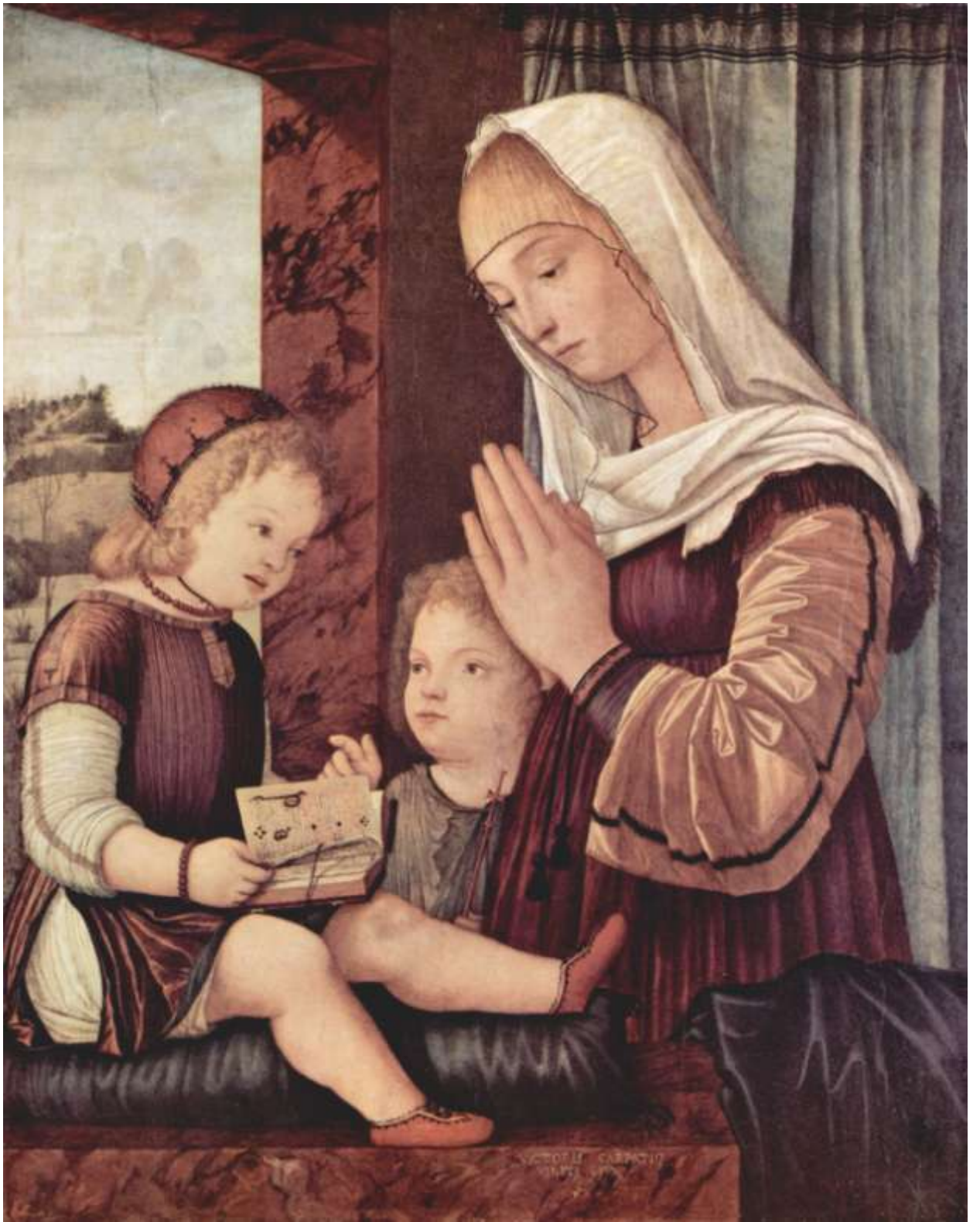
Илл. 112.5. Витторе Карпаччо. Мадонна с Младенцем и юным Иоанном Крестителем.