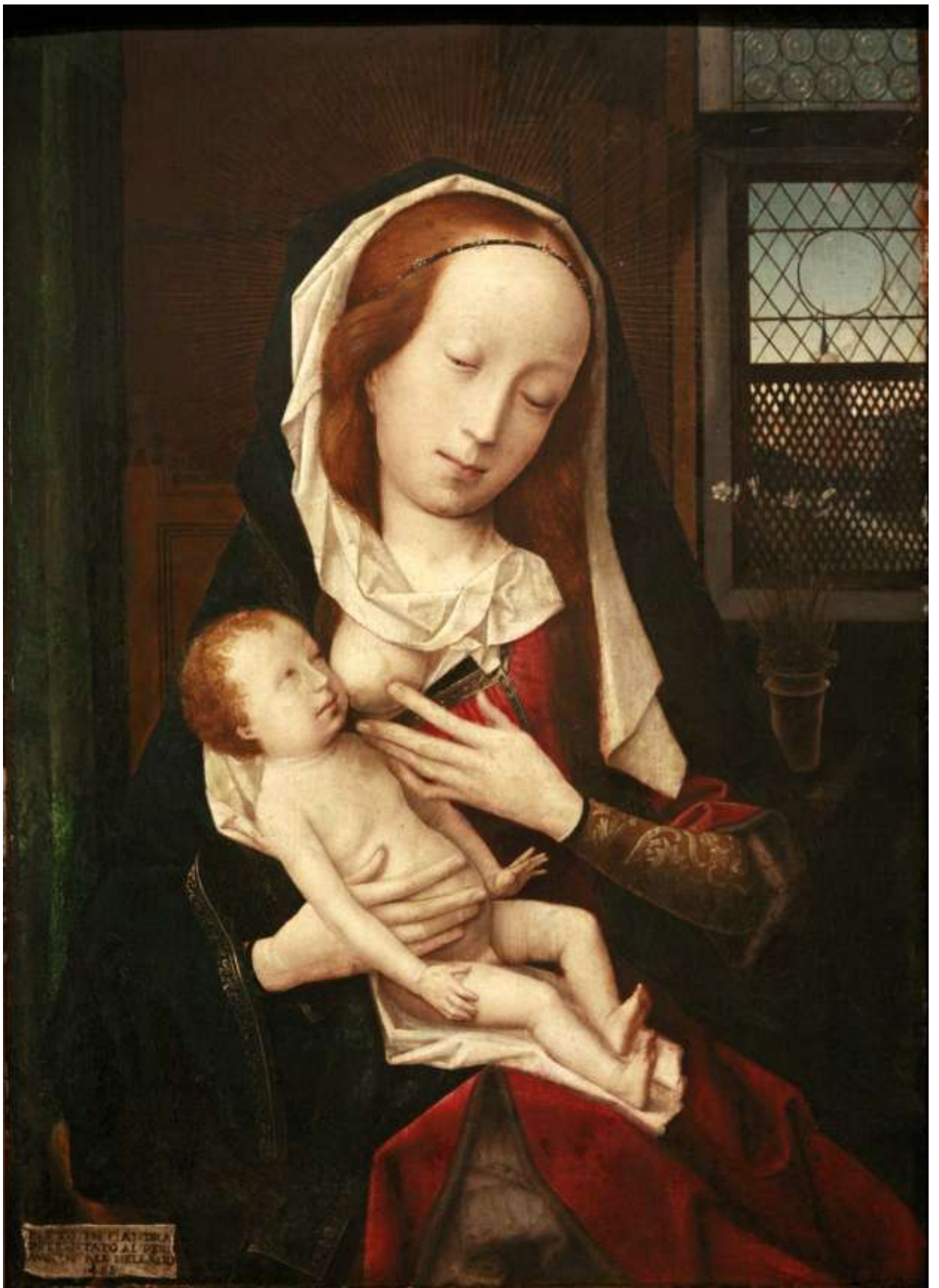
Илл. 112.9. Ян Провост. Кормящая Мадонна.