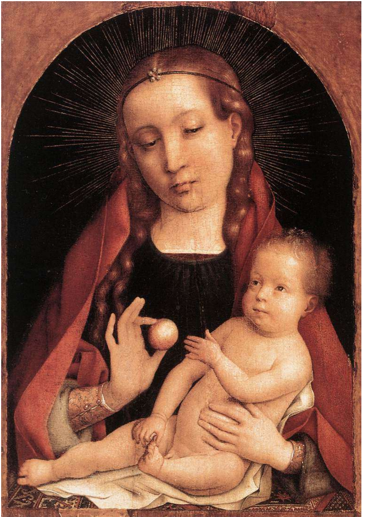
Илл. 112.8. Ян Провост. Мадонна с Младенцем.