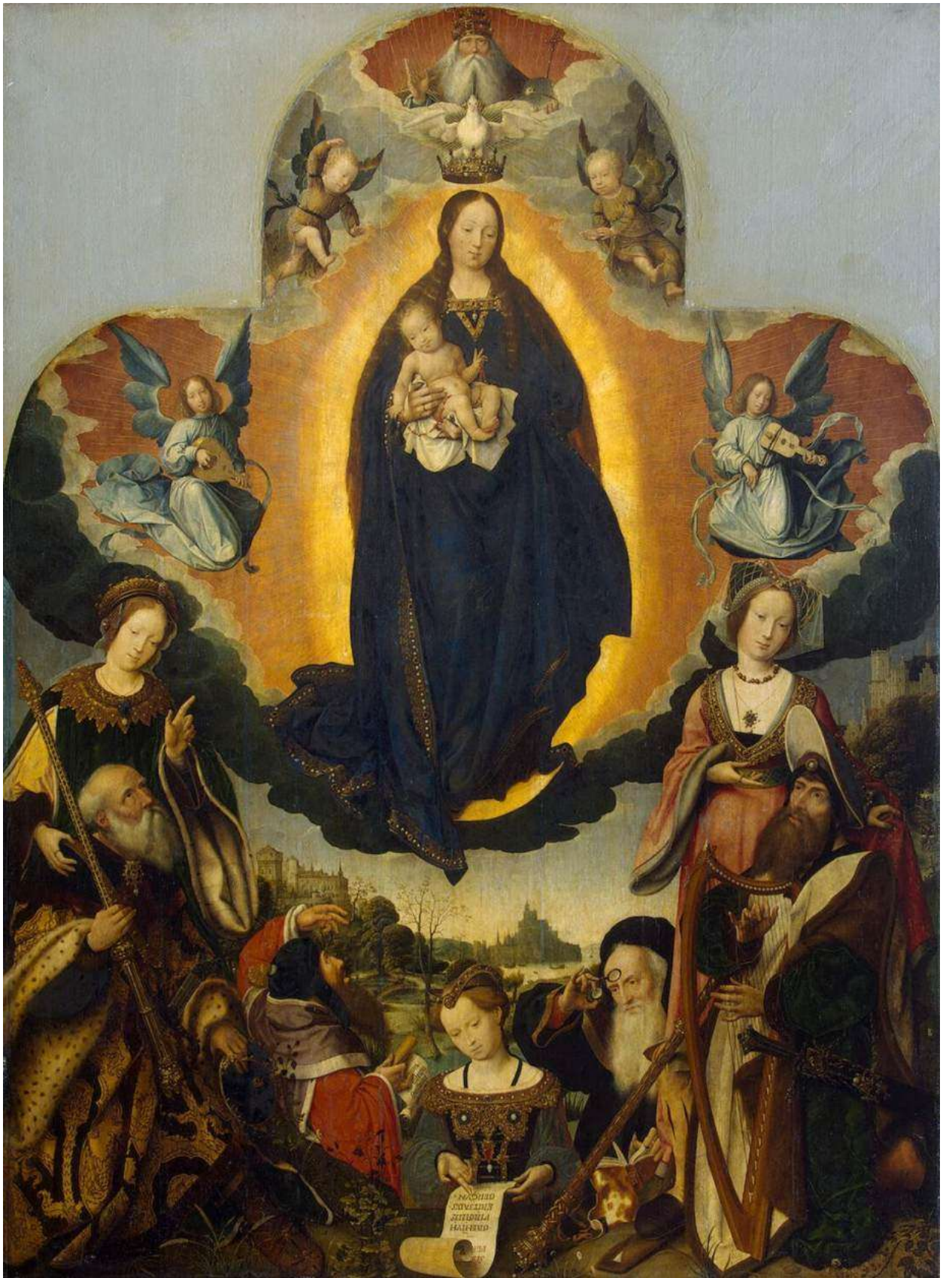
Илл. 112.3. Ян Провост. Дева Мария во славе.