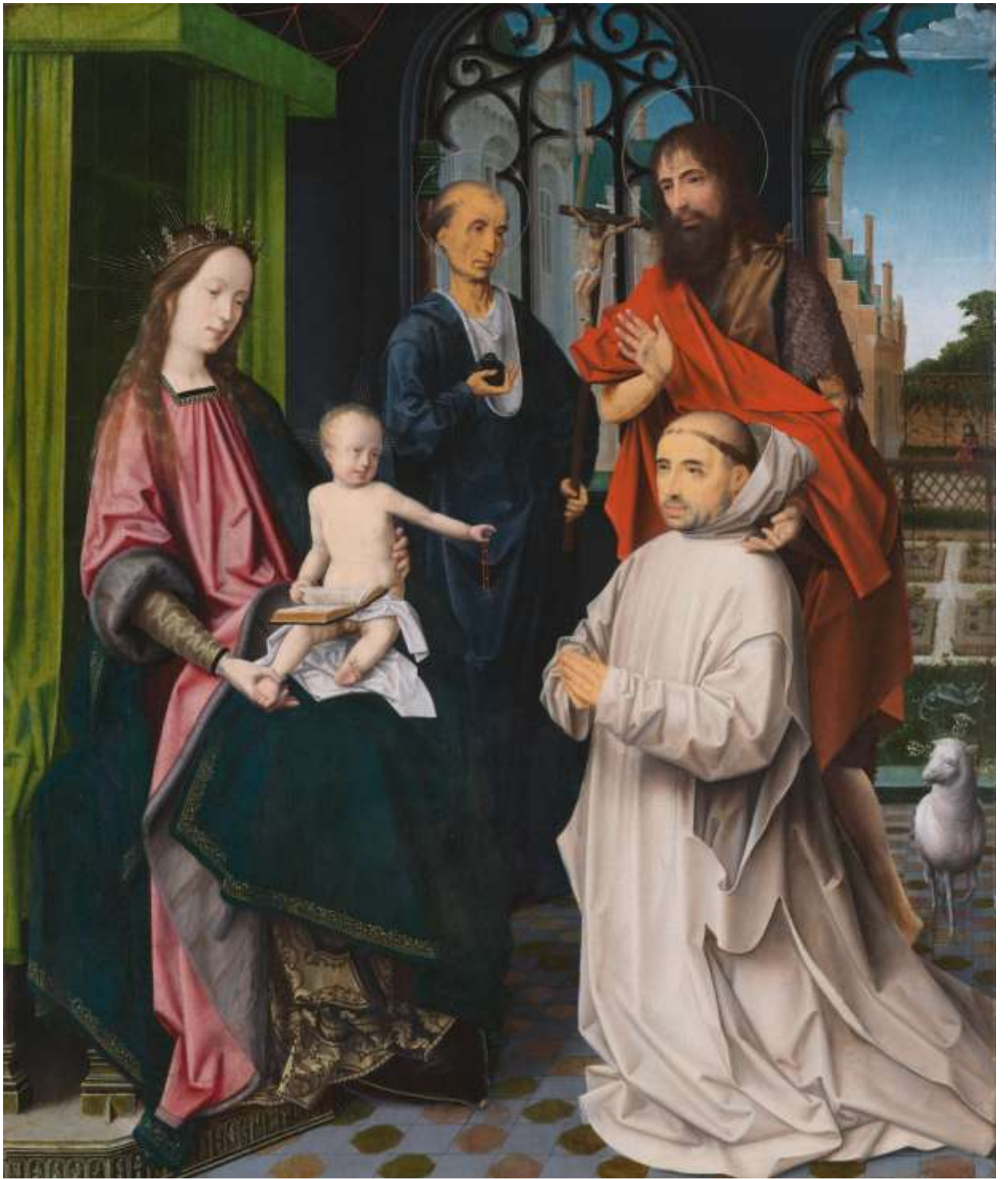
Илл. 112.2. Ян Провост. Мадонна с Младенцем на престоле со св. Иеронимом, Иоанном Крестителем и преклоняющимся картезианцем.