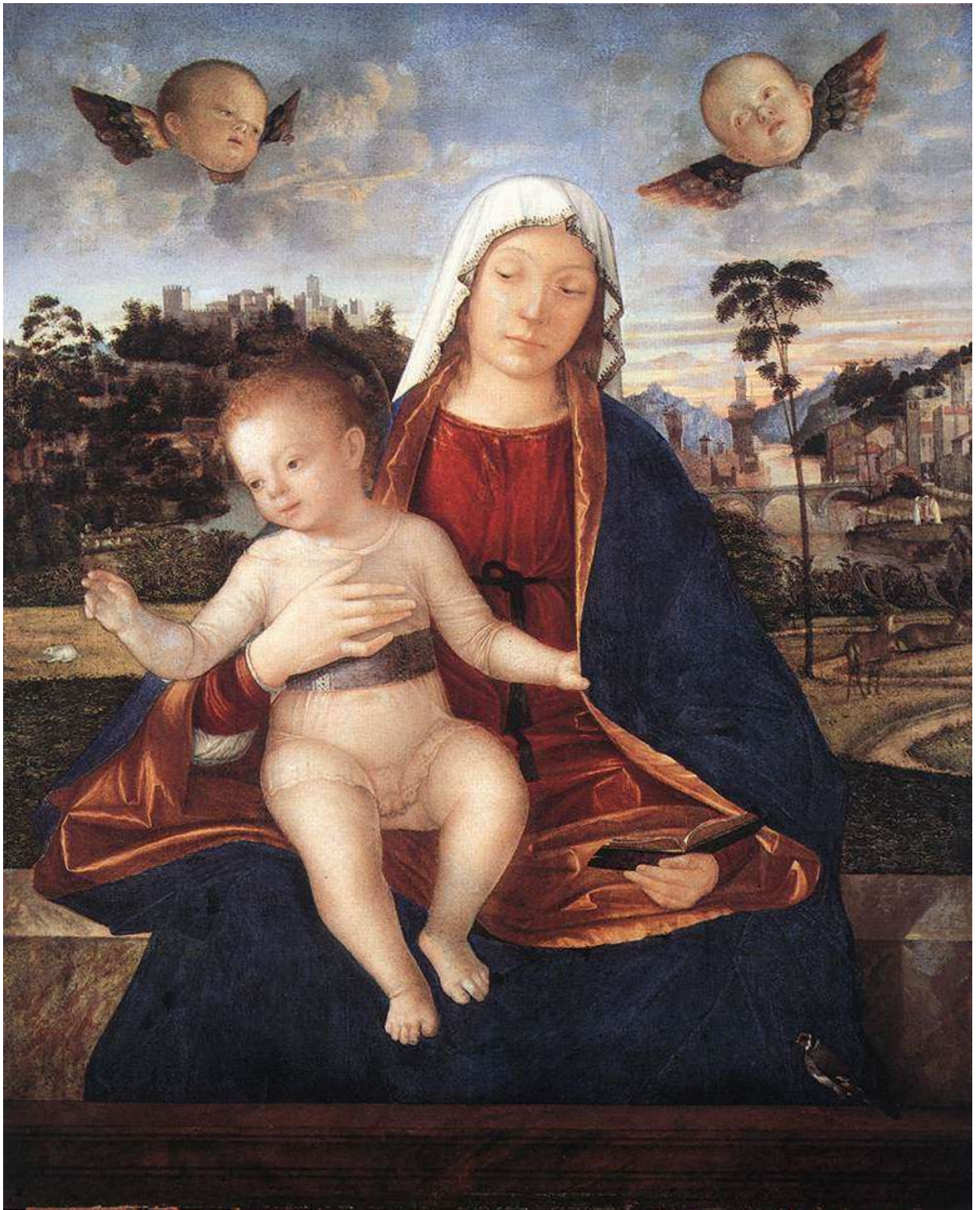
Илл. 112.4. Витторе Карпаччо. Мадонна с Младенцем.