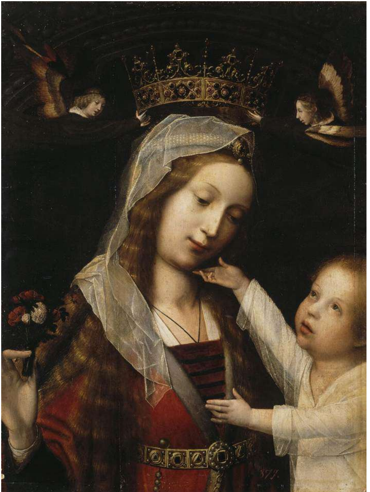
Илл. 112.7. Ян Провост. Мадонна с Младенцем.