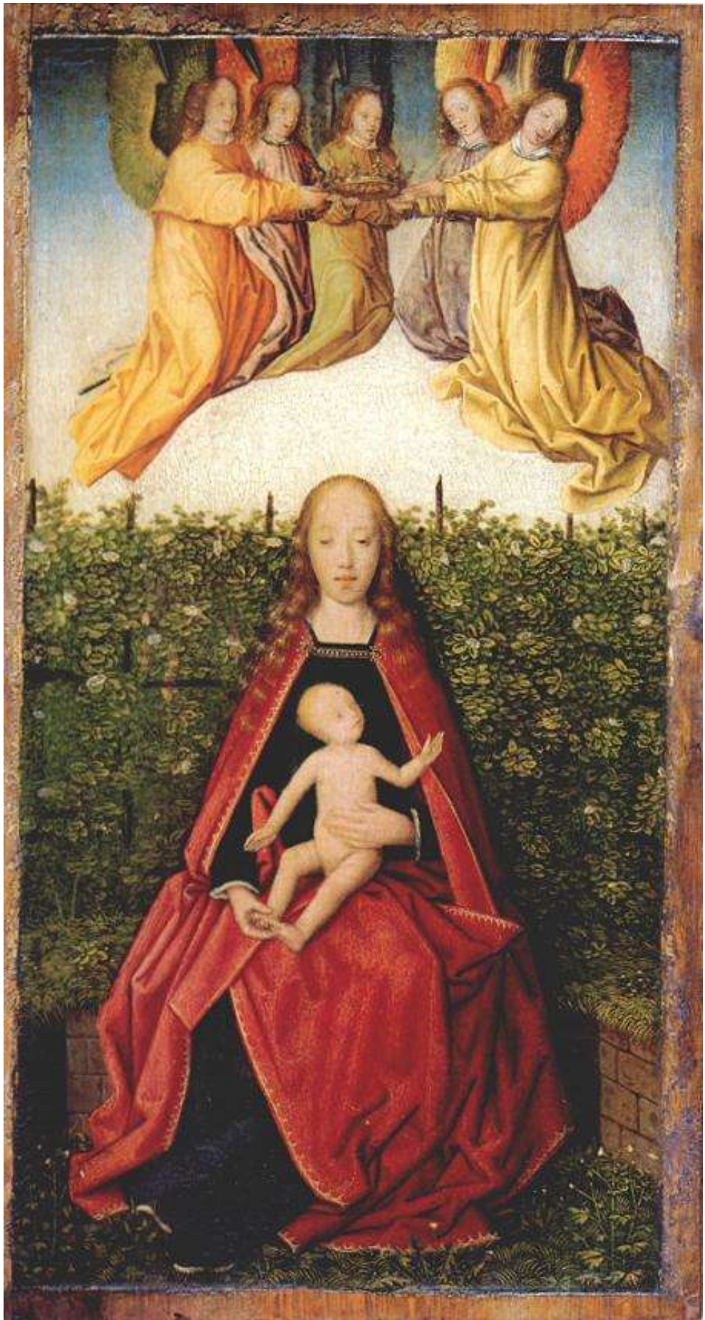
Илл. 112.12. Ян Провост. Мадонна с Младенцем.