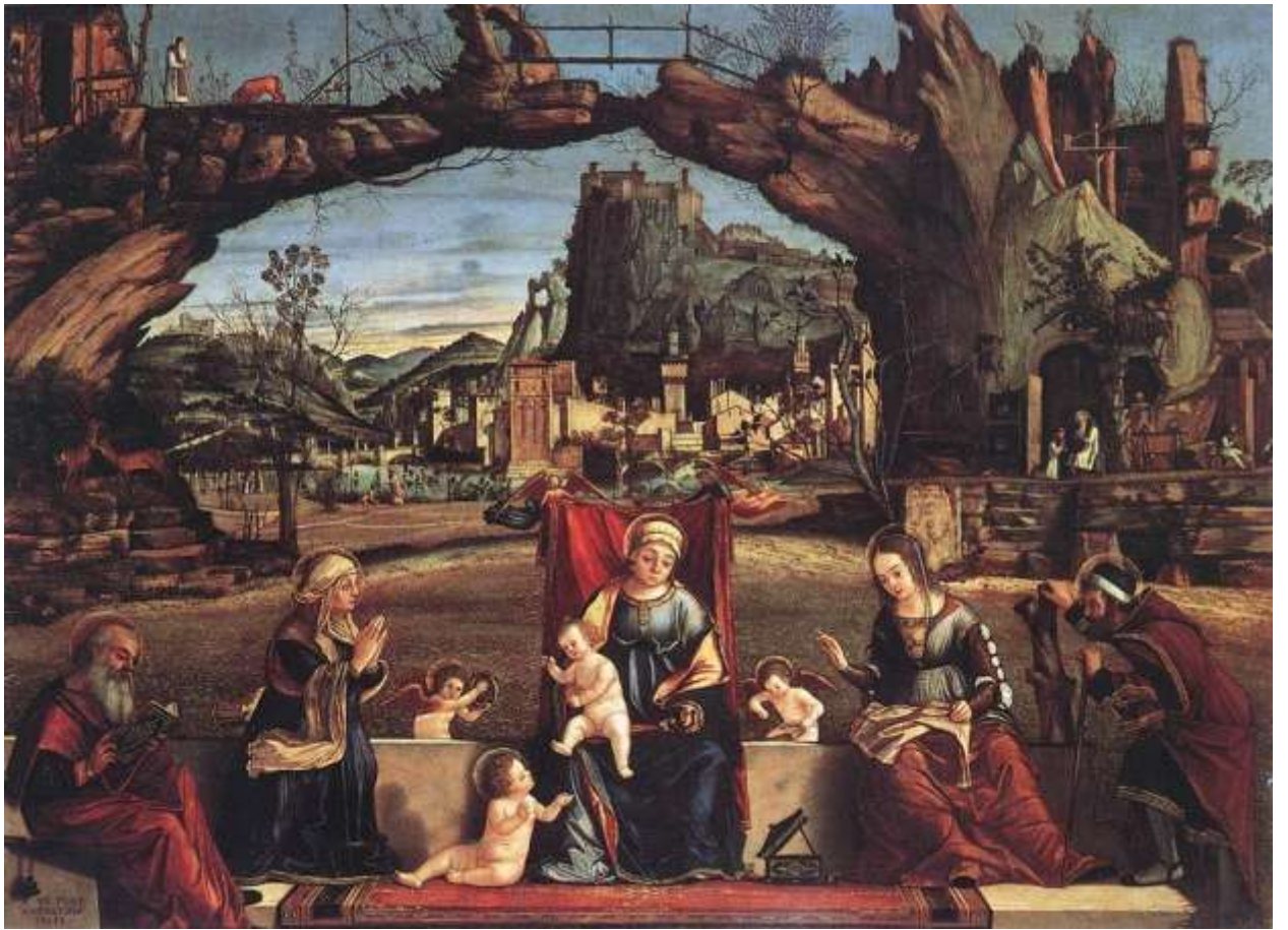
Илл. 112.6. Витторе Карпаччо. Святое собеседование.