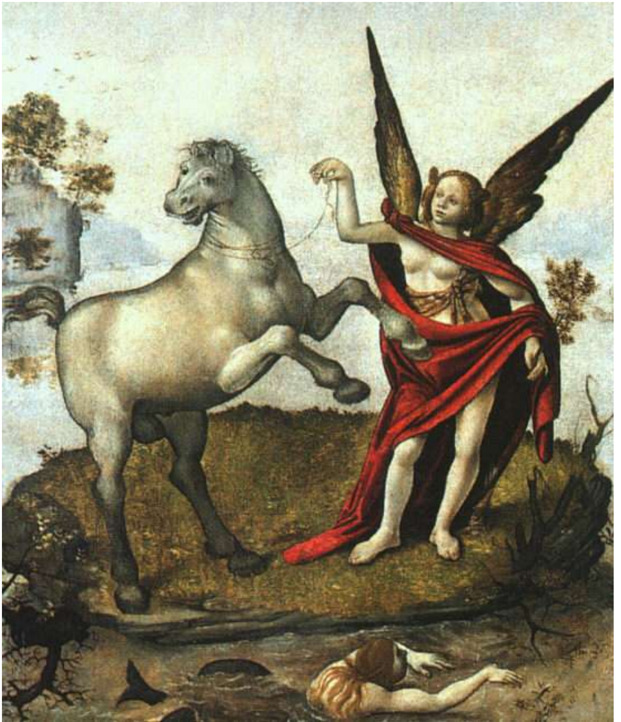
112.15. Пьеро ди Козимо. Аллегория.