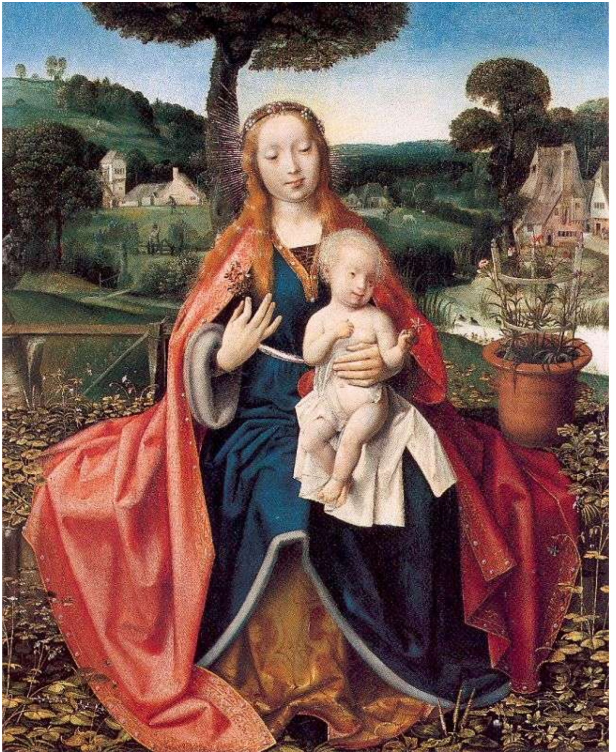
Илл. 112.1. Ян Провост. Мадонна с Младенцем в пейзаже.