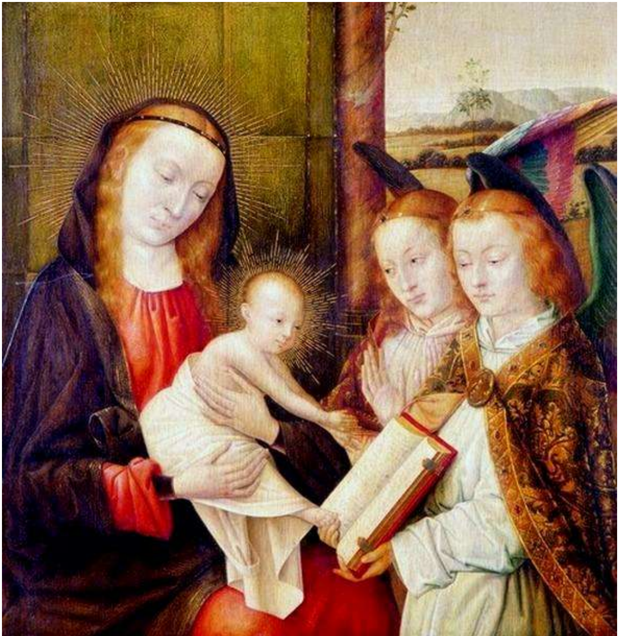
Илл. 112.11. Ян Провост. Мадонна с Младенцем и двумя ангелами.