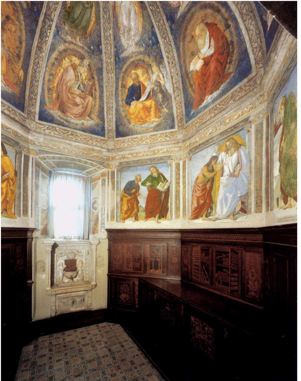
Илл. 104.22. Базилика Санта-Каза в Лорето.