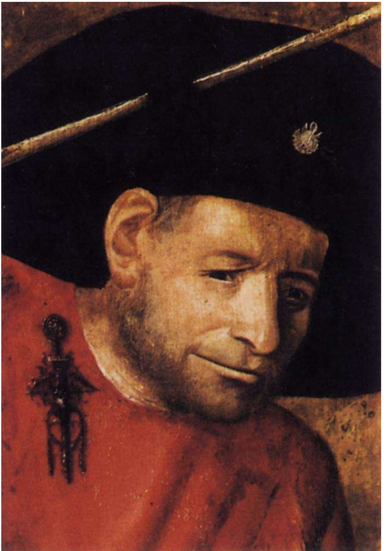
Илл. 104.34. Иероним Босх. Голова алебардщика.