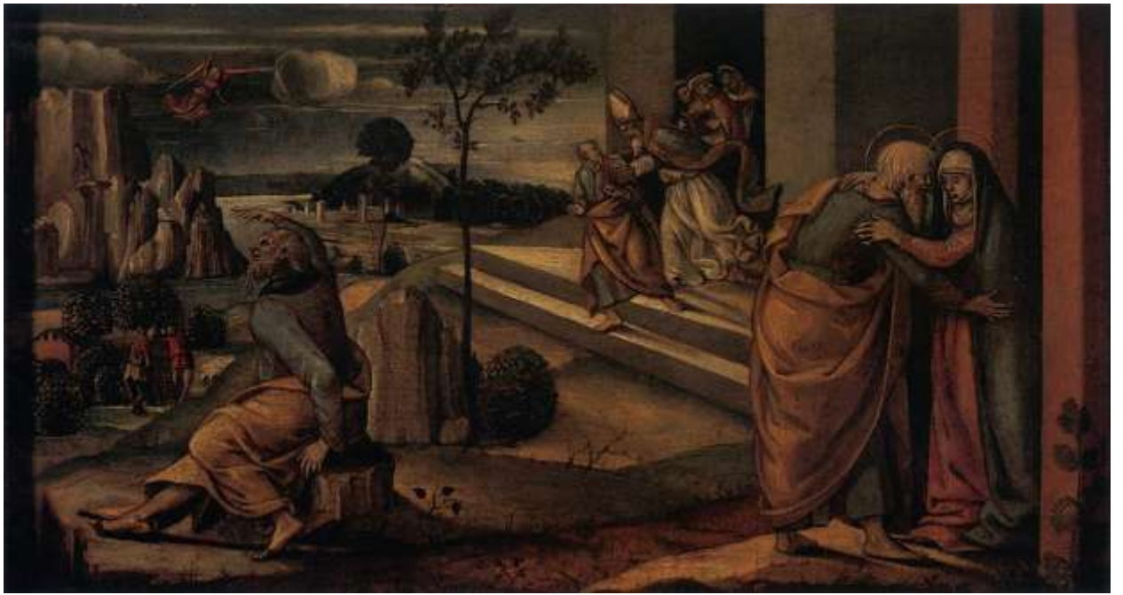
Илл. 104.29. Лука Синьорелли. Сцены из жизни Иоакима и Анны.