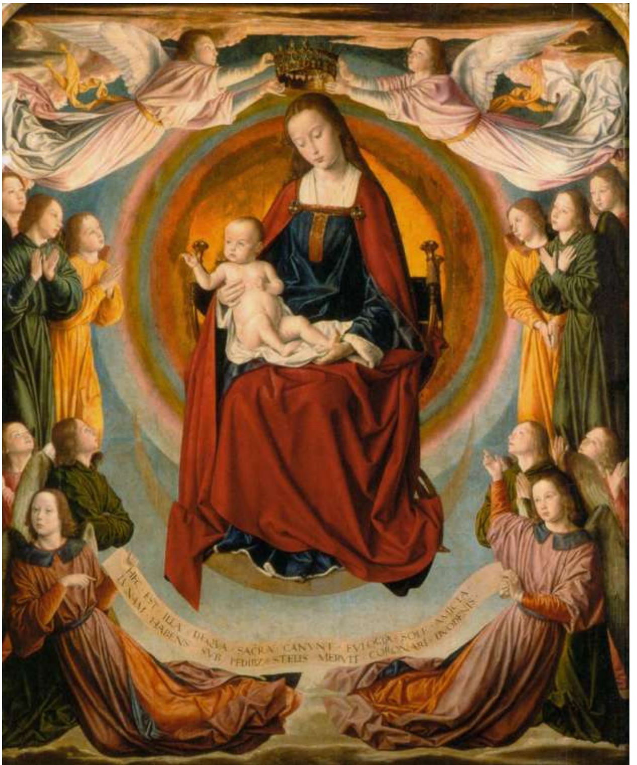
Илл. 104.2. Жан Хей. Мадонна с Младенцем во славе в окружении ангелов.