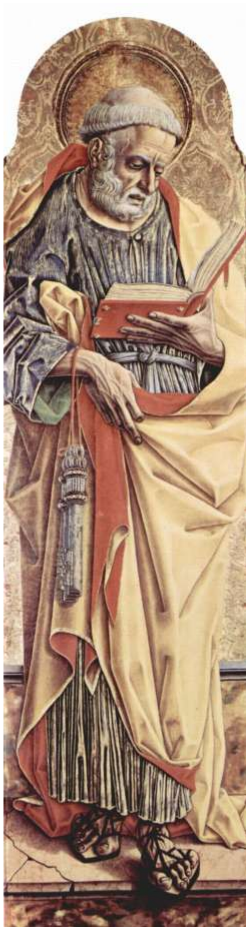
Илл. 104.16. Карло Кривелли. Апостол Петр.