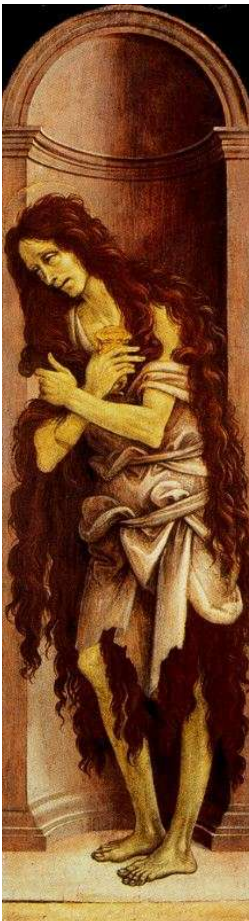
Илл. 104.26. Филиппино Липпи. Мария Магдалина.