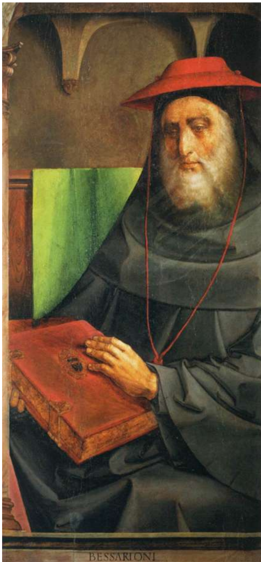
Илл. 104.33. Йос ван Гент. Кардинал Виссарион.