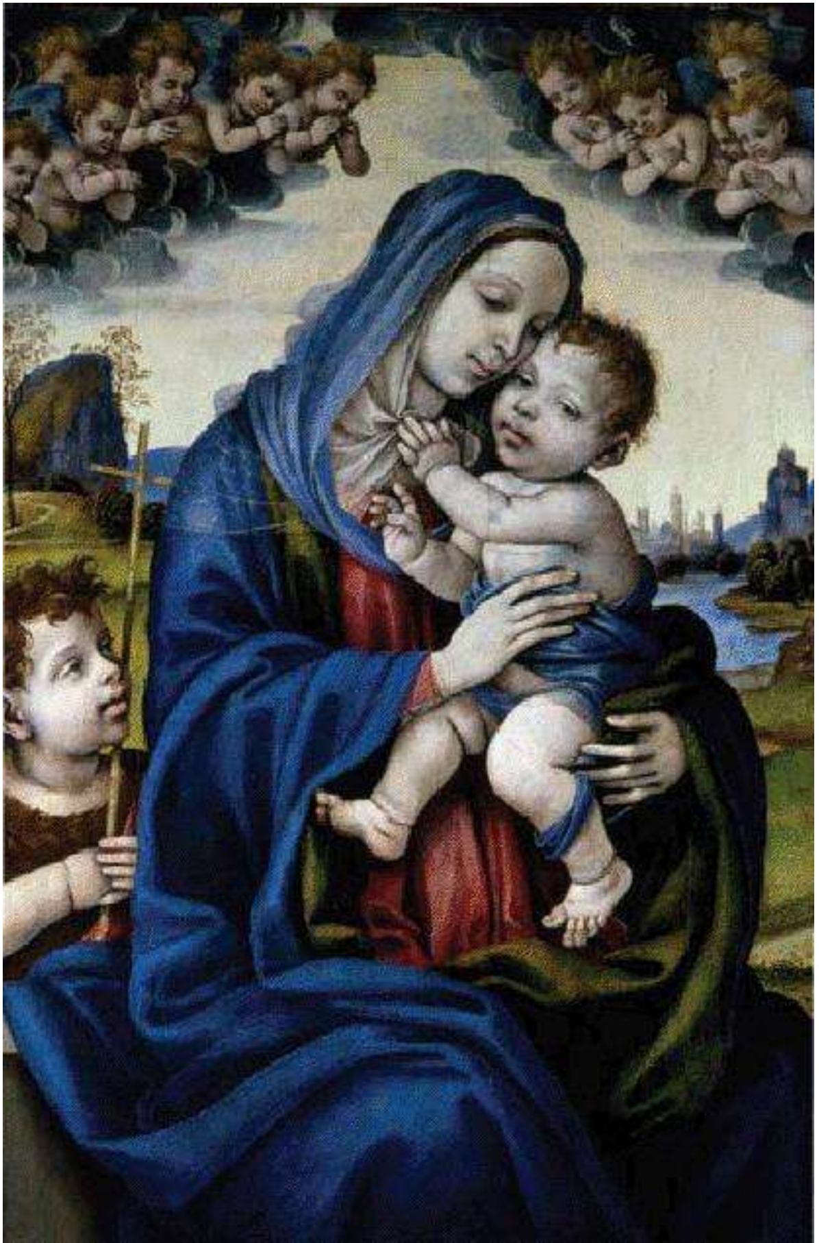
Илл. 104.10. Филиппино Липпи. Мадонна с Младенцем и юным Иоанном Крестителем.