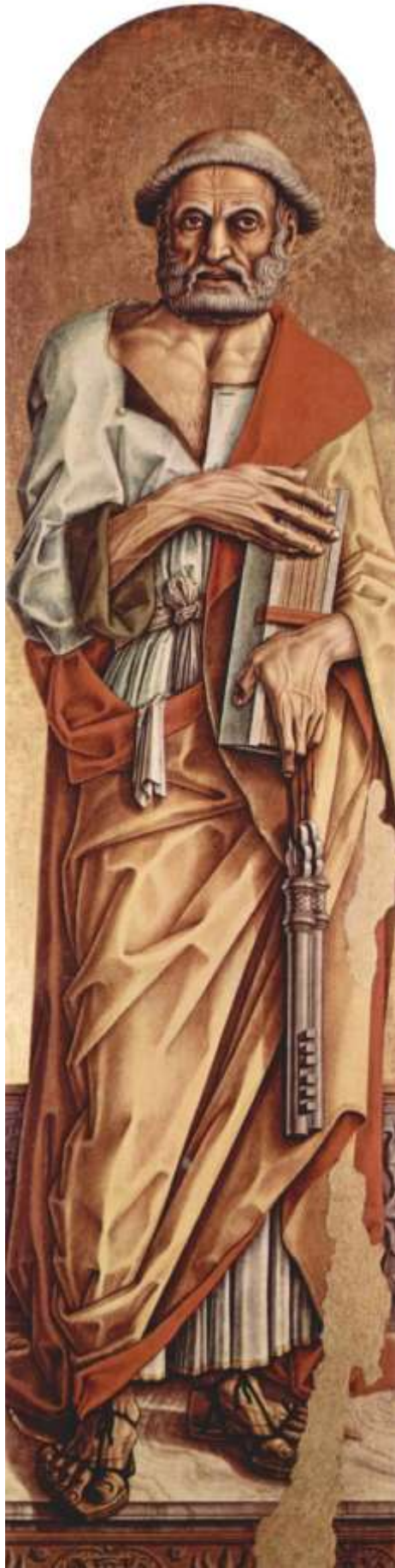
Илл. 104.15. Карло Кривелли. Апостол Петр.