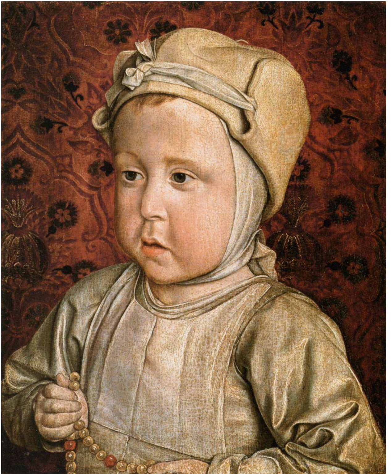
Илл. 104.39. Жан Хей. Портрет дофина Карла Орлеанского.