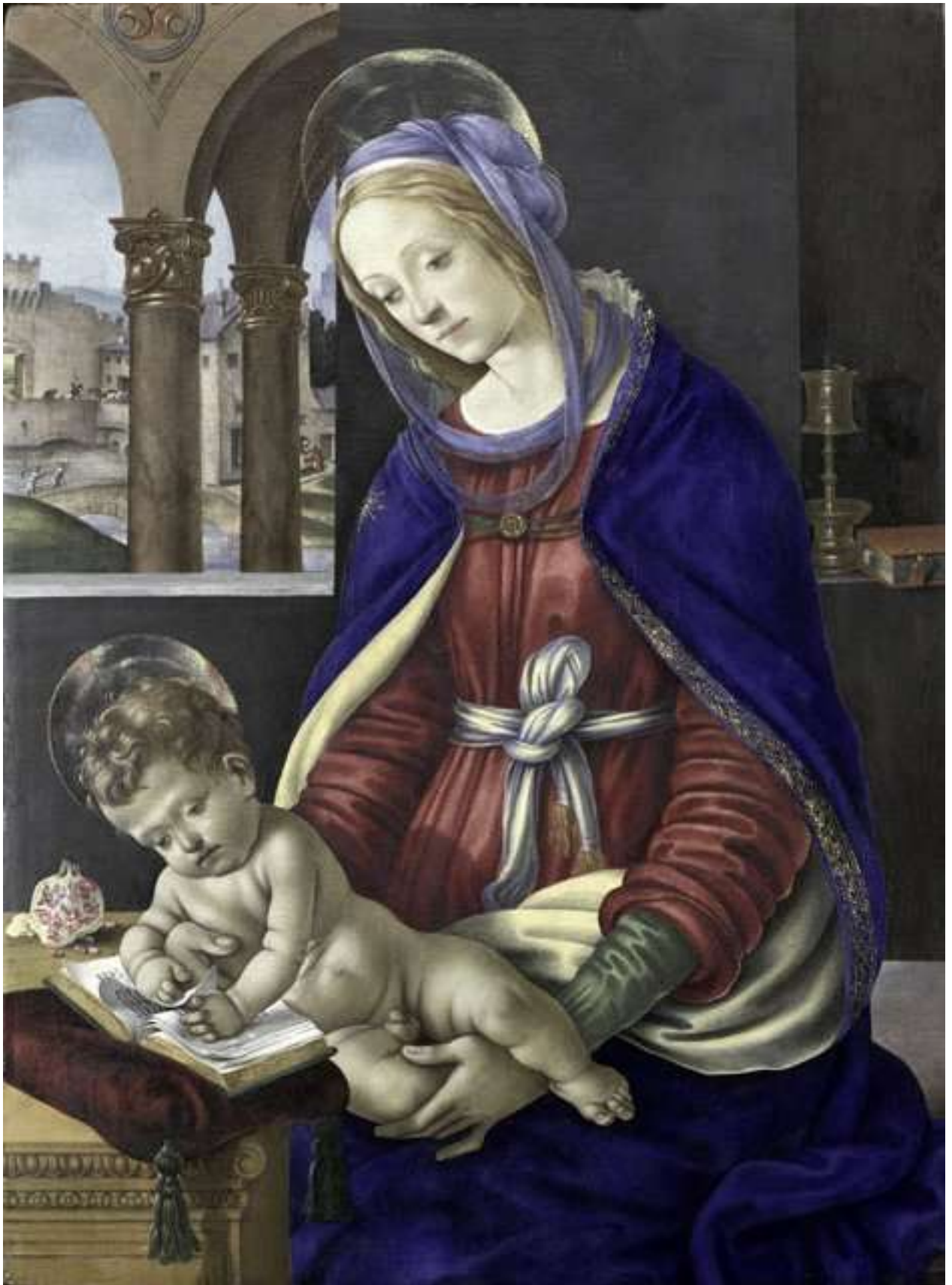
Илл. 104.4. Филиппино Липпи. Мадонна с Младенцем.