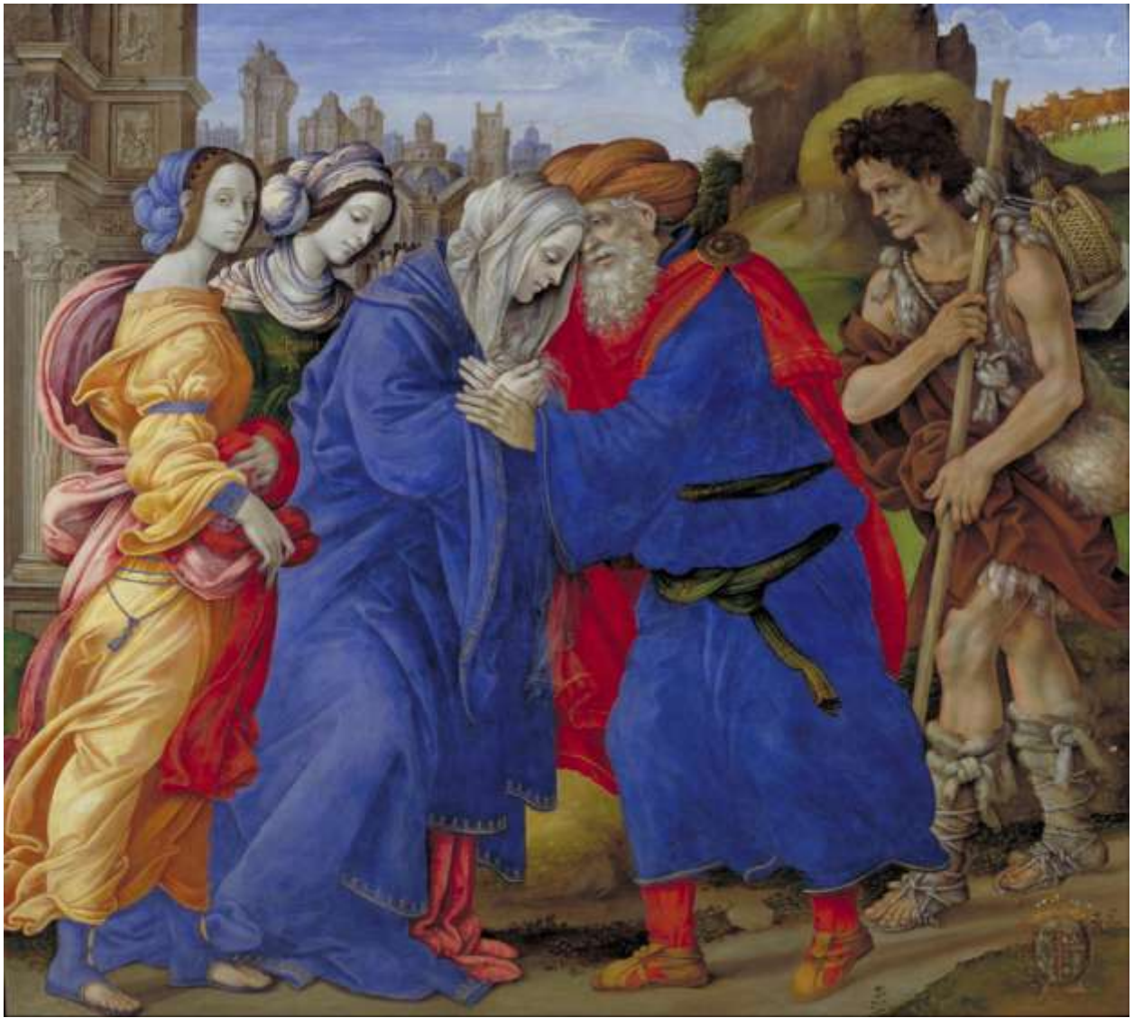
Илл. 104.30. Филиппино Липпи. Встреча у Золотых ворот.