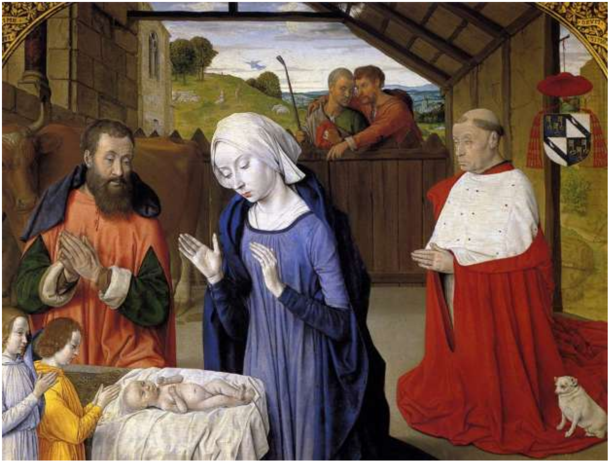
Илл. 104.31. Жан Хей. Рождество.