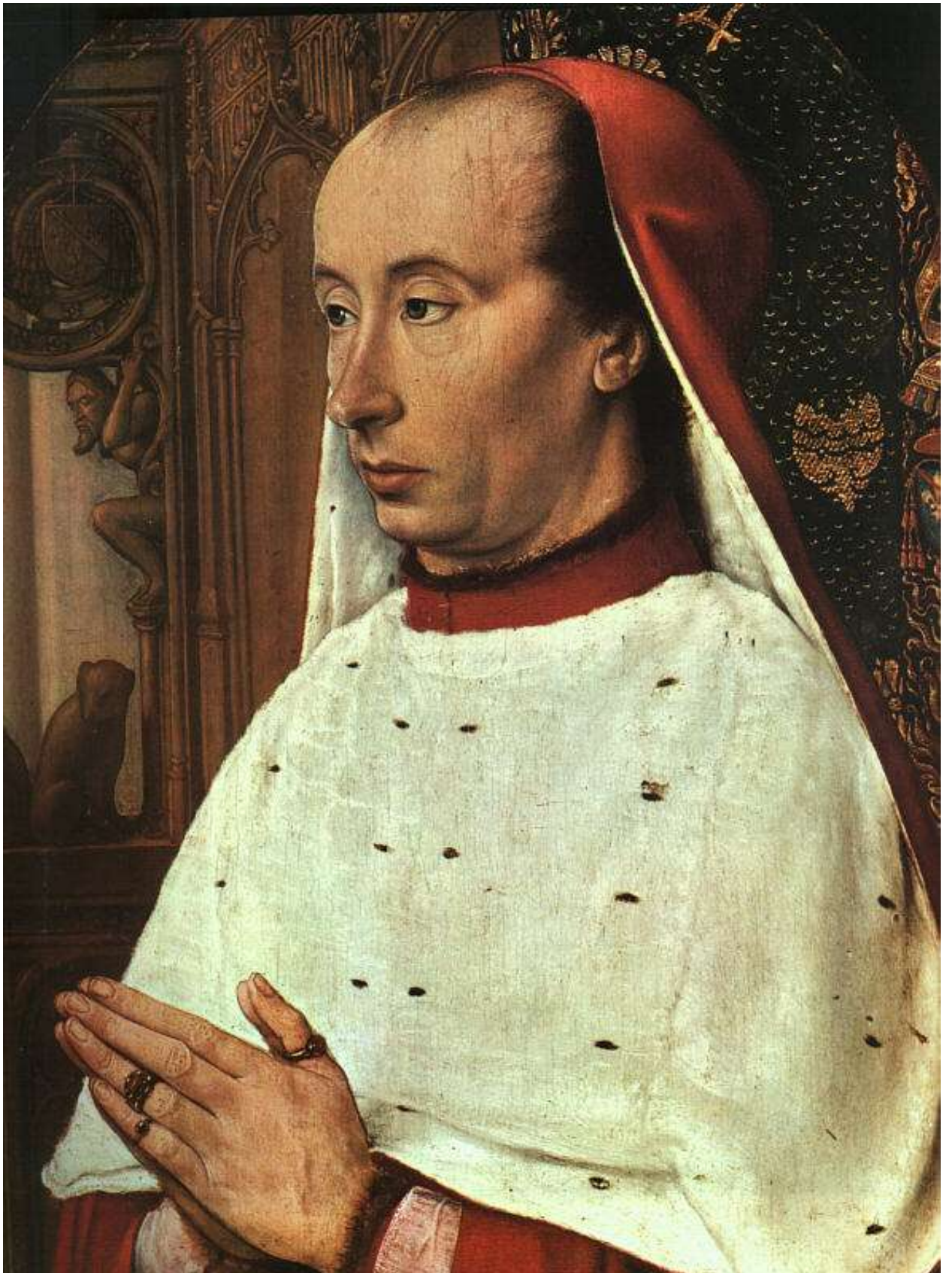
Илл. 104.32. Жан Хей. Карл II Бурбонский.