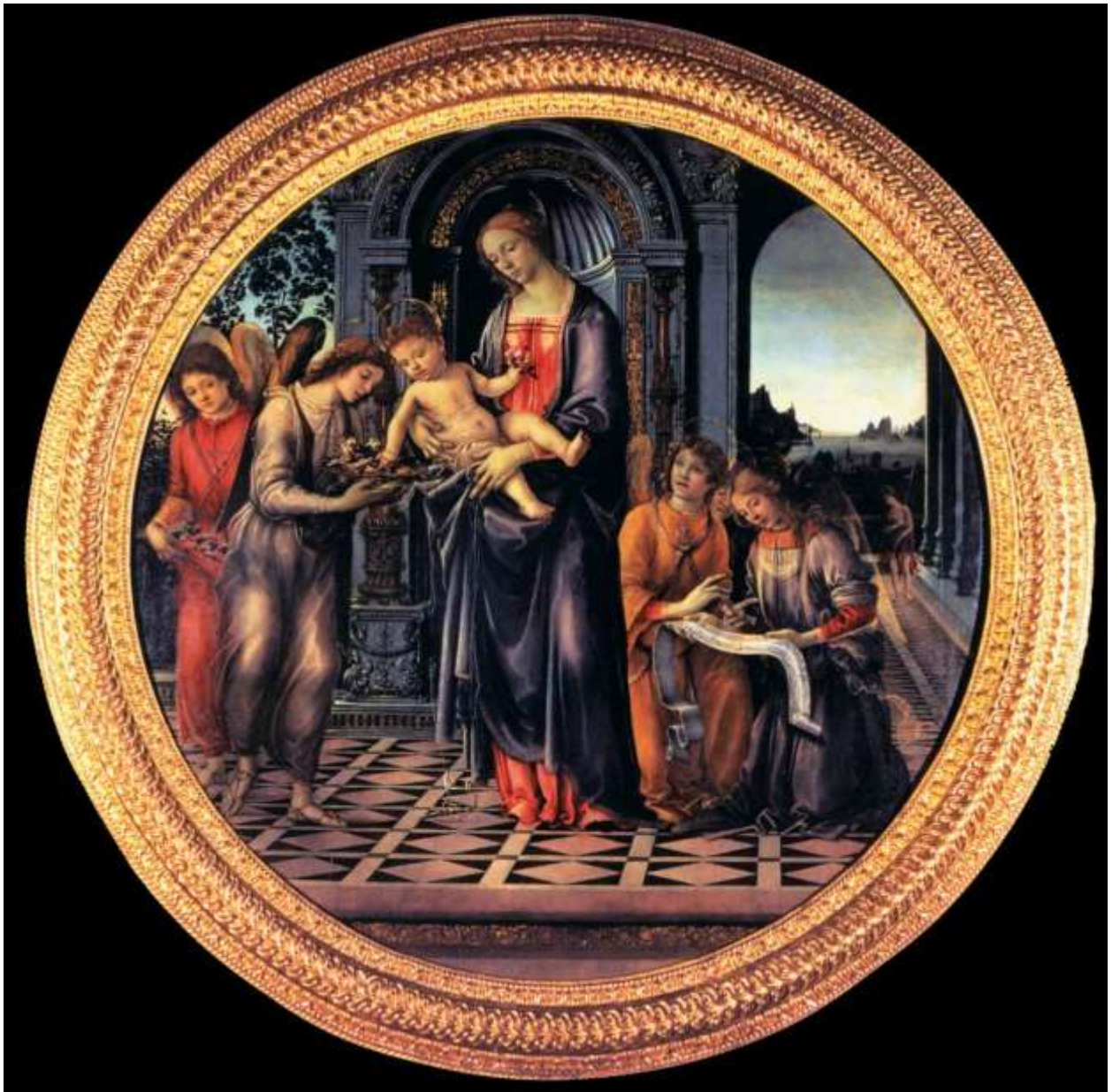
Илл. 104.7. Филиппино Липпи. Мадонна с Младенцем и ангелами.