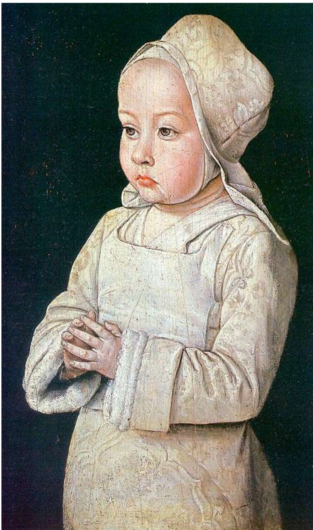
Илл. 104.38. Жан Хей. Сюзанна де Бурбон.