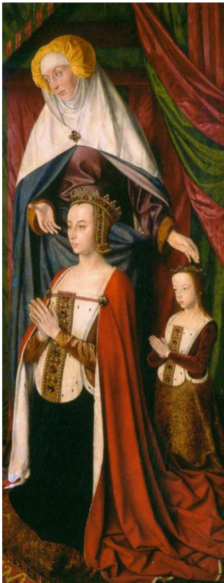
Илл. 104.12. Жан Хей. Анна Французская и ее дочь Сюзанна со св. Анной.