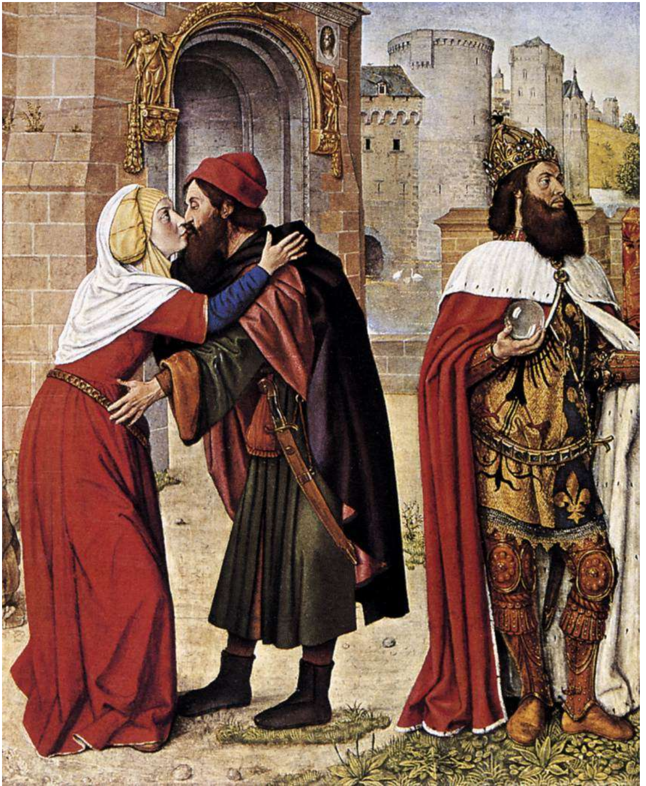
Илл. 104.27. Жан Хей. Встреча у Золотых ворот.