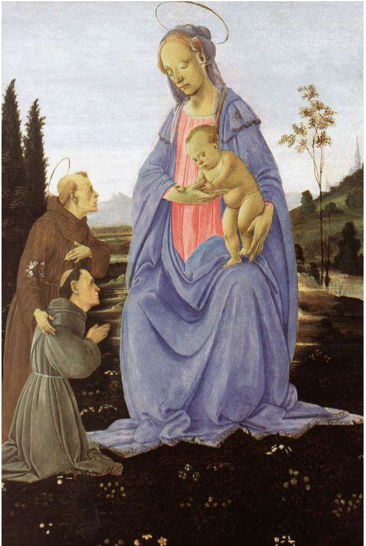
Илл. 104.6. Филиппино Липпи. Мадонна с Младенцем, Антонием Падуанским и монахом.