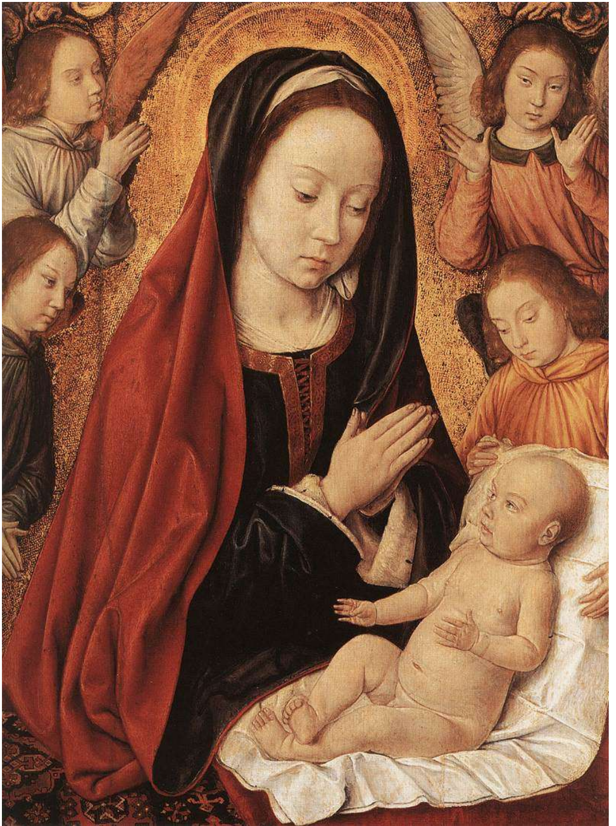
Илл. 104.11. Жан Хей. Мадонна с Младенцем и поклоняющимися ангелами.