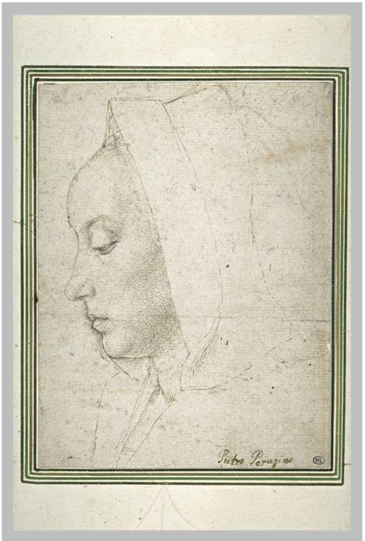
Илл. 104.1. Жан Хей. Профильный портрет женщины. Рисунок.