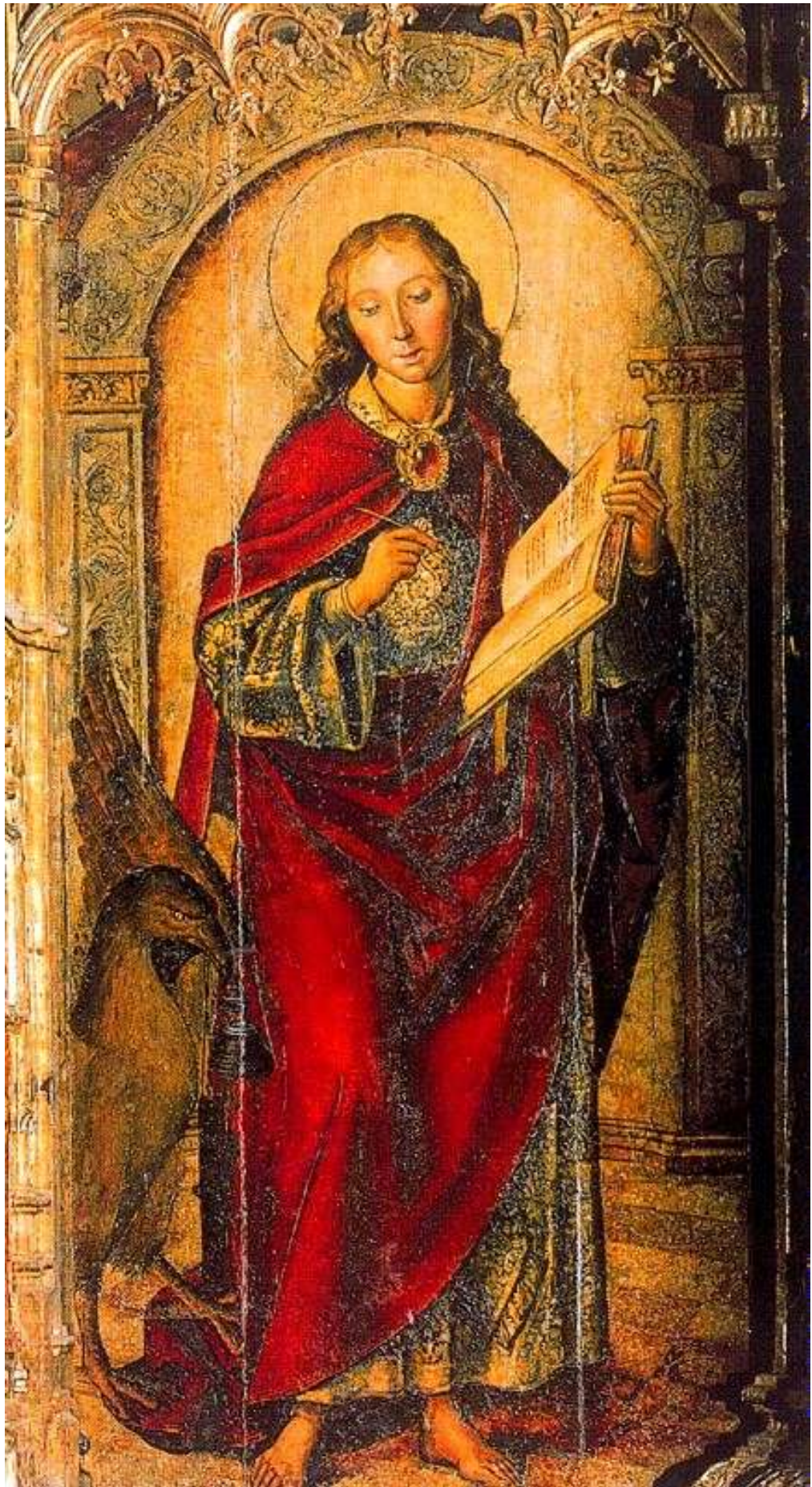
Илл. 104.24. Педро Берругете. Иоанн Евангелист.