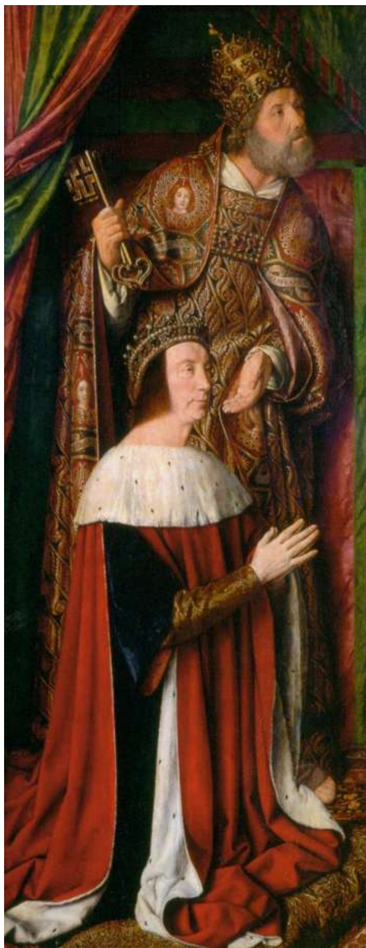
Илл. 104.13. Жан Хей. Пьер II, герцог Бурбонский, с апостолом Петром.