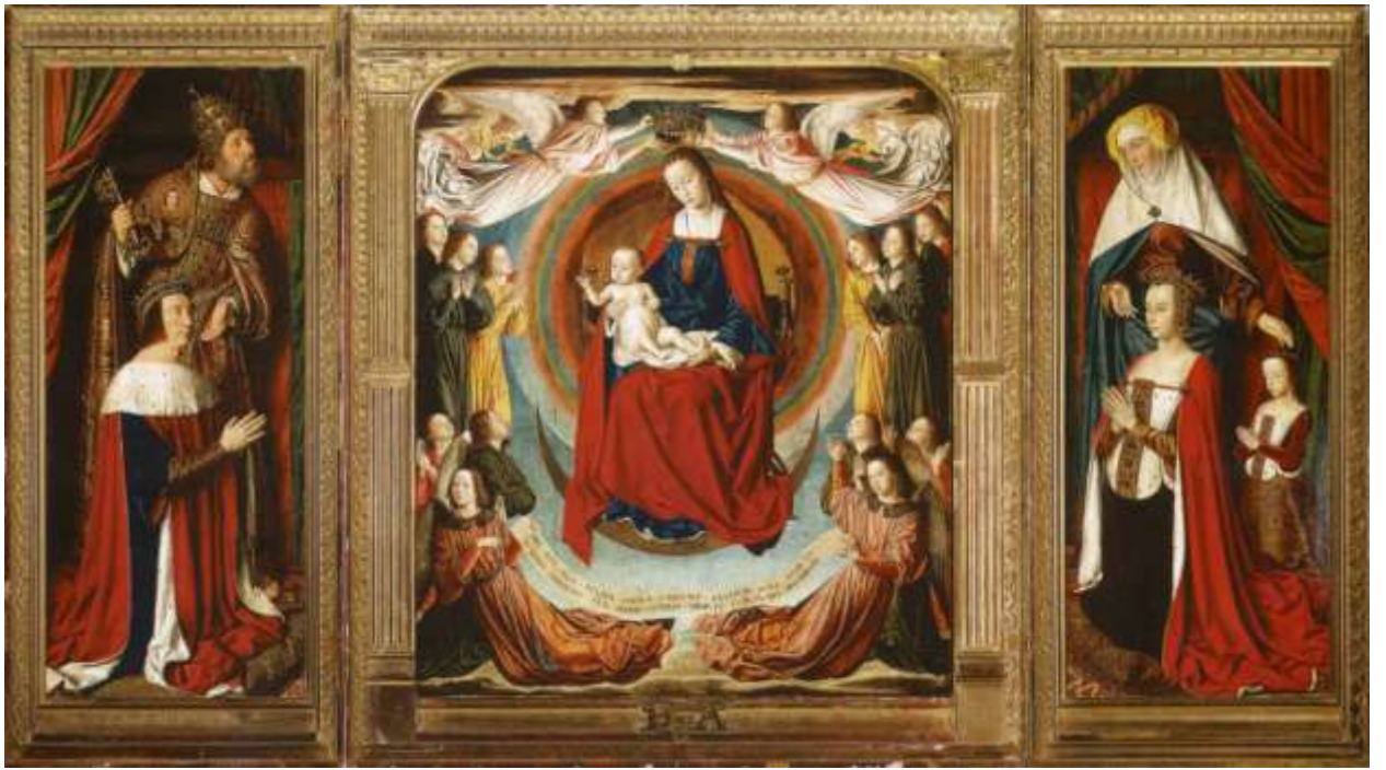
Илл. 104.3. Жан Хей. Триптих из Мулена.