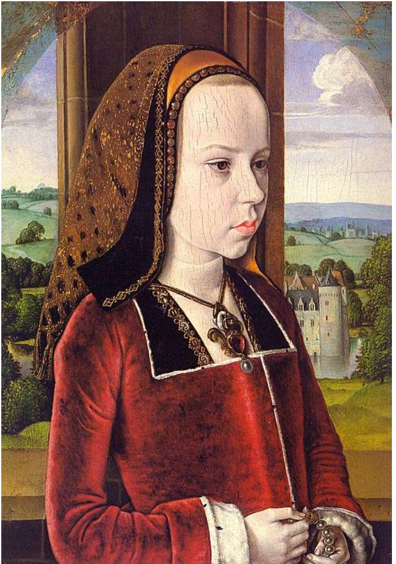
Илл. 104.36. Жан Хей. Портрет Маргариты Австрийской.