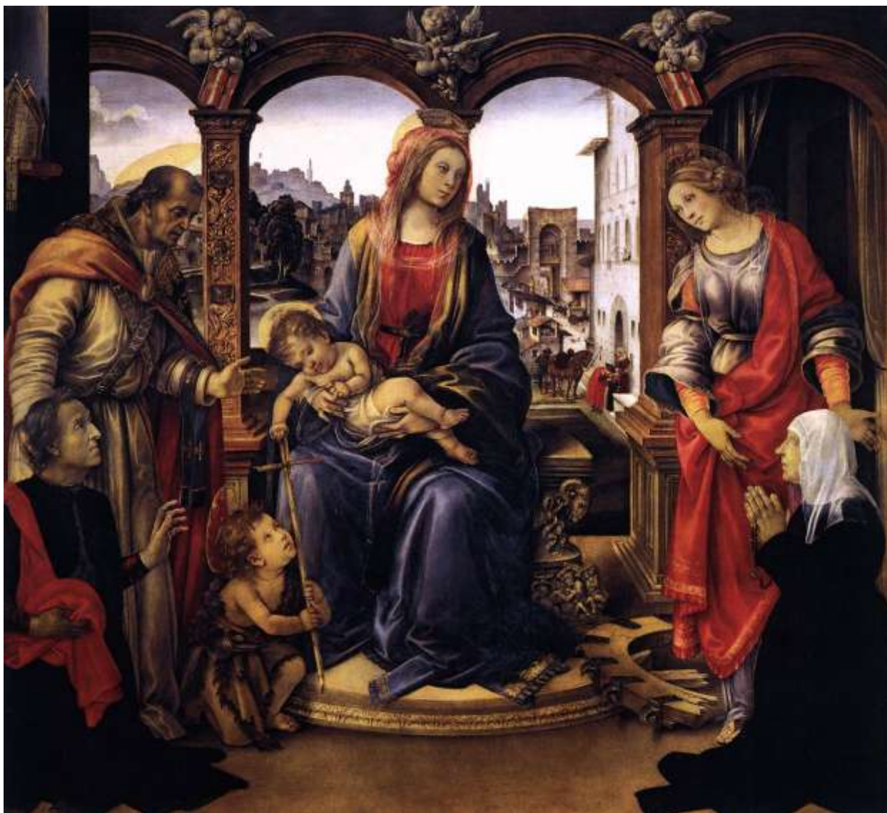
Илл. 104.8. Филиппино Липпи. Мадонна с Младенцем и святыми.