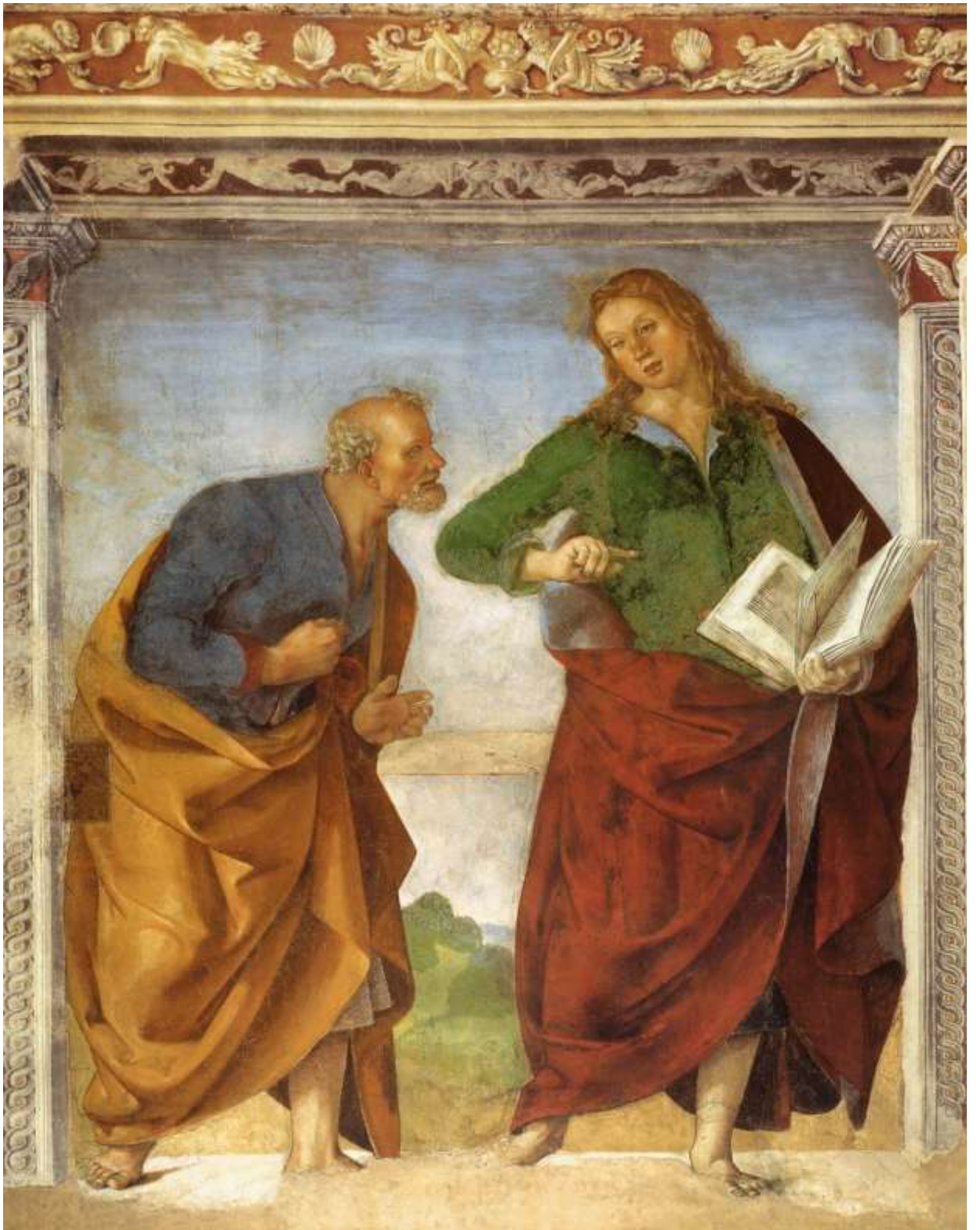
Илл. 104.21. Лука Синьорелли. Апостолы Петр и Иоанн Евангелист.