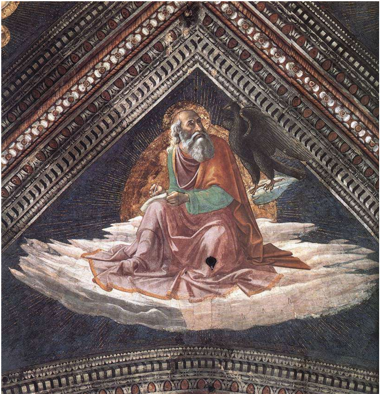
Илл. 104.23. Доменико Гирландайо. Иоанн Евангелист.