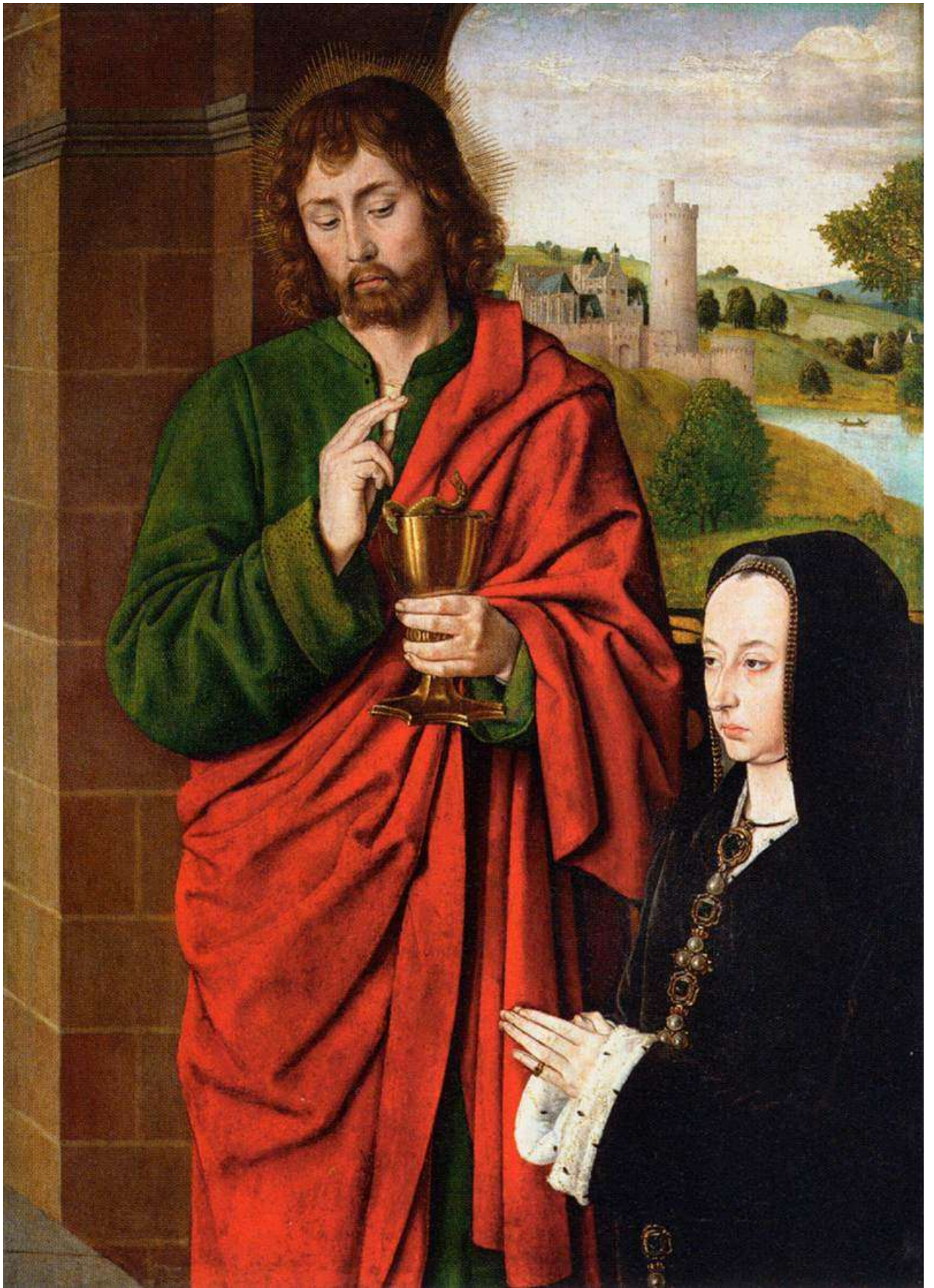
Илл. 104.20. Жан Хей. Анна Французская с апостолом Иоанном.