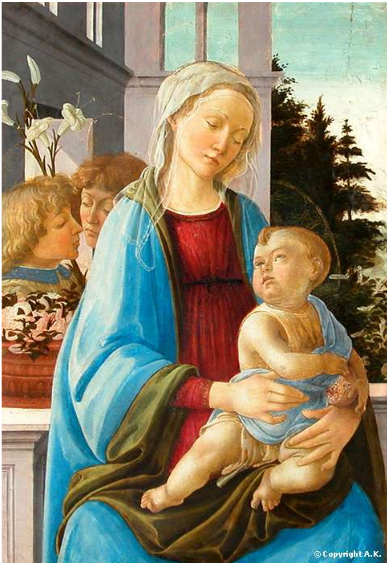
Илл. 104.5. Филиппино Липпи. Мадонна с Младенцем.