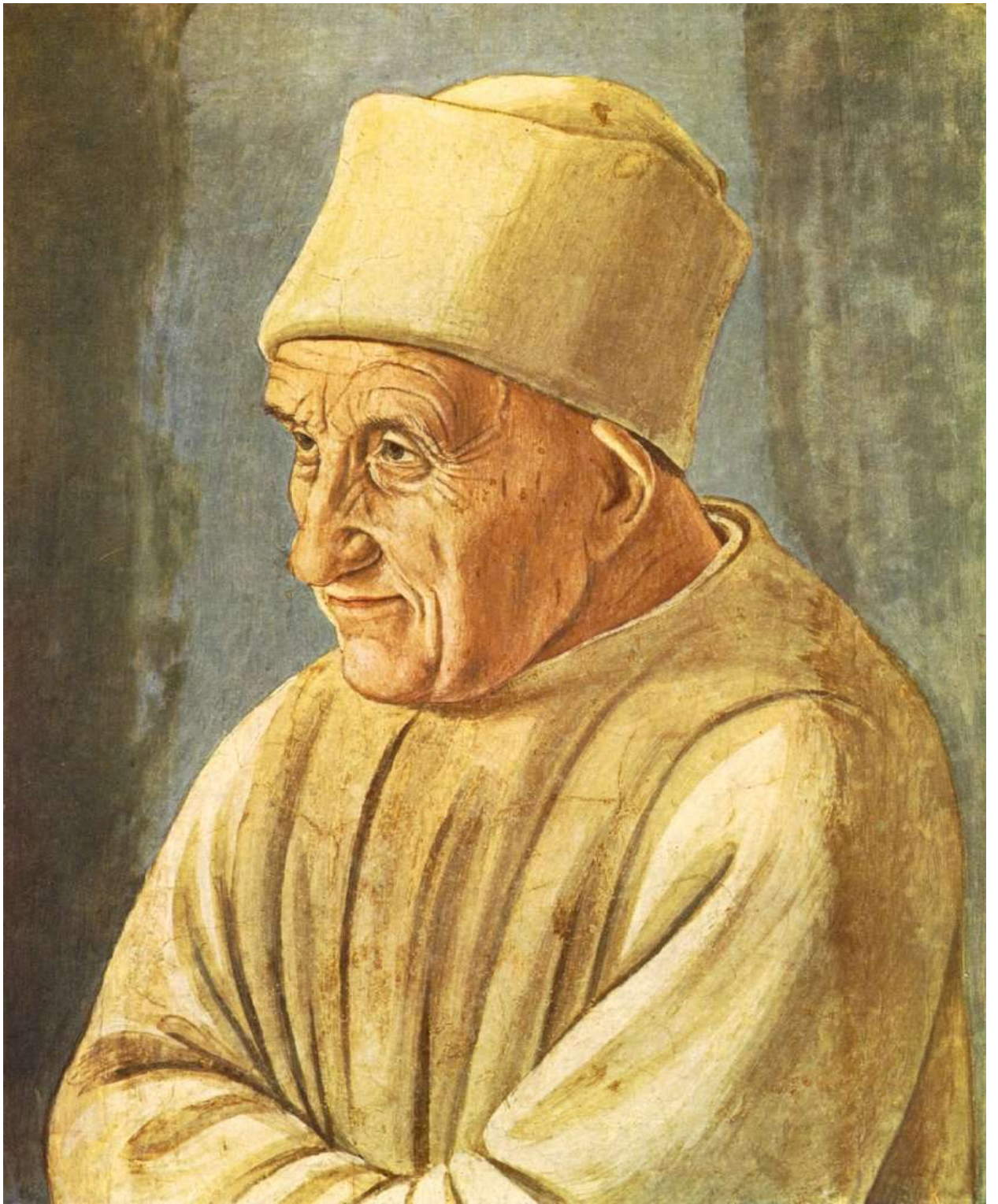
Илл. 104.35. Филиппино Липпи. Портрет старика.