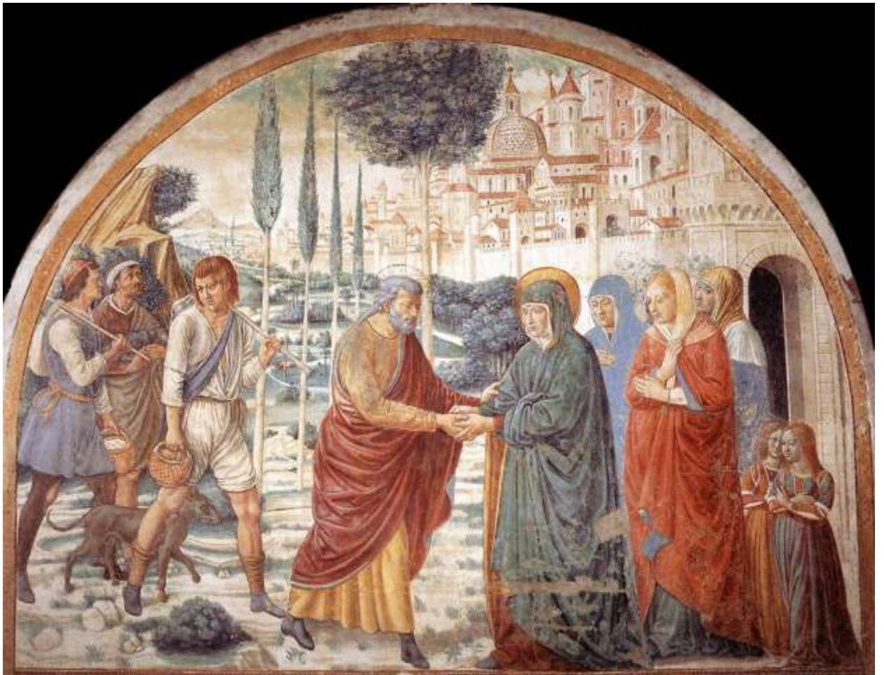
Илл. 104.28. Беноццо Гоццоли. Встреча у Золотых ворот.