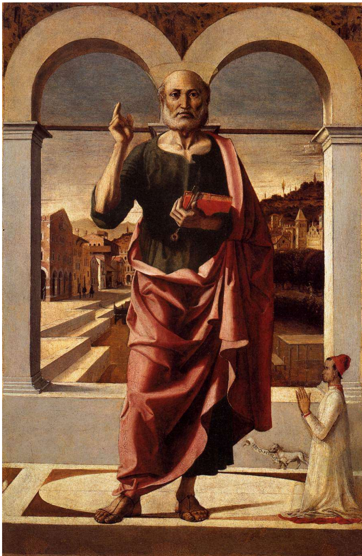
Илл. 104.19. Монтанья. Благословляющий апостол Петр с донатором.