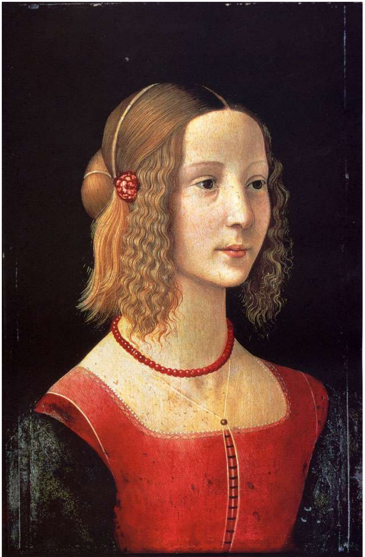
Илл. 104.37. Доменико Гирландайо. Портрет девочки.