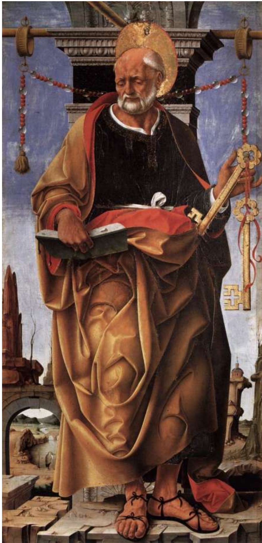
Илл. 104.17. Франческо дель Косса. Апостол Петр.