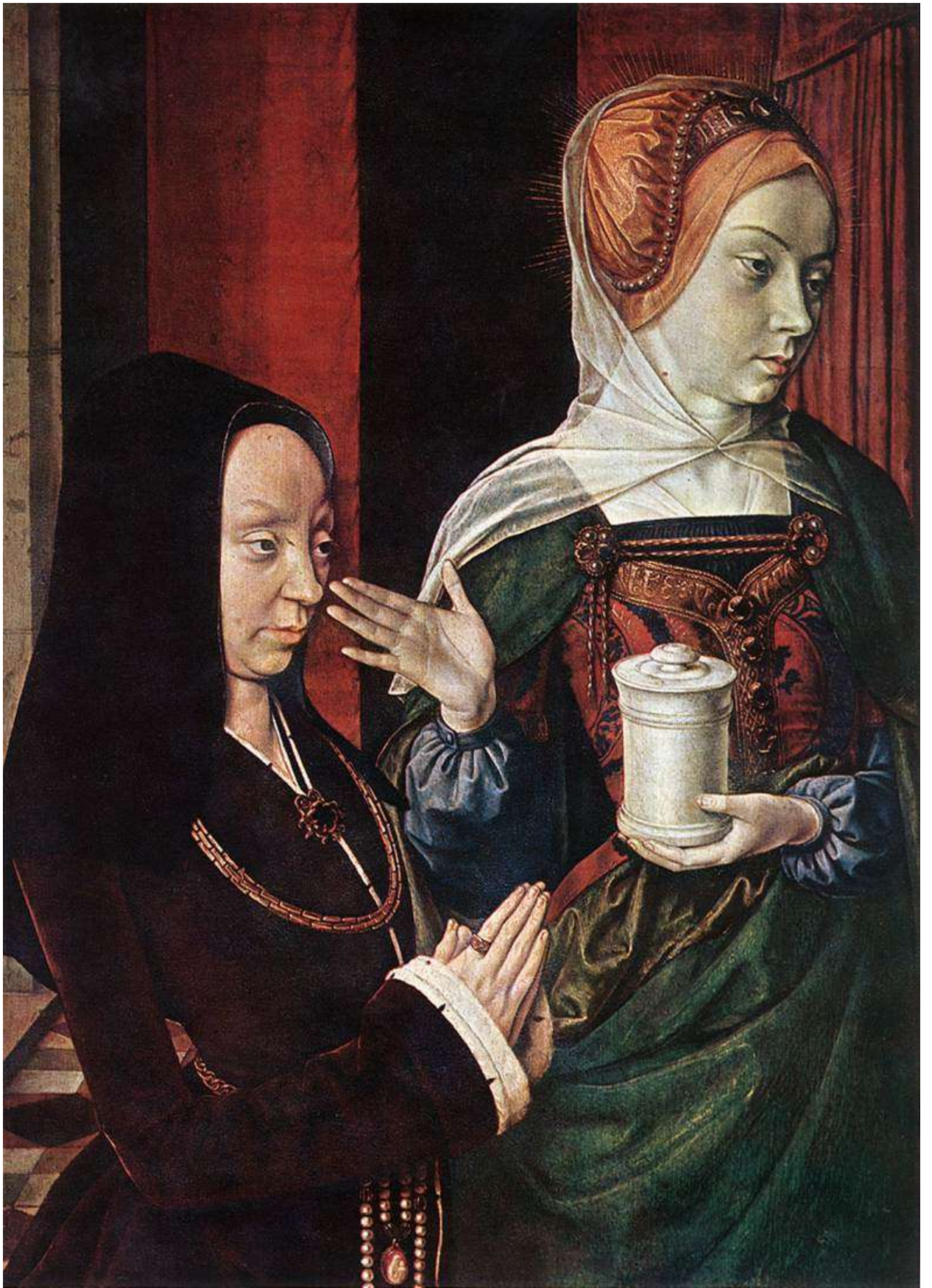
Илл. 104.25. Жан Хей. Мадлен Бургундская с Марией Магдалиной.