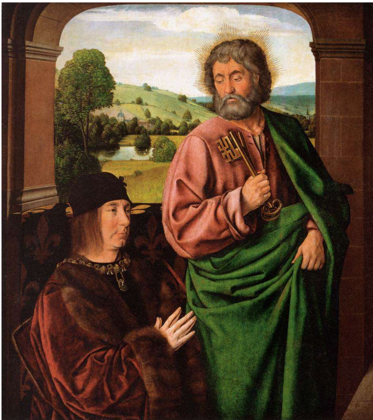
Илл. 104.14. Жан Хей. Пьер II, герцог Бурбонский, с апостолом Петром.