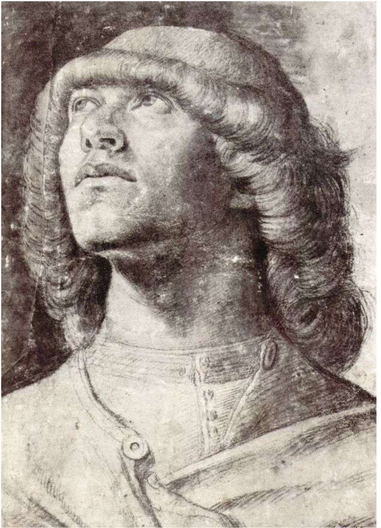
Илл. 87.2. Альвизе Виварини. Портрет мужчины в плоской шапке.