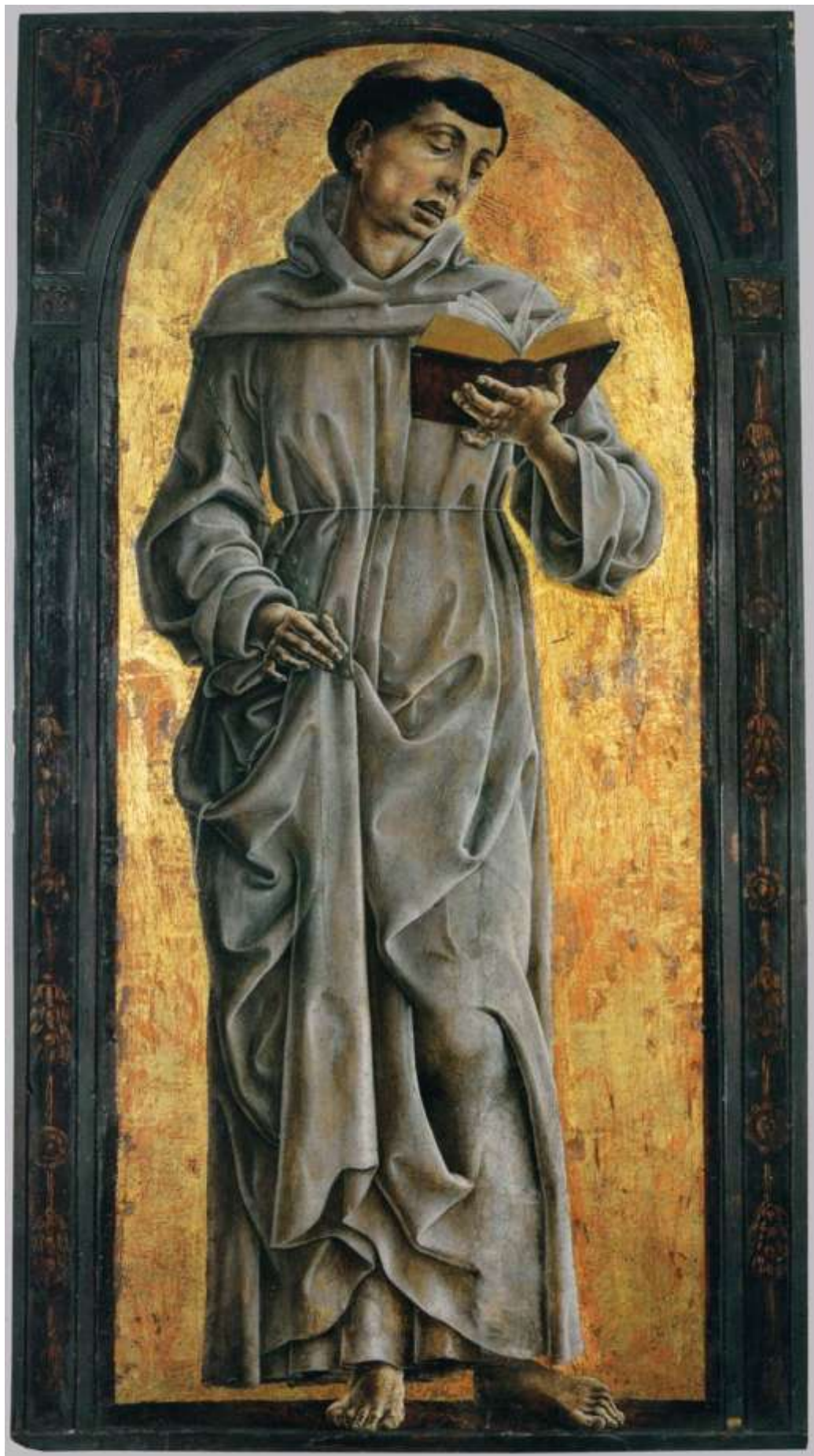
Илл. 87.6. Козимо Тура. Св. Антоний Падуанский, читающий.