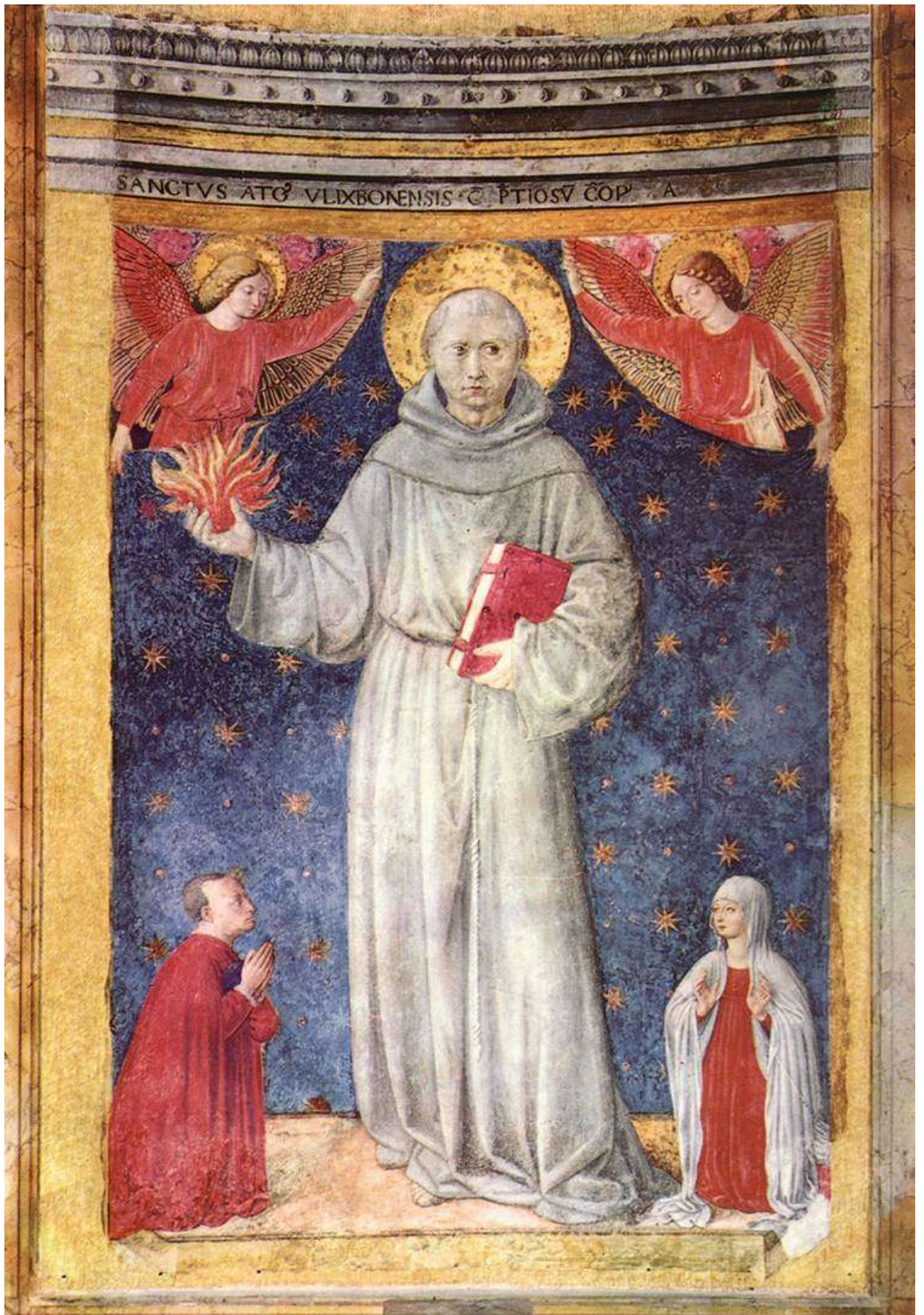
Илл. 87.4. Беноццо Гоццолли. Св. Антоний Падуанский.