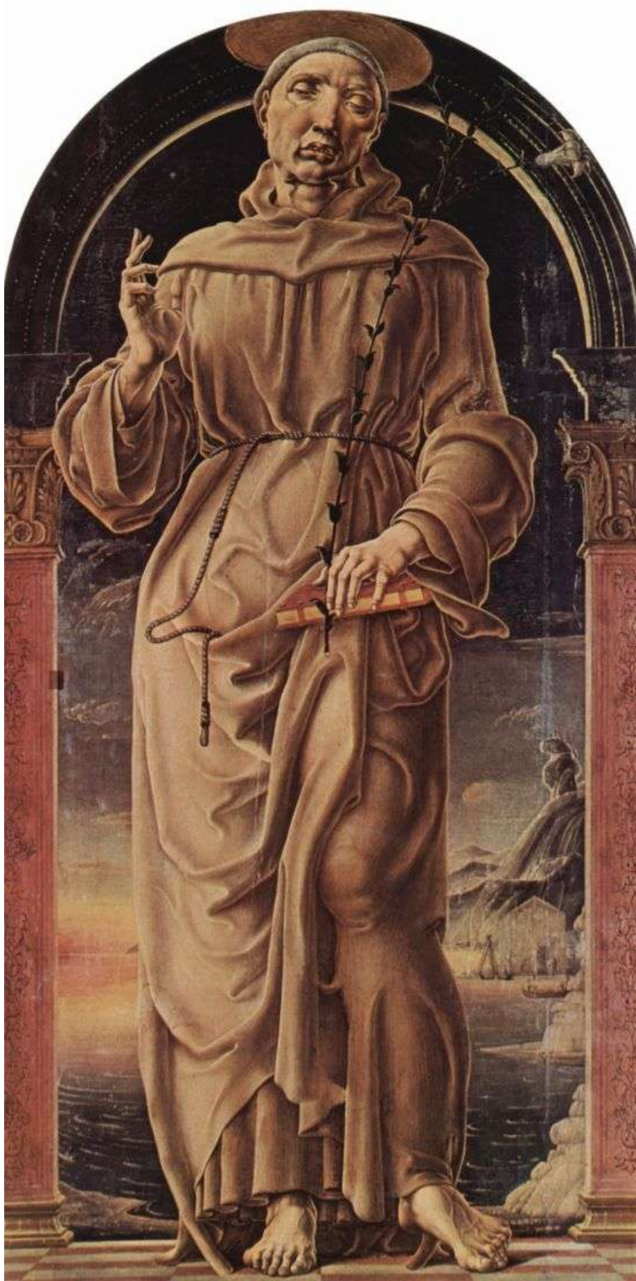
Илл. 87.5. Козимо Тура. Св. Антоний Падуанский.