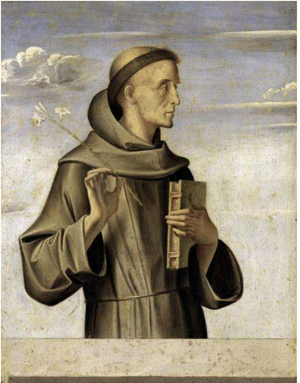
Илл. 87.3. Альвизе Виварини. Св. Антоний Падуанский.