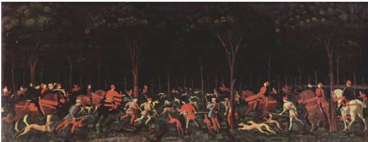
Илл. 78.6. Паоло Уччелло. Охота в лесу.