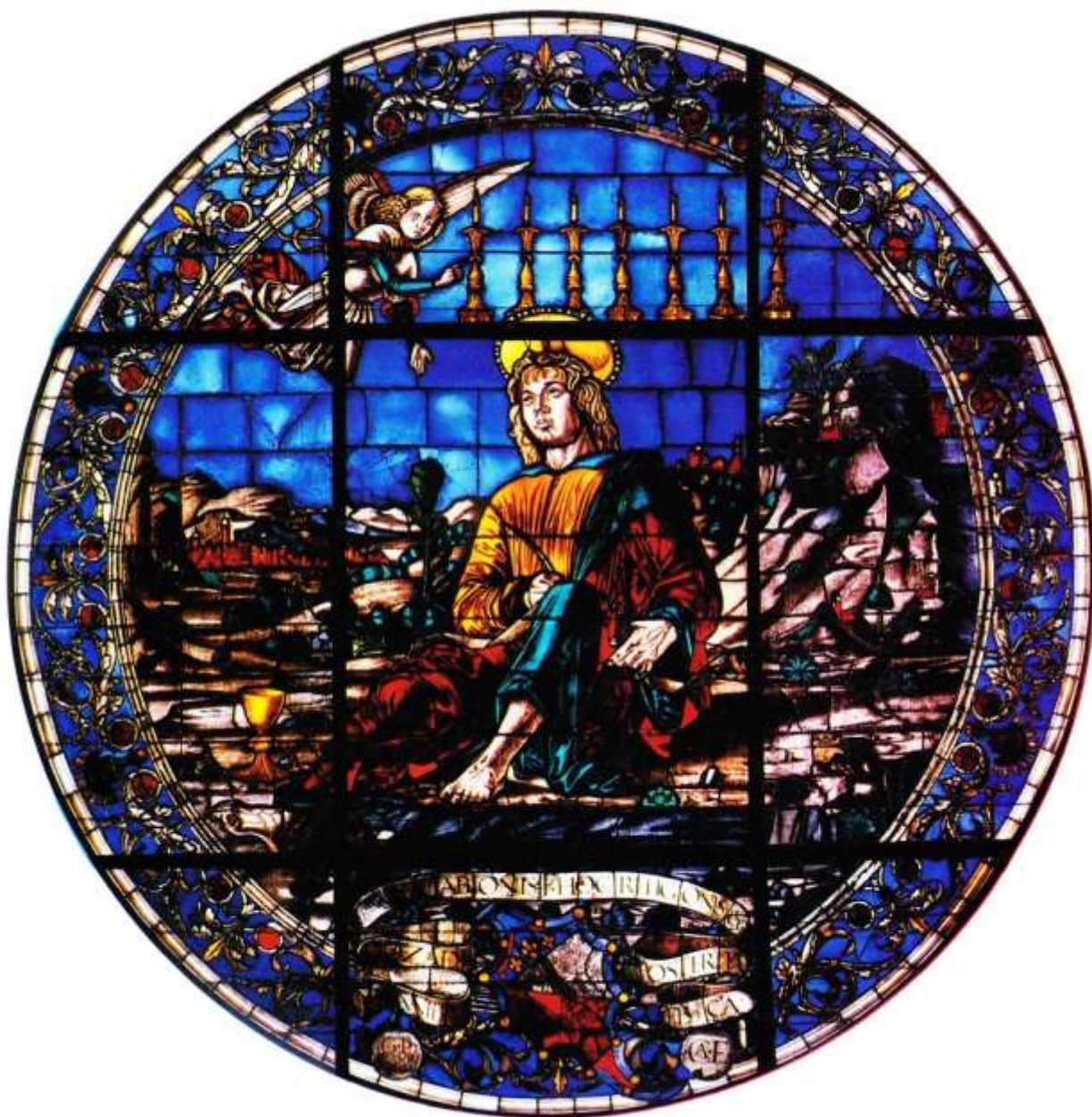
Илл. 78.2. Франческо дель Косса. Витраж Св. Иоанн на Патмосе.