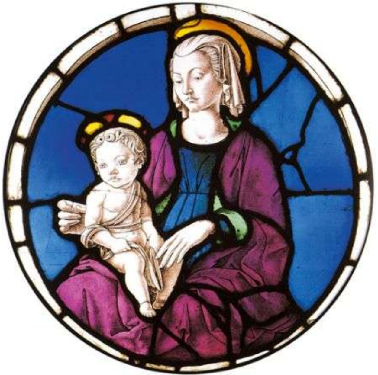
Илл. 78.1. Франческо дель Косса. Витраж Мадонна с Младенцем.