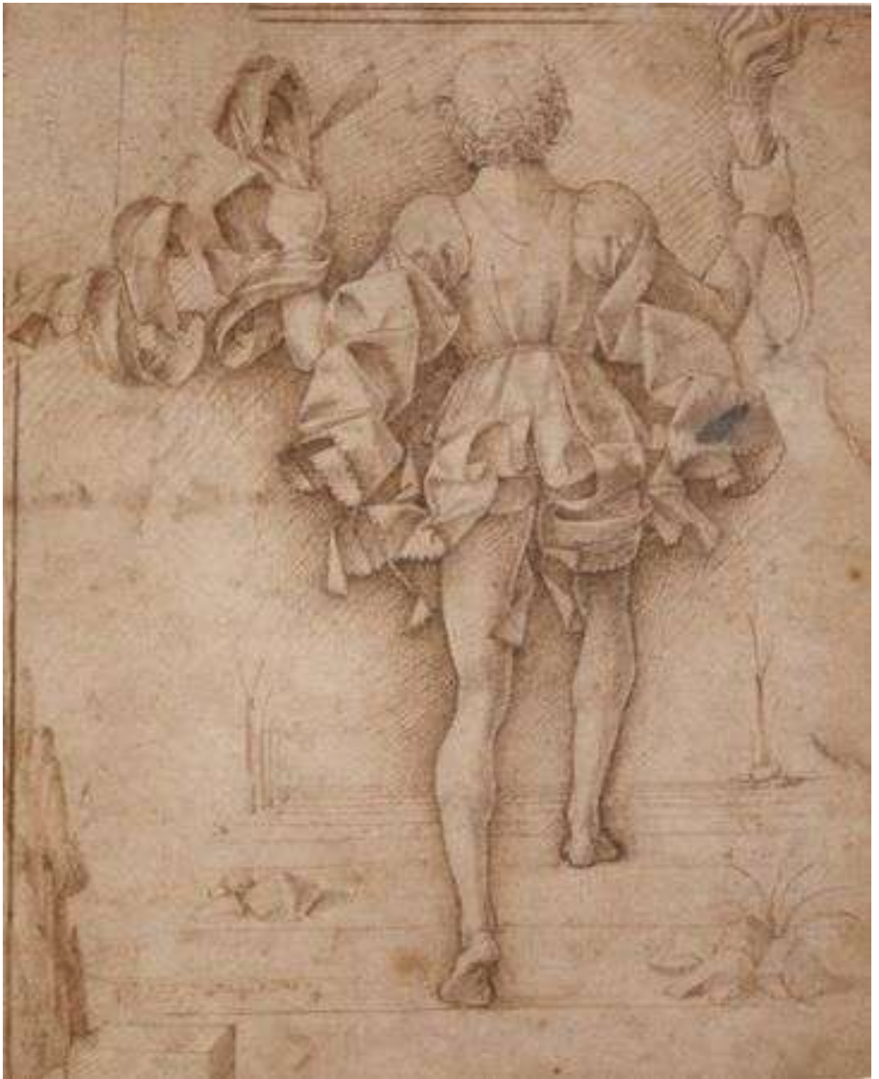
Илл. 78.3. Франческо дель Косса. Рисунок фигуры юноши.