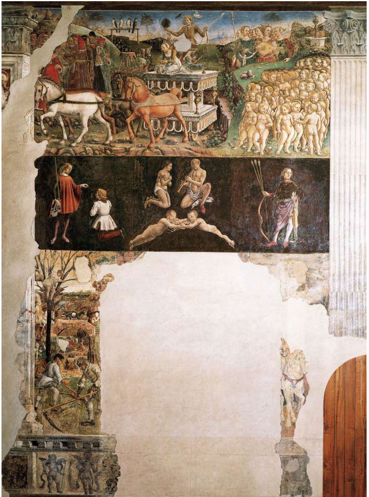
Илл. 78.8. Франческо дель Косса. Аллегория мая.