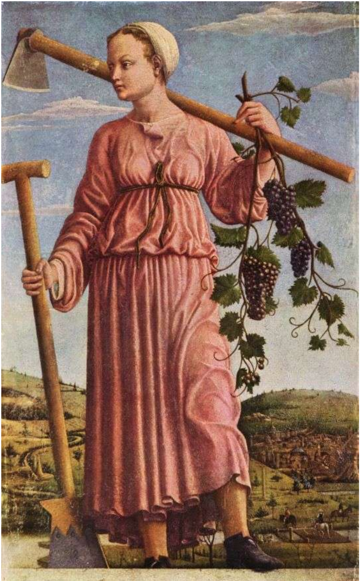
Илл. 78.9. Франческо дель Косса. Осень.