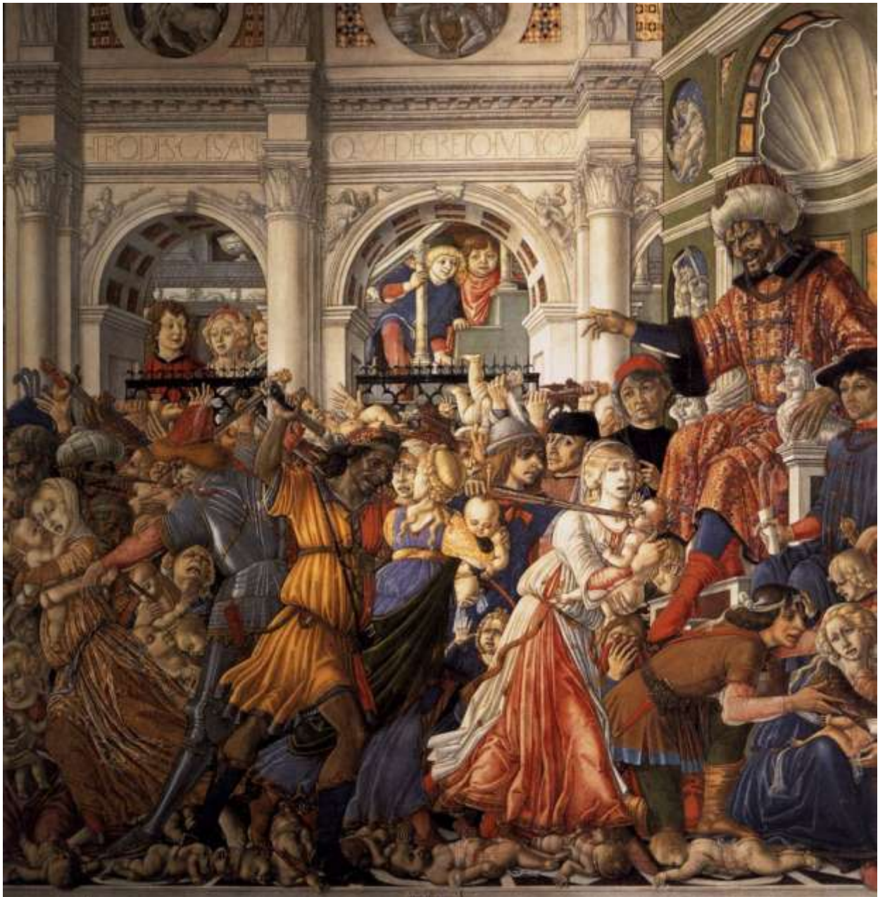
Илл. 75.6. Маттео ди Джованни. Избиение младенцев.