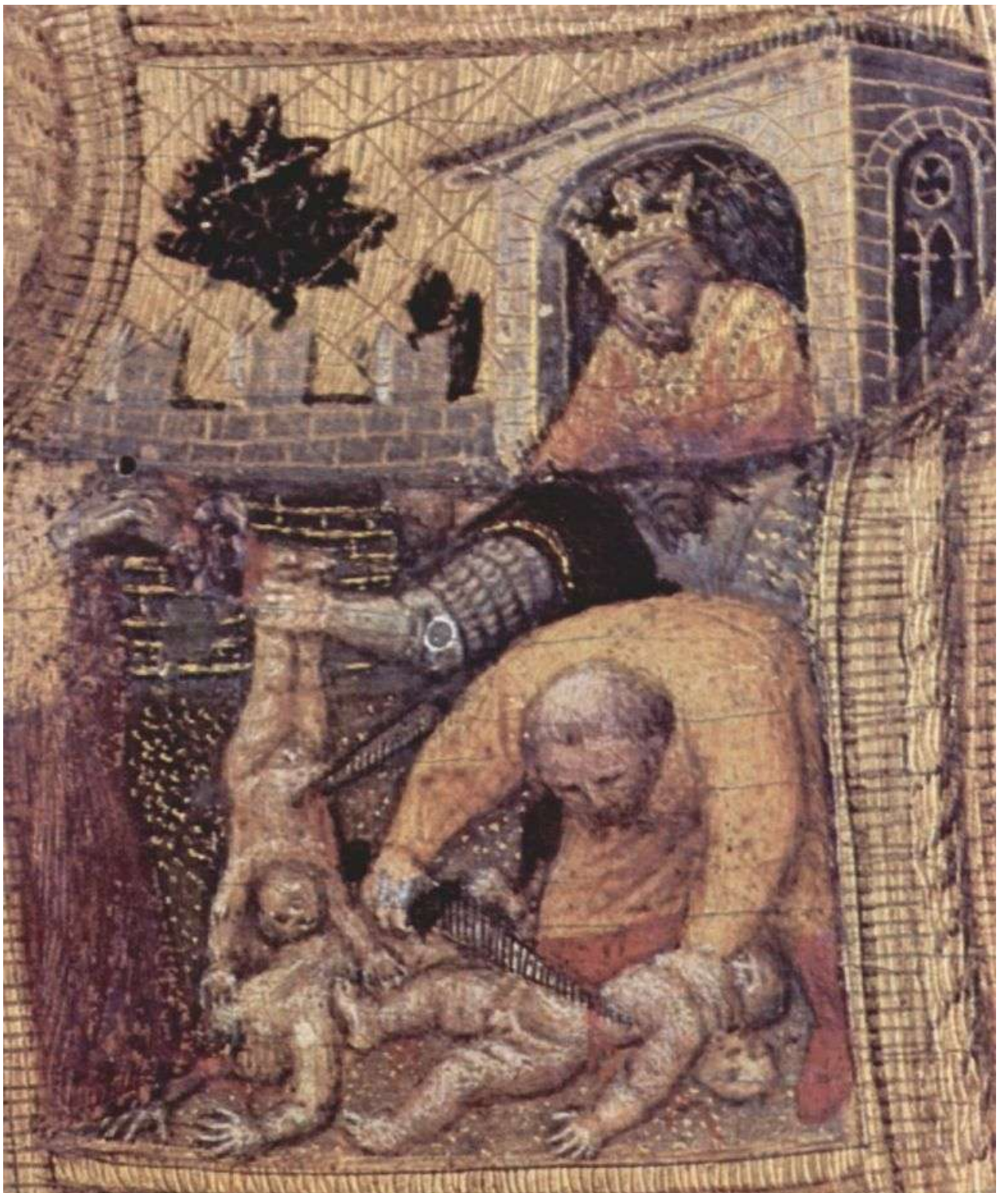
Илл. 75.4. Джентиле да Фабриано. Избиение младенцев.