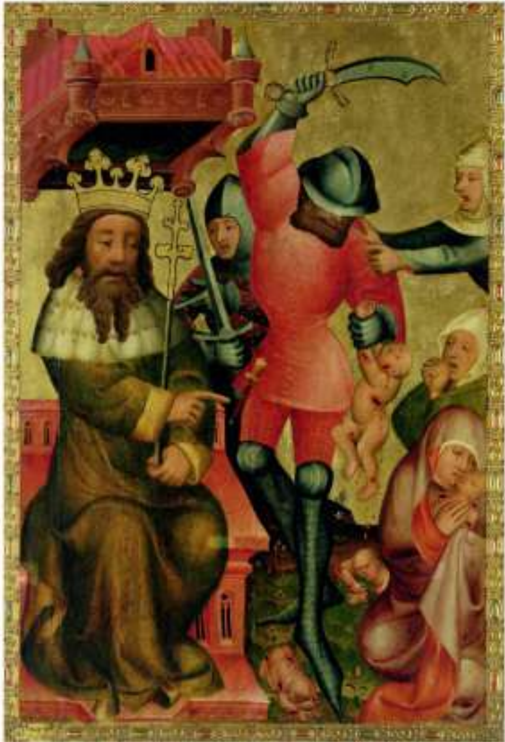
Илл. 75.3. Мастер Бертрам фон Минден. Избиение младенцев.