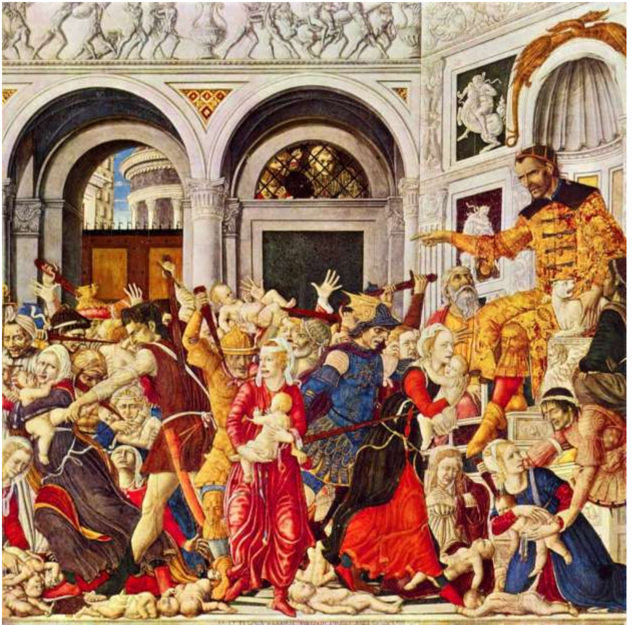
Илл. 75.1. Маттео ди Джованни. Избиение младенцев.