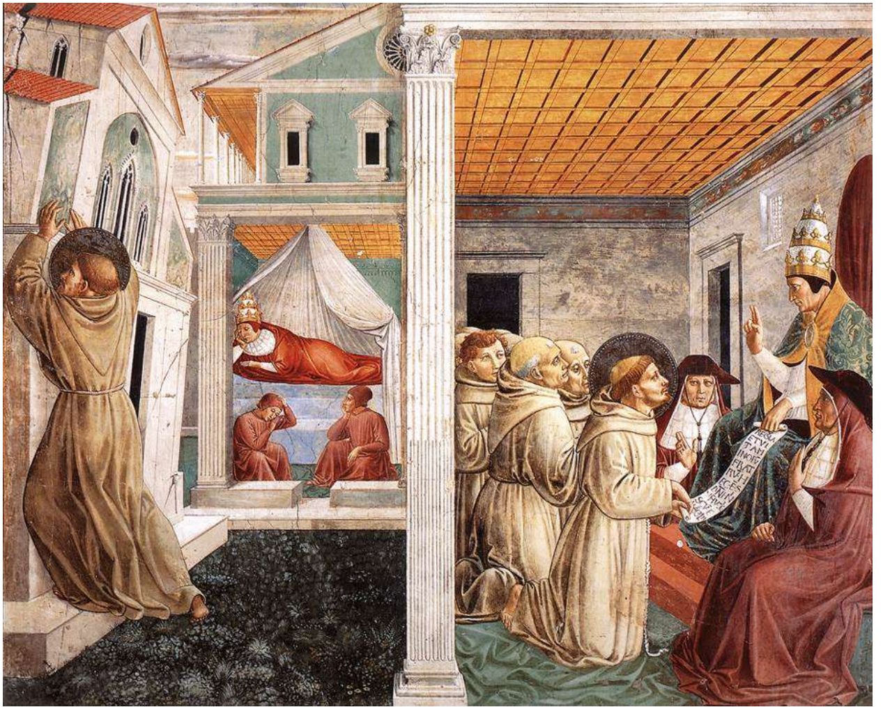
Илл. 59.11. Беноццо Гоццоли. Сон папы Иннокентия III и утверждение устава францисканского ордена папой Гонорием III.