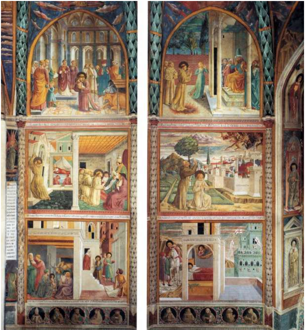
Илл. 59.12. Северная стена капеллы в апсиде церкви Сан-Франческо в Монтефалько.