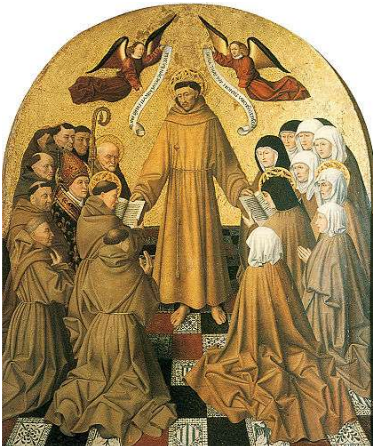
Илл. 59.3. Колантонио. Св. Франциск, вручающий устав первому и второму францисканскому ордену.