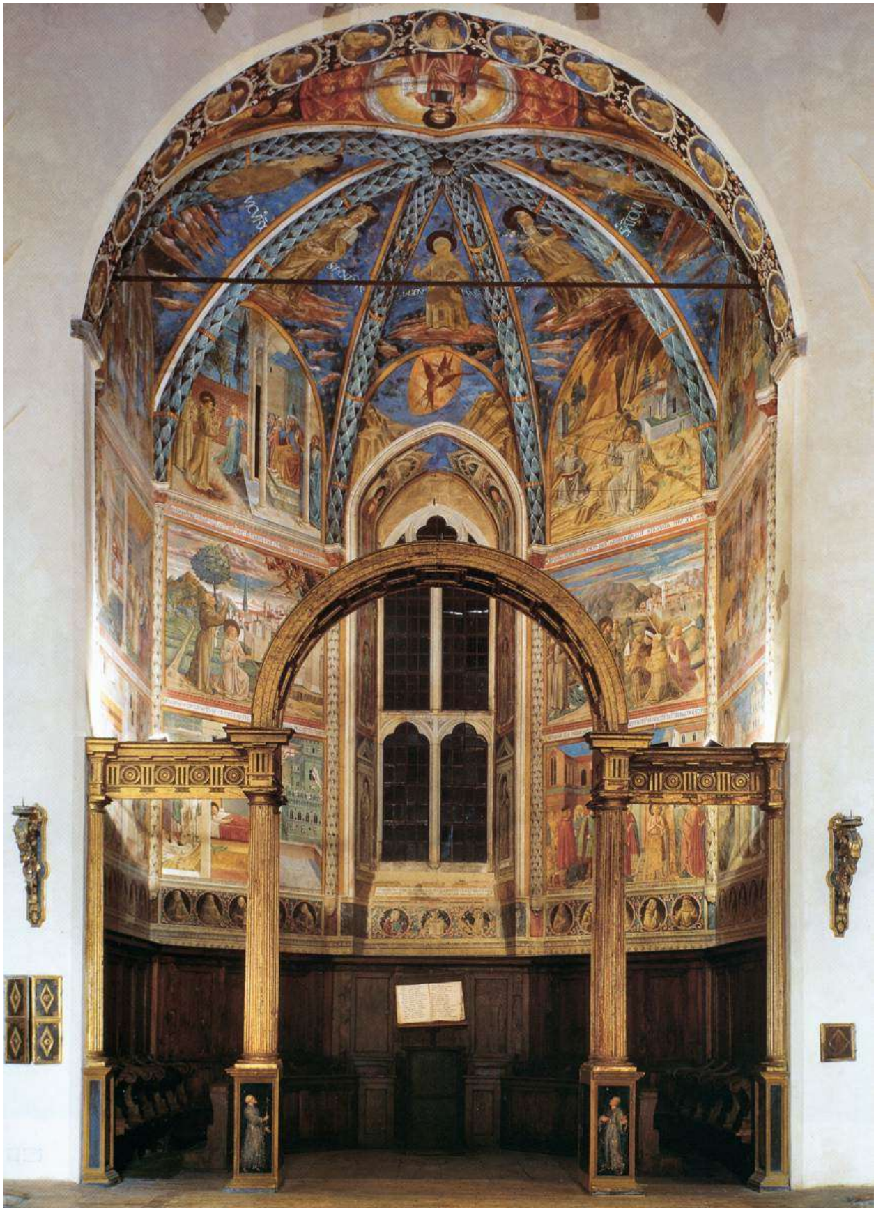
Илл. 59.13. Капелла апсиде церкви Сан-Франческо в Монтефалько.