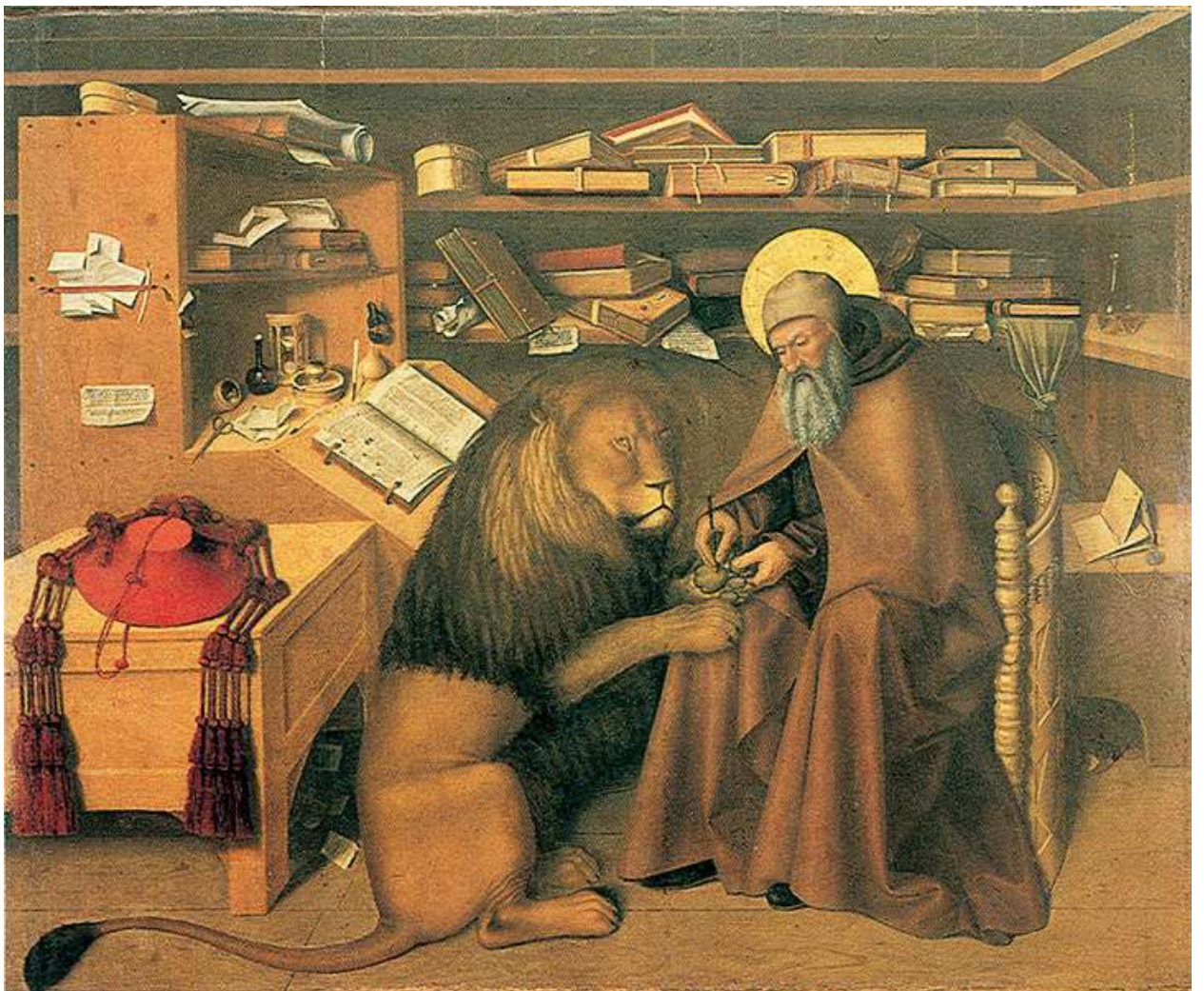
Илл. 59.1. Колантонио. Св. Иероним в мастерской.