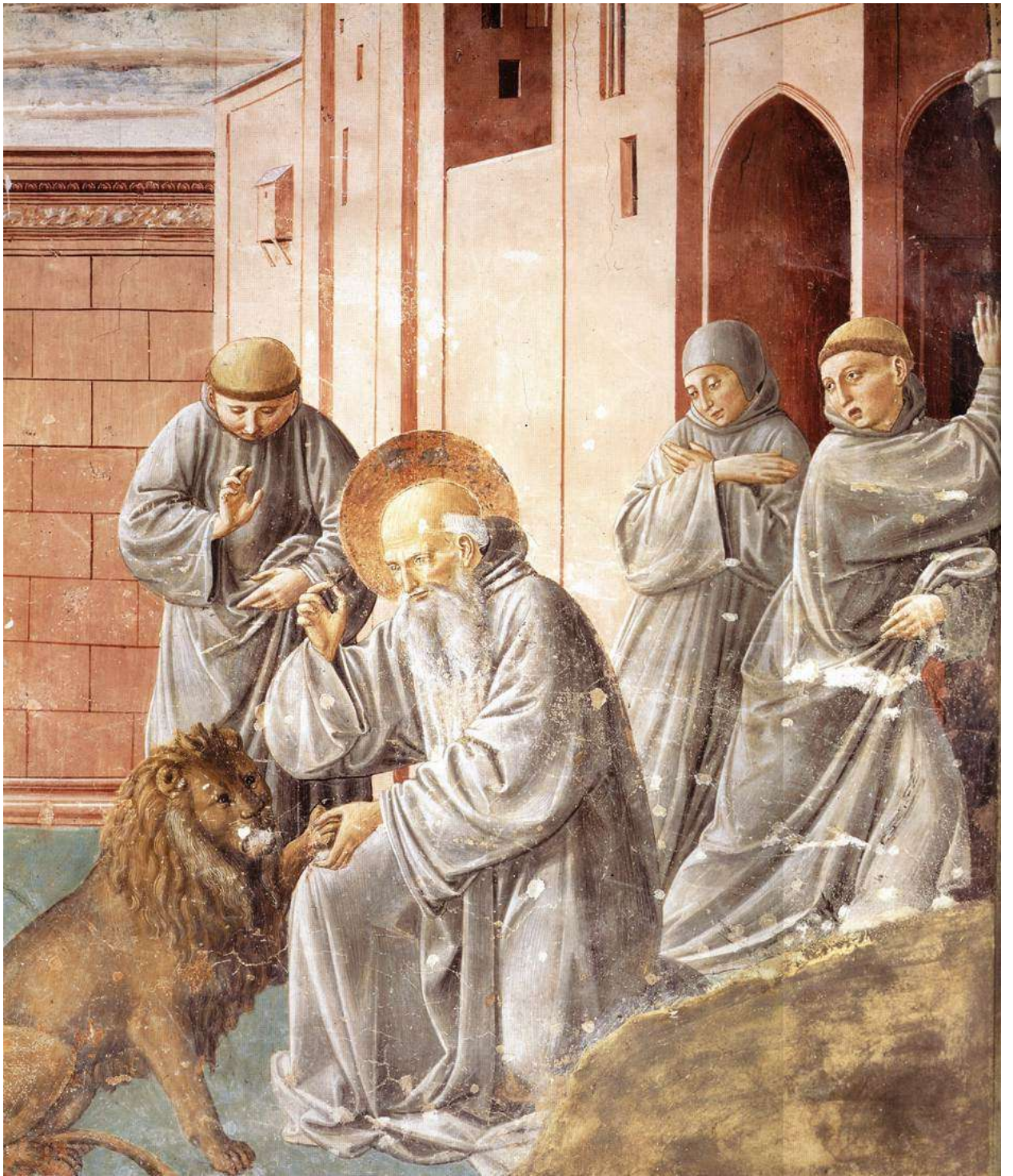
Илл. 59.2. Беночцо Гоццоли. Св. Иероним, вынимающий занозу из лапы льва.