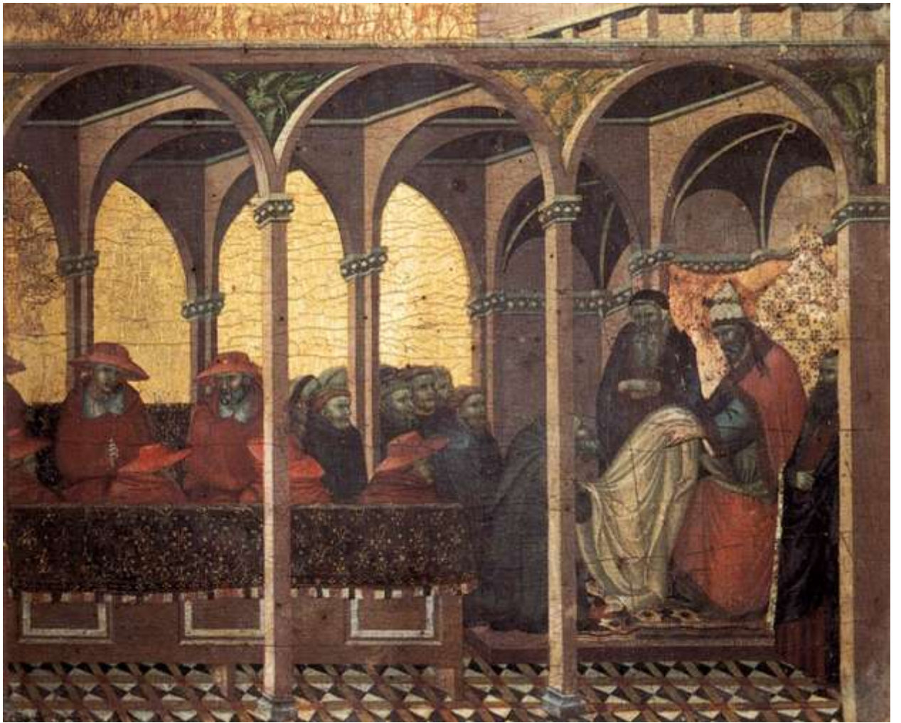
Илл. 59.8. Пьетро Лоренцетти. Папа Гонорий IV утверждает изменения в уставе кармелитов.