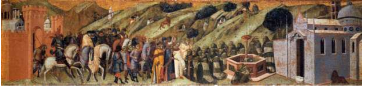
Илл. 59.6. Пьетро Лоренцетти. Св Альберт представляет устав монахам-кармелитам.