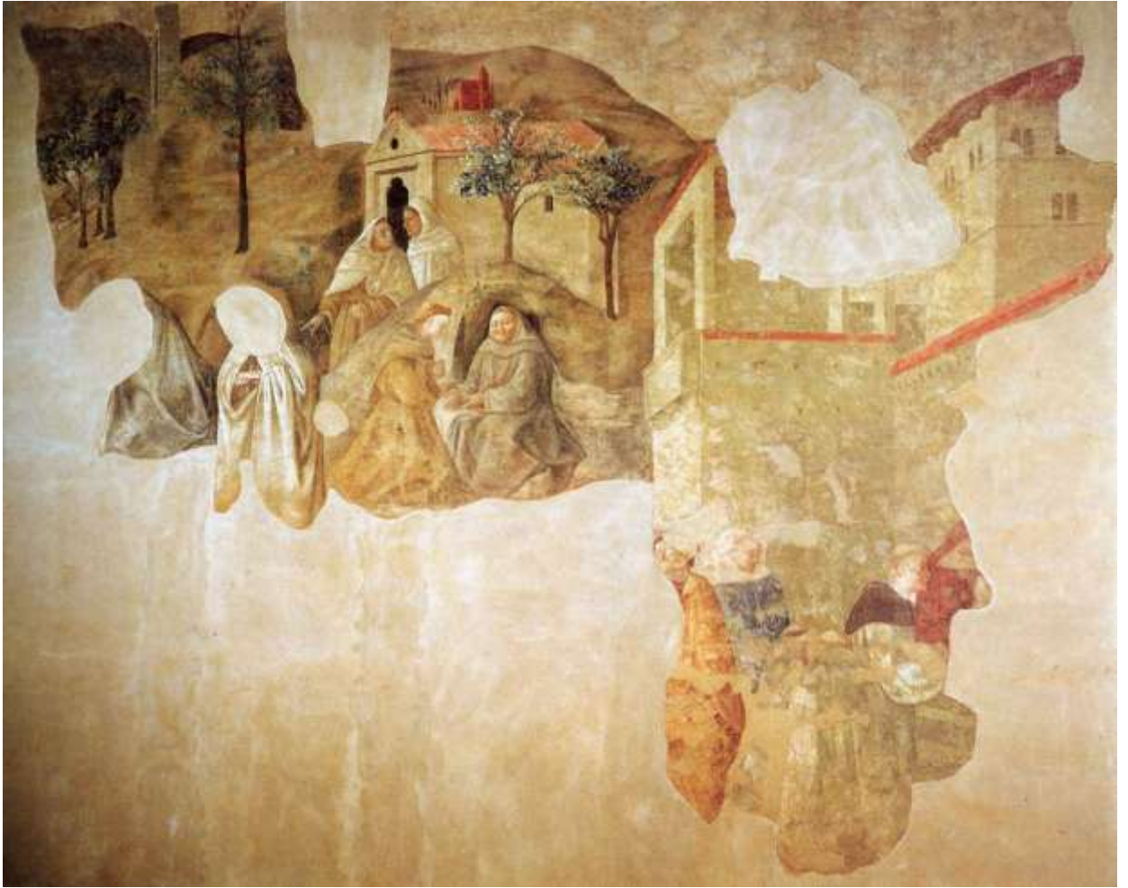
Илл. 59.9. Филиппо Липпи. Утверждение устава ордена кармелитов.