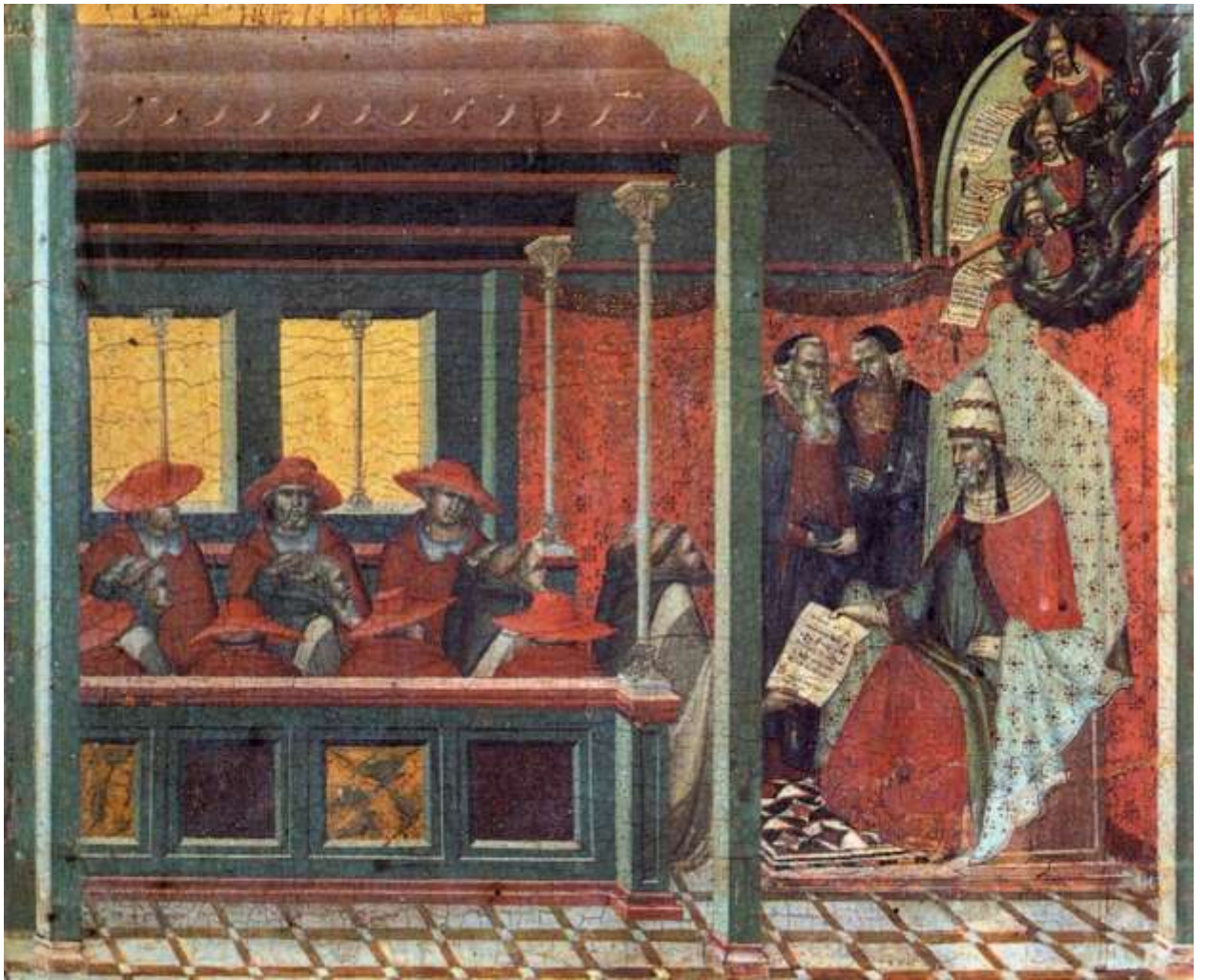
Илл. 59.7. Пьетро Лоренцетти. Папа Гонорий III передает делегации кармелитов буллу об утверждении устава.