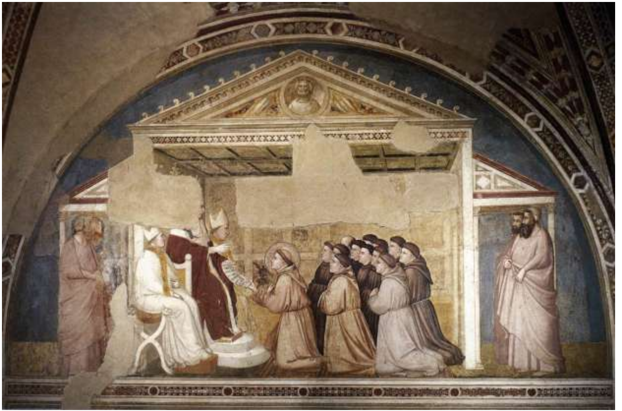
Илл. 59.5. Джотто. Утверждение Устава Францисканского ордена папой Гонорием III.