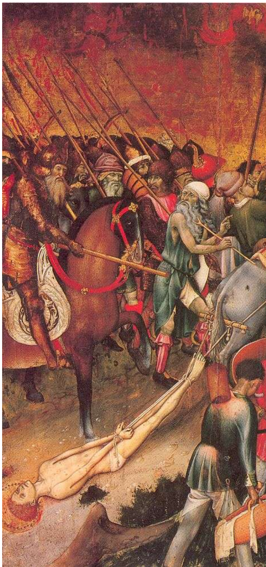
Илл. 45.11. Бернардо Марторель. Св. Георгия тащат через город.