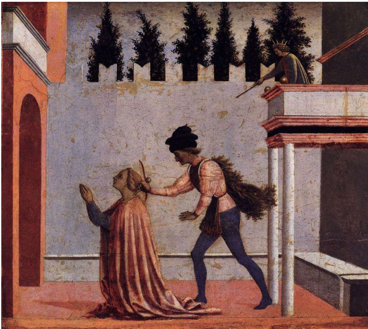
Илл. 45.10. Доменико Венециано. Мученичество св. Лючии.