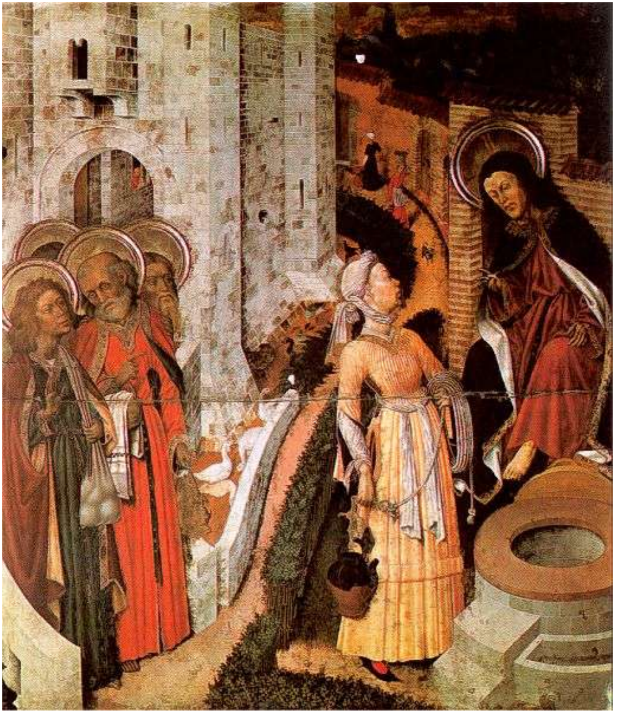
Илл. 45.4. Бернардо Марторель. Христос и самарянка.