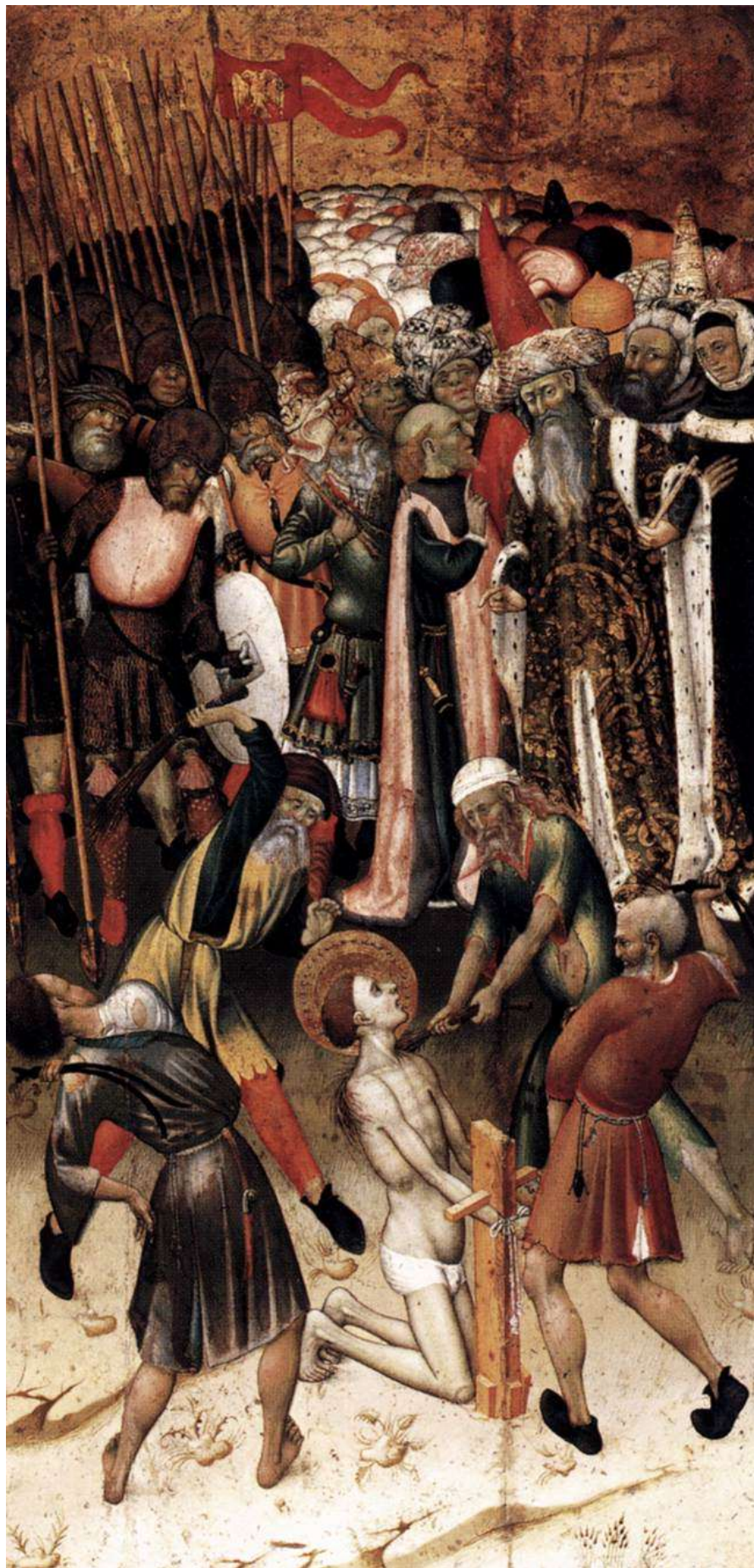
Илл. 45.8. Бернардо Марторель. Бичевание св. Георгия.