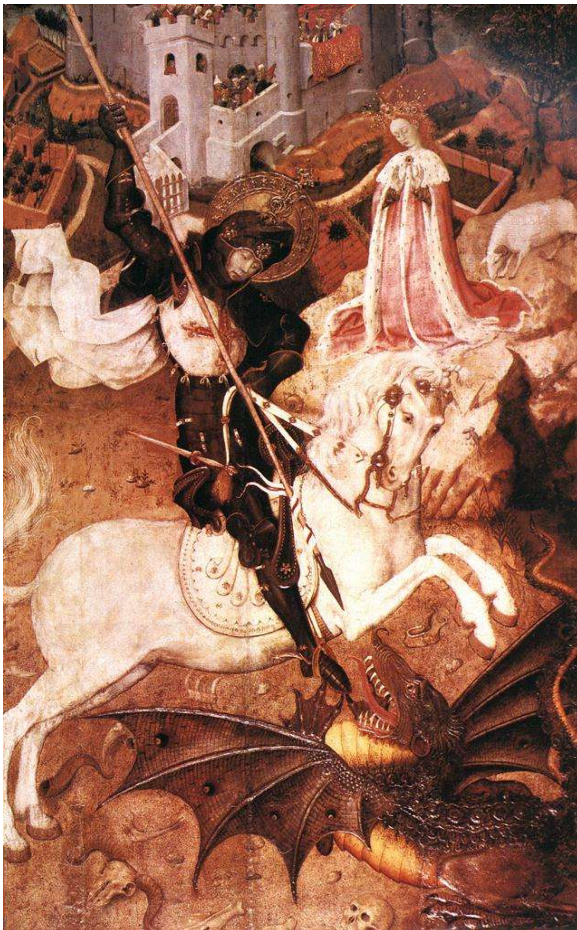
Илл. 45.5. Бернардо Марторель. Битва св. Георгия с драконом.