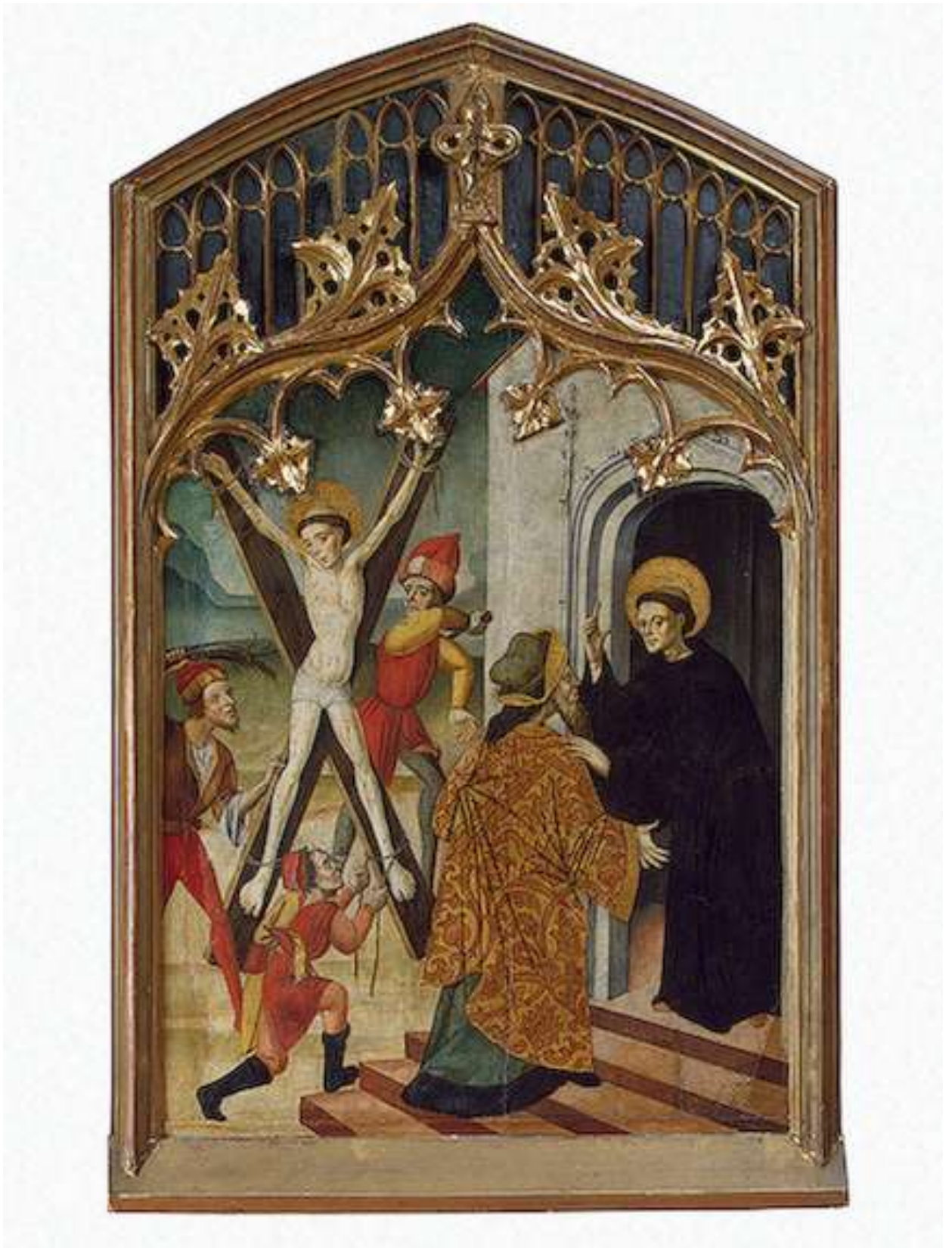
Илл. 45.13. Бернардо Марторель. Св. Винсент Мученик и св. Винсент Феррер.