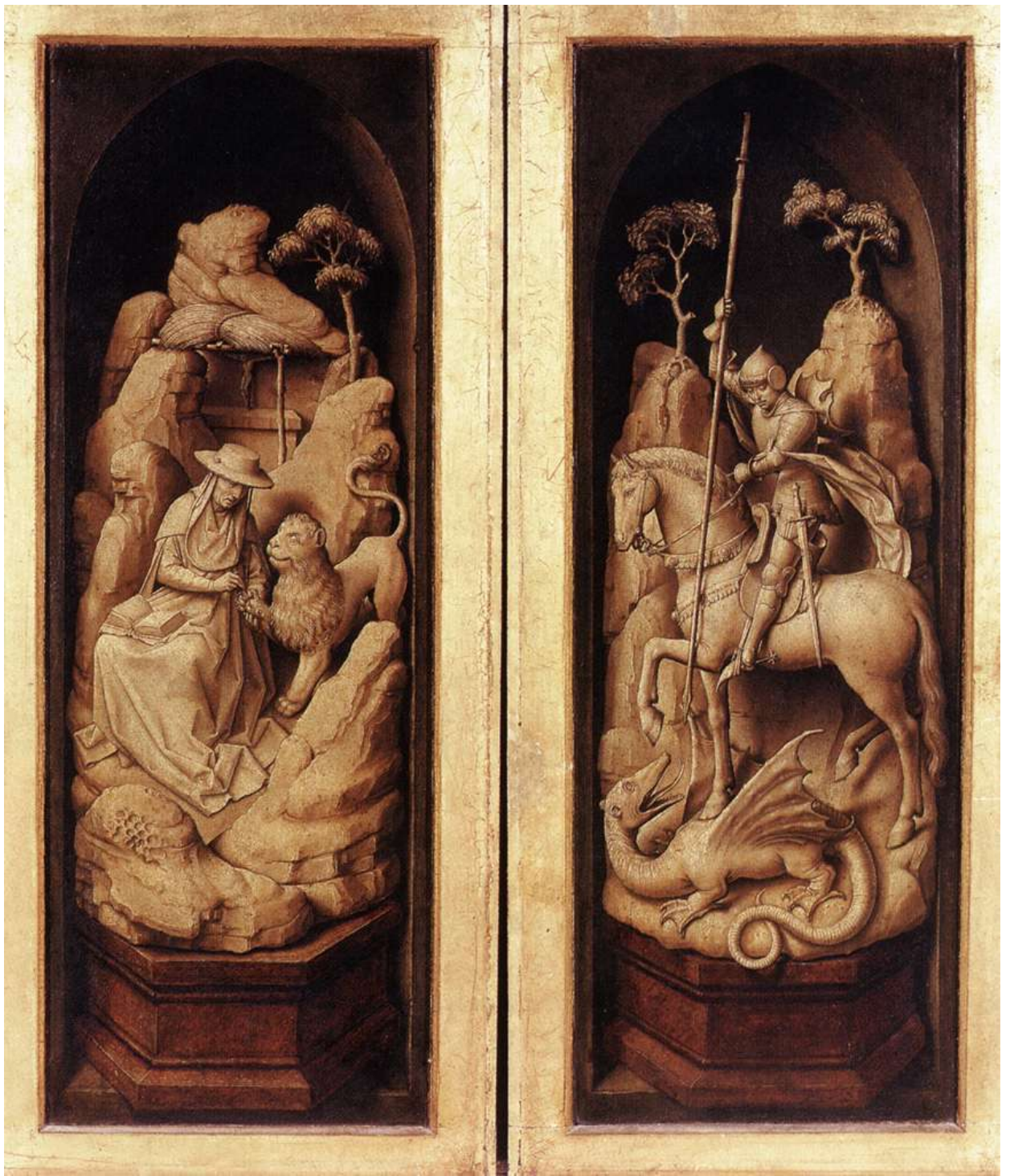
Илл. 45.7. Рогир ван дер Вейден. Триптих Сфорца (в закрытом виде).