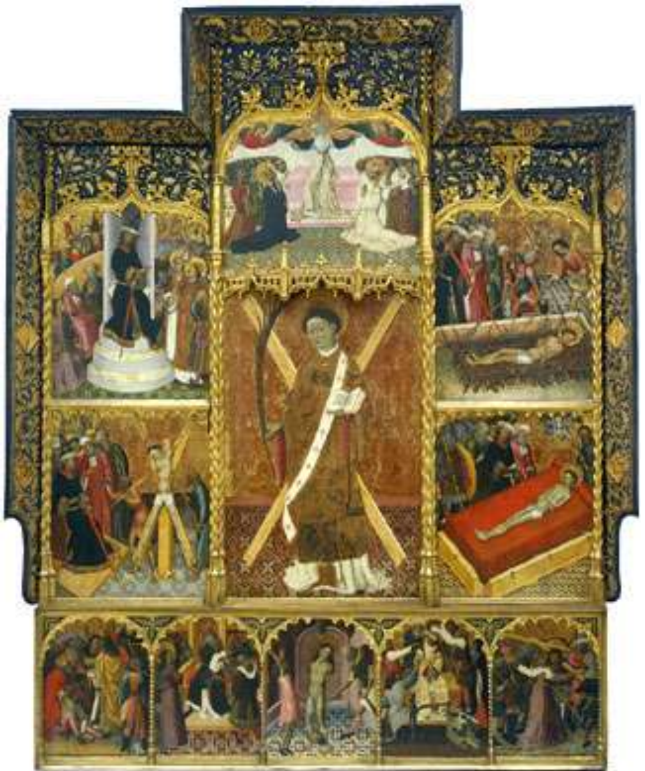
Илл. 45.1. Бернардо Марторель. Алтарь св. Винсента.