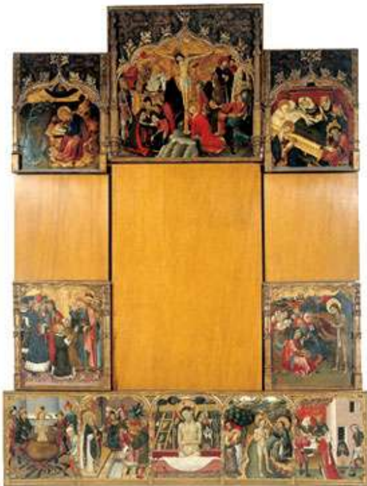
Илл. 45.3. Бернардо Марторель. Алтарь св. Иоанна.