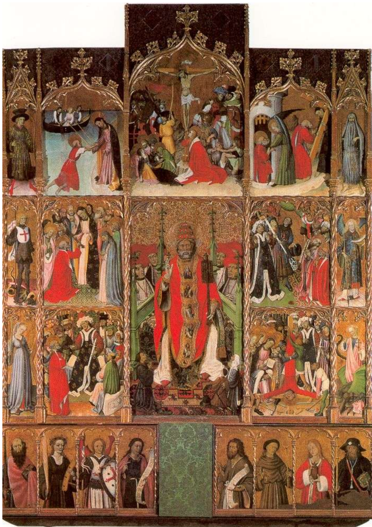
Илл. 45.2. Бернардо Марторель. Алтарь св. Петра.