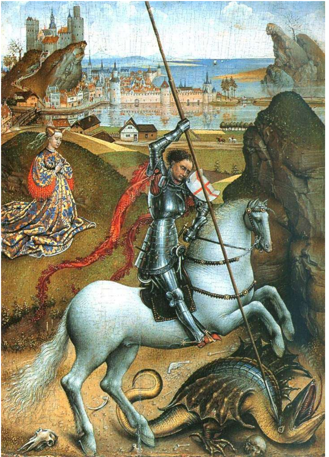
Илл. 45.6. Рогир ван дер Вейден. Св. Георгий побеждает дракона.