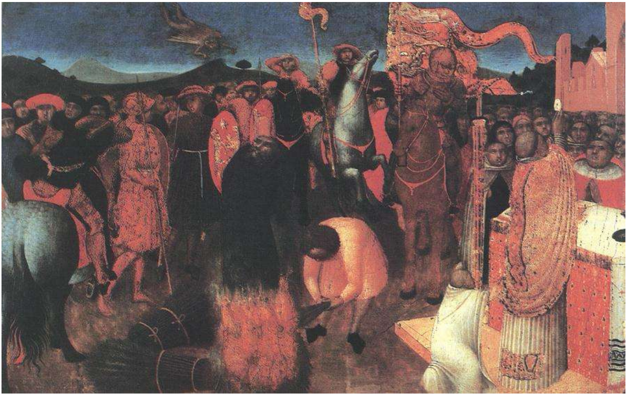
Илл. 45.9. Сассетта. Смерть еретика на костре.