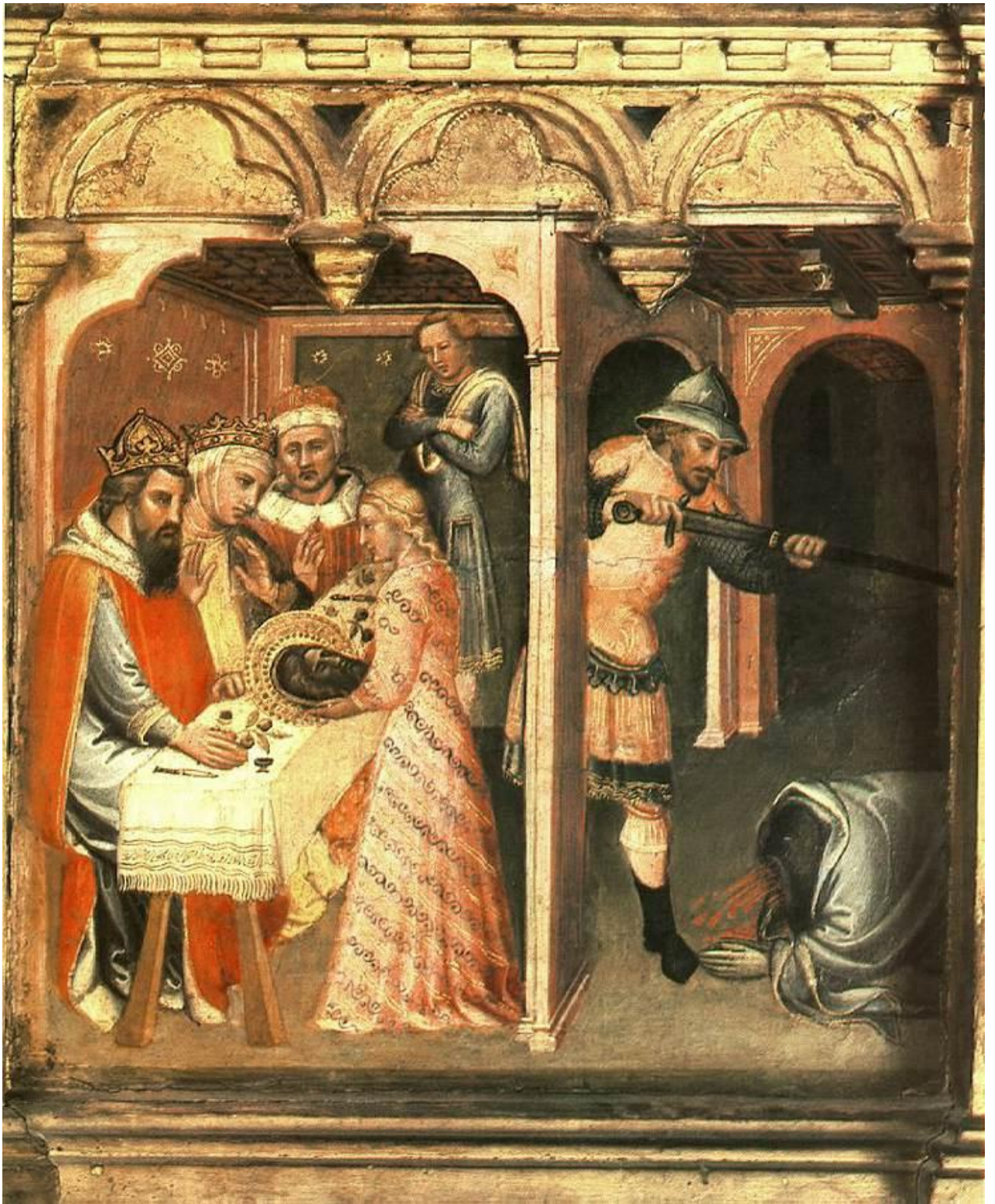
Илл. 19.1. Спинелло Аретино. Пир Ирода.