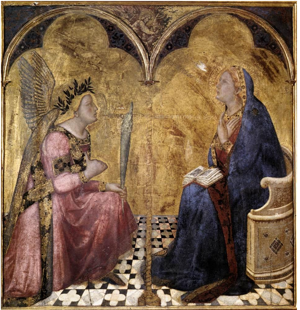
Илл. 17.2. Амброджо Лоренцетти. Благовещение.