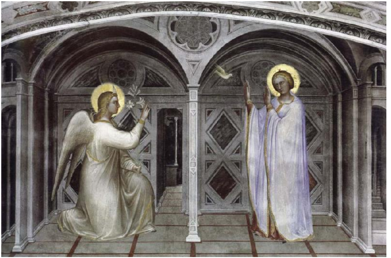
Илл. 17.1. Джусто ди Менабуои. Благовещение.